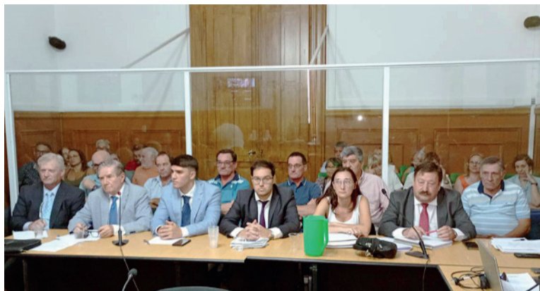
Fallo. El tribunal absolvió a los productores y aplicadores y condenó a exfuncionarios.