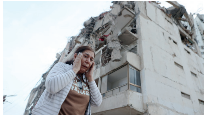
Desesperación. Miles de personas buscan a sus familiares tras la devastación en Caracas y otras localidades.