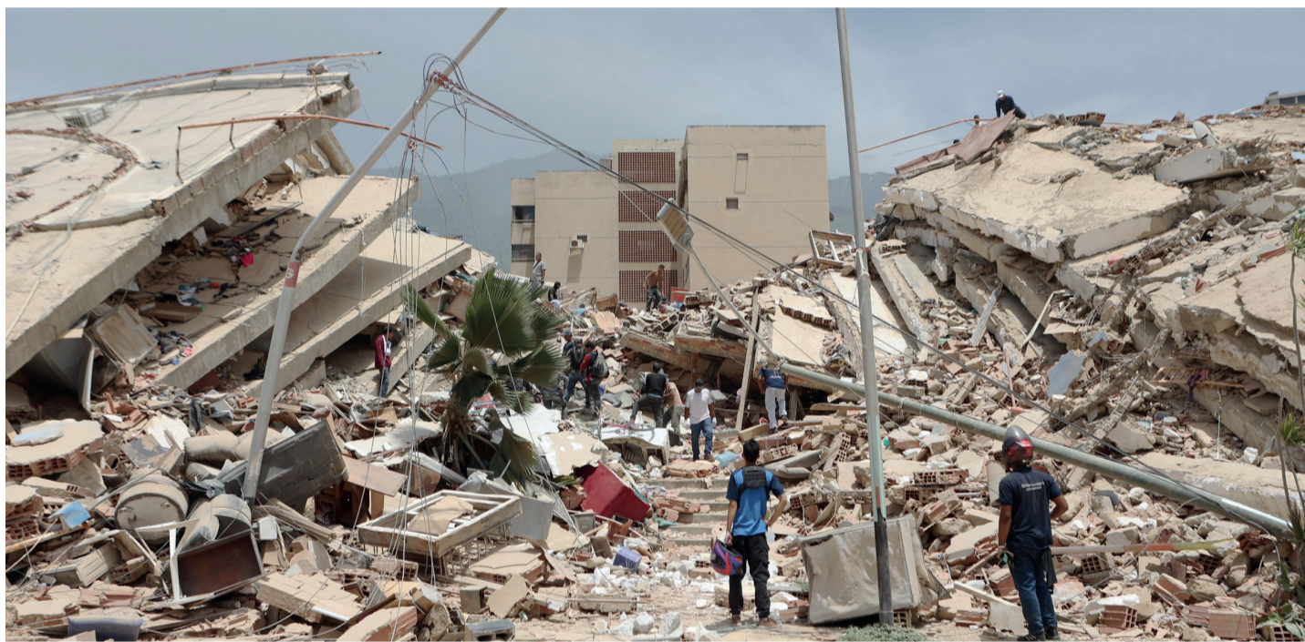
■ Siguen las tareas de rescate en edificios colapsados, mientras que equipos internacionales comenzaron a llegar para colaborar.

actualizar los fondos destinados a becas. El máximo tribunal rechazó el recurso extraordinario presentado por el Gobierno contra la resolución de la Cámara Contencioso Administrativo Federal. Página 2