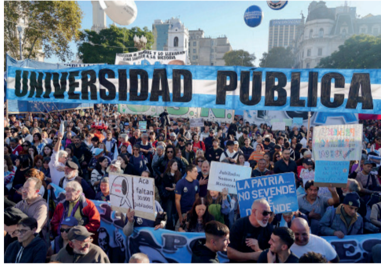
Movilizados. El reclamo en defensa de las universidades públicas.

tículos 5 y 6 de la Ley de Financiamiento Educativo, que prevén actualizaciones salariales desde 2023 hasta la actualidad y un aumento de las Becas Progresar. En cambio, el acuerdo firmado contempla una recomposición de menor alcance y únicamente incorpora mejoras para las Becas Manuel Belgrano.