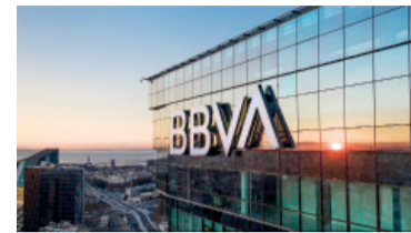
La sede del BBVA en Buenos Aires.

Más de 620.000 clientes del BBVA en todo el país recibirán reintegros por un total de $ 9.600 millones luego de que la Justicia confirmara una condena contra la entidad por cobros indebidos realizados durante la pandemia de Covid-19.