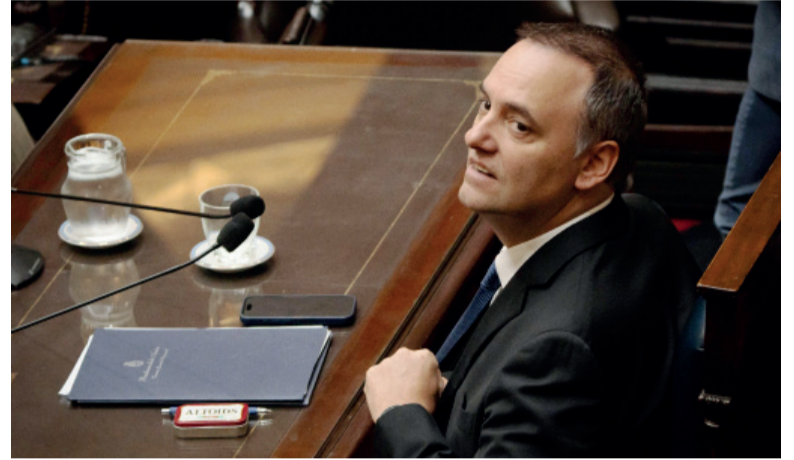
Parlamento. El futuro de Adorni podría decidirse en el Congreso.

La decisión se adoptó en la reunión de Labor Parlamentaria, en cuyo transcurso se resolvió a propuesta de los bloques opositores tratar en la próxima sesión un proyecto para citar a una interpelación al funcionario para la misma jornada en la que está previsto que brinde su informe de gestión. La reunión de Labor se realizó luego de un extenso encuentro entre la presidenta del bloque de La Libertad Avanza, Patricia Bullrich, y los