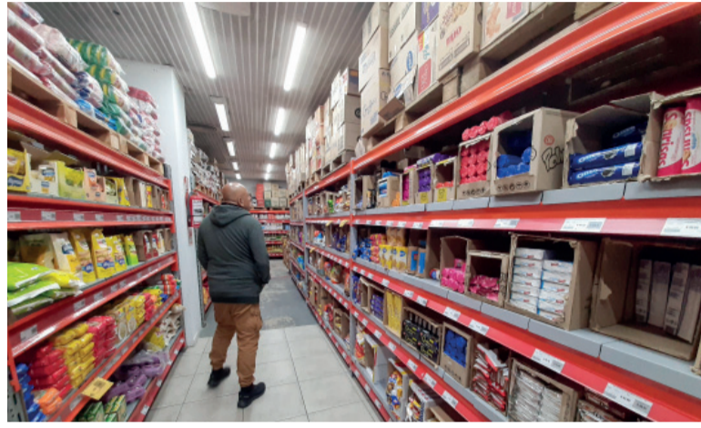
Dato. El incremento mensual del IPIIM se explicó por una suba del 2,5% en los productos nacionales y del 3,1% en los importados.

A nivel desagregado se registraron aumentos del 1,9% en alimentos y bebidas, del 2,9% en productos textiles, del 1,5% en prendas de materiales textiles y del 0,7% en vehículos automotores, carrocerías y repuestos. También se observaron subas del 3% en madera y productos de madera, del 2,6% en papel y productos de papel y del 1,8% en productos refinados del petróleo.