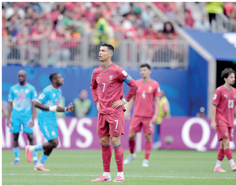
Frustrado. Cristiano tuvo sus chances, no pudo convertir y Portugal quedó obligado a reaccionar.

Ni Bernardo Silva ni Bruno Fernandes lograron imponer condiciones en la generación de juego. La selección congoleña, ordenada