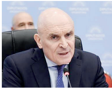
El exdiputado y candidato José Luis Espert.

La Fiscalía solicitó la declaración indagatoria de Espert