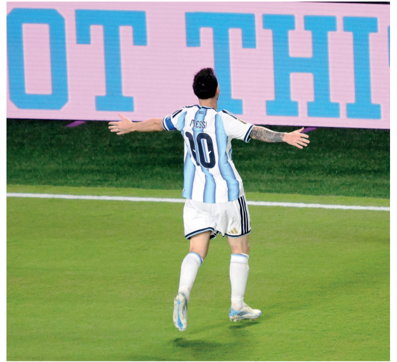
Otro récord. El diez celebra en su histórica actuación frente al conjunto africano en una noche soñada en Kansas.

Luego de recibir el premio a MVP del partido, Messi fue consultado sobre el récord que le arrebató al mítico delantero brasileño ahora tercero en la lista histórica de goleadores de los Mundiales con 15: “Ronaldo, de los que yo vi, fue uno de los más grandes y no está primero, o sea que queda solo