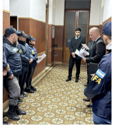
Objetivo. Se buscó desarticular redes de agresores sexuales.

Como resultado del operativo, se investigó a 111 personas: 106 varones y 5 mujeres. Se detecta-