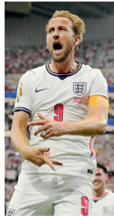
Con el pie derecho. Harry Kane y el conjunto británico celebran un buen arranque.

Con un doblete de Harry Kane, un gol de Jude Bellingham y otro de Marcus Rashford, Inglaterra derrotó 4-2 a Croacia en Dallas.