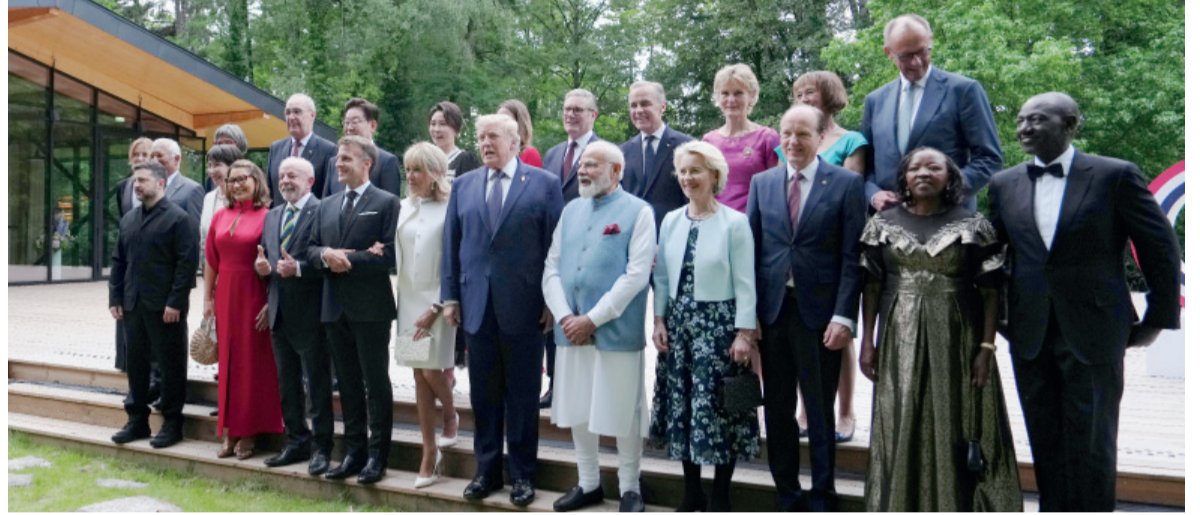
Consenso. Los mandatarios coincidieron en destacar la resistencia ucraniana.

De acuerdo con las fuentes consultadas, los mandatarios