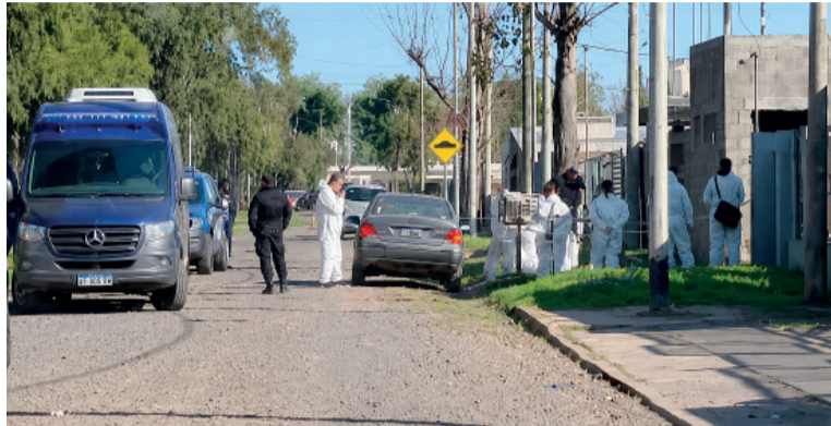
Dolor. La Policía en la casa del filicida. - La Capital -

Ante la falta de respuestas, efectivos policiales se dirigieron al domicilio y, al no lograr contacto con los ocupantes, ingresaron por el fondo de la propiedad a través de una vivienda vecina. En una de las habitaciones encontraron los cuerpos.