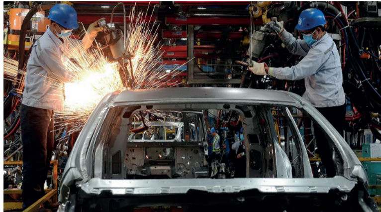
Sectores. Por debajo de la media, la industria automotriz operó al 46,5%.

El informe del Indec detalló que los bloques sectoriales con niveles de utilización por encima del promedio general fueron refinación del petróleo (86,8%), industrias metálicas básicas (73,4%), sustancias y productos químicos (69,9%), papel y cartón (67,3%) y alimentos y bebidas (60,4%). Por debajo del nivel general se ubicaron edición e impresión (58,5%), productos minerales no metá-