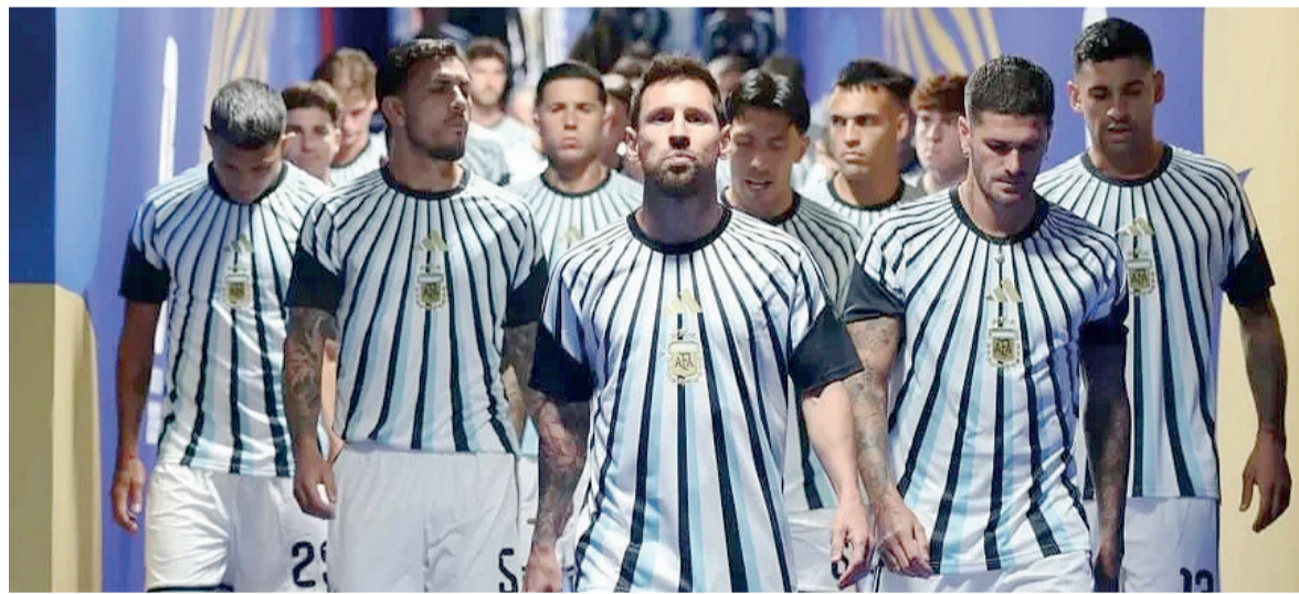
Aura. La vigente campeona del mundo presentó su candidatura para el bi.

El broche llegó a los 30 minutos del segundo tiempo. Una precisa asistencia de Nicolás González encontró nuevamente a Messi, que definió con categoría para sellar su hattrick y establecer el 3-0 definitivo.