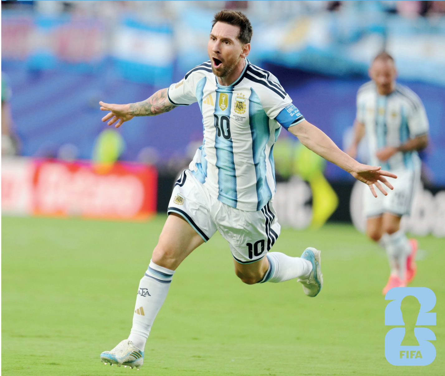
El capitán argentino frotó la lámpara por enésima vez y escribió ayer una nueva página en la historia grande del fútbol en Kansas.