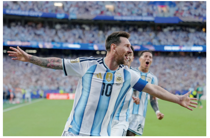
Capitán. Leo comandó el ataque con una actuación sobresaliente.

La defensa argentina respondió con solidez en el cierre del primer tiempo. Lisandro Martínez y Cristian Romero se mostraron firmes en los cruces y despejes, sosteniendo la mínima diferencia. En ataque, Alexis Mac Allister probó desde media distancia, mientras Messi volvió a intentar con un tiro