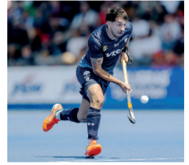
Juegan desde las 13 en Londres.

"Los Leones" enfrentan a Australia desde las 13 en Londres, por la última ventana de la FIH Pro League, certamen que otorga al campeón una plaza para los próximos Juegos Olímpicos.