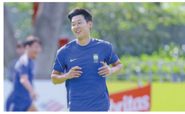
Silencio stampa del capitán.

La Selección de Corea del Sur quedó envuelta en una inesperada polémica en pleno Mundial 2026 luego de que se filtrara una conversación privada entre dos periodistas de ese país, quienes se burlaron del capitán y máxima figura del equipo, Heung-min Son.