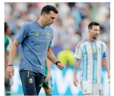
Análisis. El DT, satisfecho.

Tras cerrar una jornada cargada de emociones y compromiso, el capitán de la Selección dejó un mensaje final que resume su sentir actual: "Hoy el fútbol es muy competitivo, todas las se-