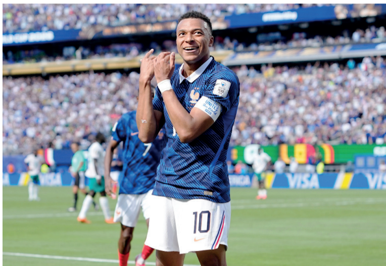
Doblete. El capitán abrió el camino al triunfo.

El segundo tiempo mostró una versión más agresiva del conjunto galo. Con Michael Olise como principal generador de juego, los europeos comenzaron a inclinar la cancha y obligaron a intervenir varias veces al arquero Édouard