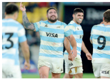
Inquietud. Sclavi se perdería el encuentro frente a Escocia.

Tomás Etcheverry se despidió en la primera ronda del ATP 500 de Halle tras caer por 6-3 y 6-4 ante el ruso Daniil Medvedev, séptimo del ranking mundial. El platense no logró inquietar a un rival que marcó diferencias con su servicio y experiencia sobre césped. Medvedev, ex número uno del mundo y dos veces semifinalista de Wimbledon, avanzó a octavos de final.