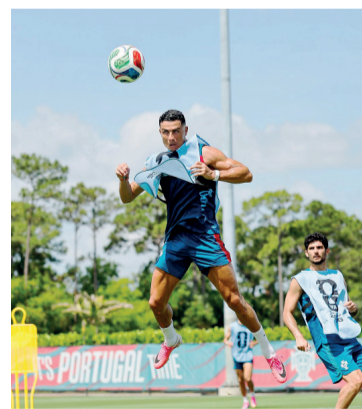
Cristiano juega su sexta Copa.

Del otro lado estará una selección congoleña que protagoniza uno de los regresos más esperados del torneo. República Democrática del Congo vuelve a disputar un Mundial después de 52 años de ausencia, ya que su única participación había sido en Alemania 1974.