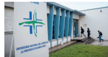
Ciencias de la Salud de la UNICEN.

Un docente de la sede de Olavarría de la Universidad Nacional del Centro (UNICEN) debió presentar su renuncia luego de decir, en medio de una clase, que a una alumna, a quien calificó de "montonera", habría que "que matarla, cargarla en el baúl de un Falcon verde y tirarla por ahí".