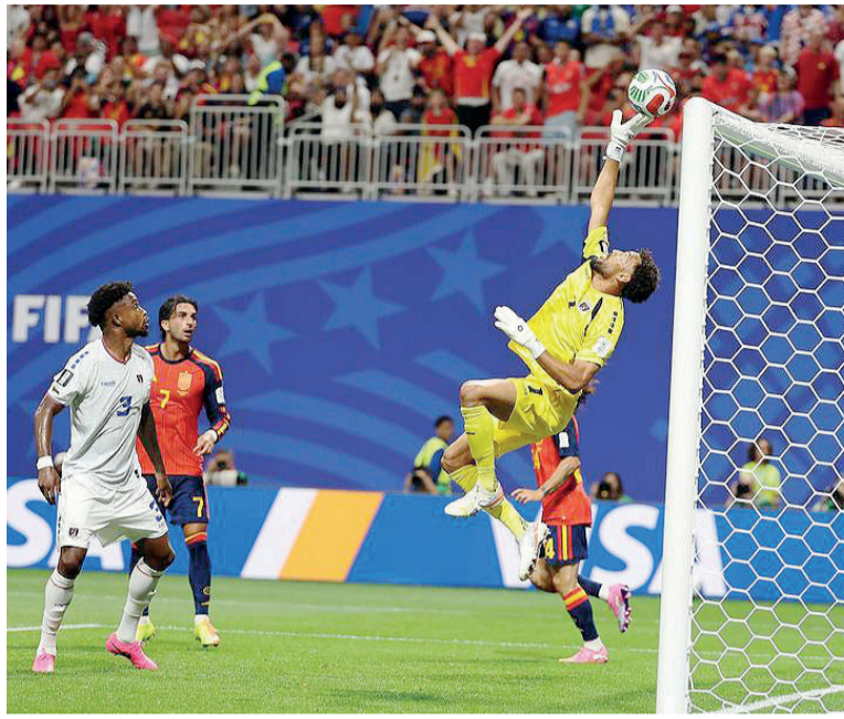
Figura. Vózinha fue una muralla.

El desarrollo también expuso la falta de peso ofensivo de los delanteros españoles, con un Mikel Oyarzabal prácticamente desconectado durante largos pasajes