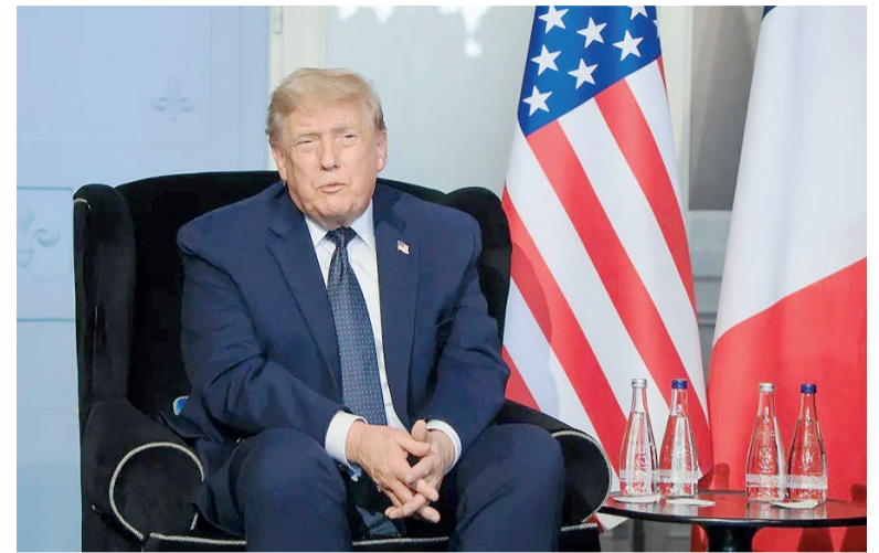
Personalmente. Según la Casa Blanca, Donald Trump quiso firmar él mismo el acuerdo.

El presidente de Irán, Masoud Pezeshkian, dijo ayer que el me-