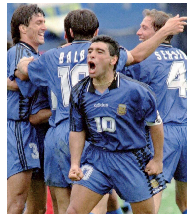
Diego. Antecedente en USA.

Los antecedentes más recientes tampoco invitan a la tranquilidad. En Rusia 2018, el conjunto dirigido por Jorge Sampaoli igualó 1-1 ante Islandia en una de las mayores sorpresas de la fase de grupos. Cuatro años más tarde, en Qatar 2022, sufrió una inesperada derrota frente a Arabia Saudita por 2-1. Sin embargo, aquella caída terminó convirtiéndose en el punto de partida de una campaña inolvidable que concluyó con la obtención del tercer título mundial.