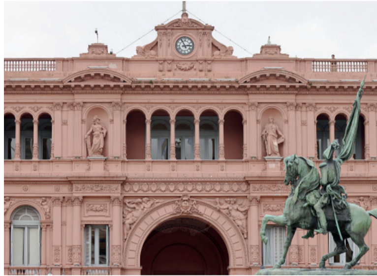
Recaudación. Del total de impuestos, 40 corresponden al nivel nacional, 5 menos que hace un año.

Entre los impuestos nacionales figuran algunos de los más conocidos y relevantes para la recaudación, como el IVA, Ganancias (rebautizado recientemente como impuesto a los ingresos personales para el caso de las personas físicas), Bienes Personales, el impuesto sobre los créditos y débitos bancarios, los derechos de exportación e importación y distintos gravámenes sobre combustibles, bebidas alcohólicas, cigarrillos y apuestas.