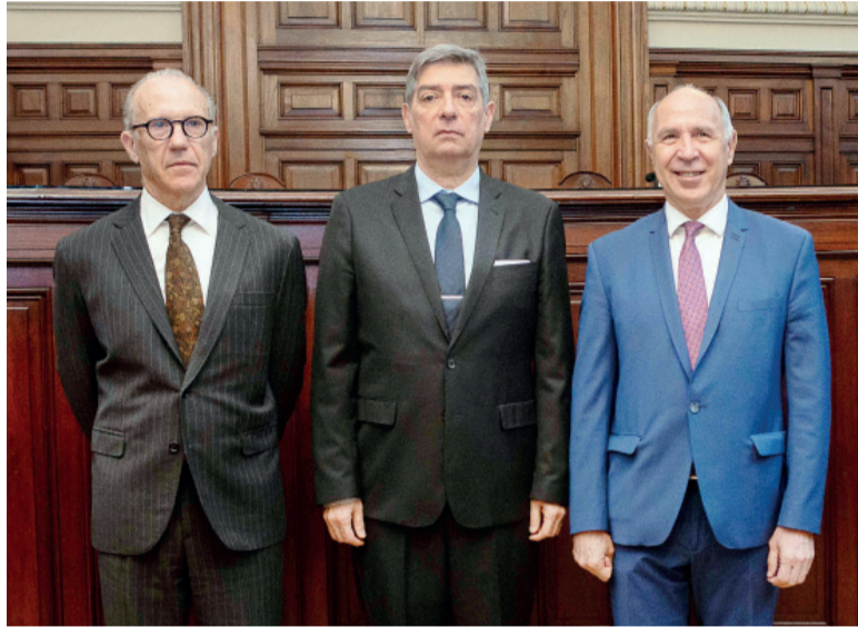
Solo tres. La actual composición de la Corte Suprema, a la espera de nuevas designaciones.

El Gobierno avanzará con un decreto que busca flexibilizar el nombramiento de los integrantes de la Corte Suprema de Justicia. Desde Casa Rosada sostienen que el objetivo central será hacer más transparentes el proceso por el cual son propuestos y designados los ministros del tribunal supremo (que actualmente está compuesto por solo tres miembros, sobre un total de cinco) y pretende evitar la duplicación de instancias administrativas. Asimismo, aclararon que las modificaciones estarían vinculadas con la eliminación de una serie de recomendaciones que