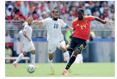
Saltaron chispas en la cancha.

Bélgica empató 1-1 con Egipto en el estadio de Seattle, por la primera fecha del Grupo G del Mundial 2026. En un partido disputado en Estados Unidos, el conjunto africano estuvo cerca de dar el golpe ante uno de los seleccionados más fuertes de Europa, aunque terminó resignando la victoria en el complemento.