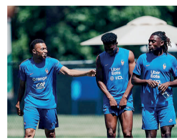
Mbappé sueña con otra conquista.

Del otro lado estará Senegal, que buscará dar el golpe y ratificar su crecimiento en el escenario internacional. Con referentes de la talla de Sadio Mané y Kalidou