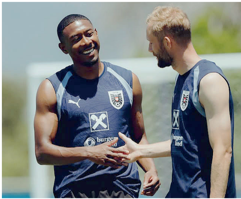
Sonrisas. Alaba liderará las ilusiones de Austria.

En la vereda de enfrente, Jordania se presenta como uno de los elencos más humildes de la competición. Conscientes de su papel de "cenicienta" en el Grupo J, el equipo sabe que cualquier resultado positivo frente a contrincantes de mayor jerarquía sería una gesta histórica