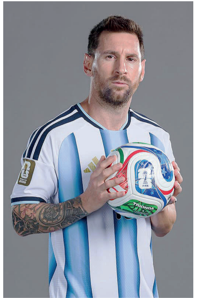
Capitán. El astro rosarino disputará su sexta copa del Mundo.

En la mitad de la cancha aparecerán nombres ya consolidados dentro del ciclo Scaloni. Enzo Fernández, Rodrigo De Paul y Alexis Mac Allister conformarán el me-