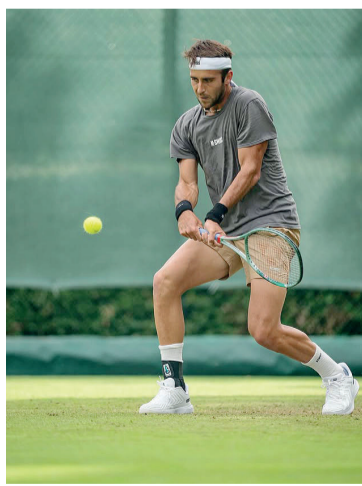
Césped. Debut en Halle.

Más tarde, el alemán Alexander Zverev, primer preclasificado