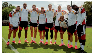
Los teutones ponen primera.