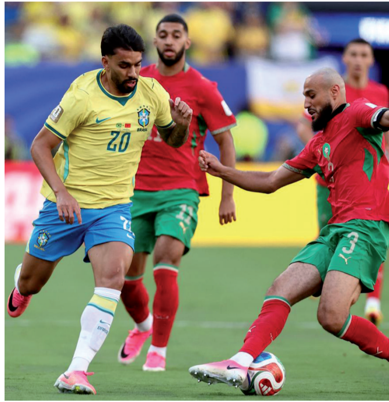
Paridad. El pentacampeón jugó un flojo partido en su estreno en la Copa.

La Canarinha intentó inclinar la balanza mediante la circulación de balón y las proyecciones