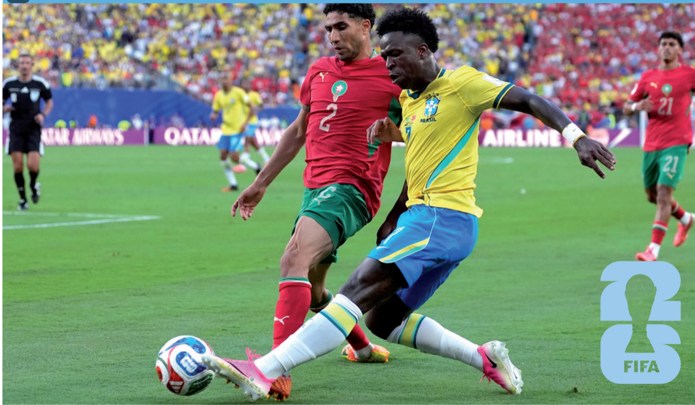
La Canarinha quedó en deuda con el fútbol y su público, pero logró sumar ante un equipo afianzado.