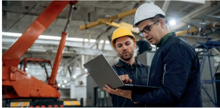
Alarma. El fenómeno atraviesa tanto al sector privado como al público.

La comparación interanual tampoco ofrece señales alentadoras. Respecto de marzo de 2025, el empleo asalariado disminuyó 1,2%, equivalente a 116.500 trabajadores menos. El sector privado