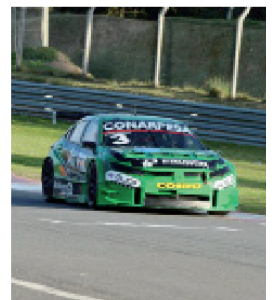
Líder. La Honda Civic se escapa.