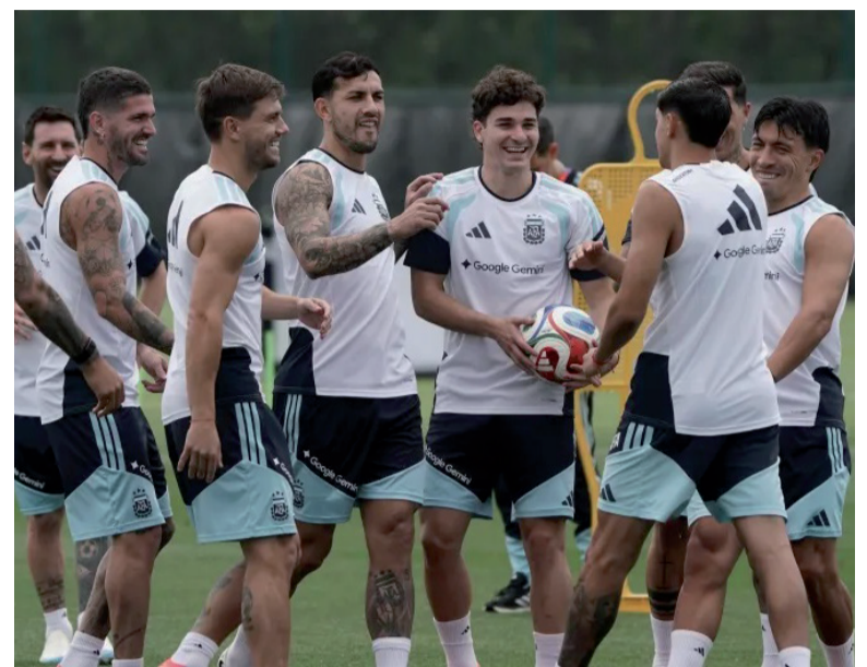
Buen humor. El grupo se distiende mientras Scaloni arma el rompecabezas.

La evolución de "Dibu" genera optimismo dentro de la delegación argentina, que espera contar con una de sus máximas figuras desde el comienzo del torneo. Su presencia representa un factor fundamental para las aspiracio-