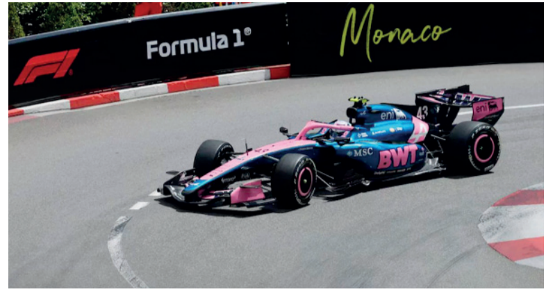
A levantar. Jornada complicada en el principado.

Terminó 15° en ambas sesiones y deberá mejorar de cara a la clasificación. Ferrari marcó el ritmo con Hamilton y Leclerc.