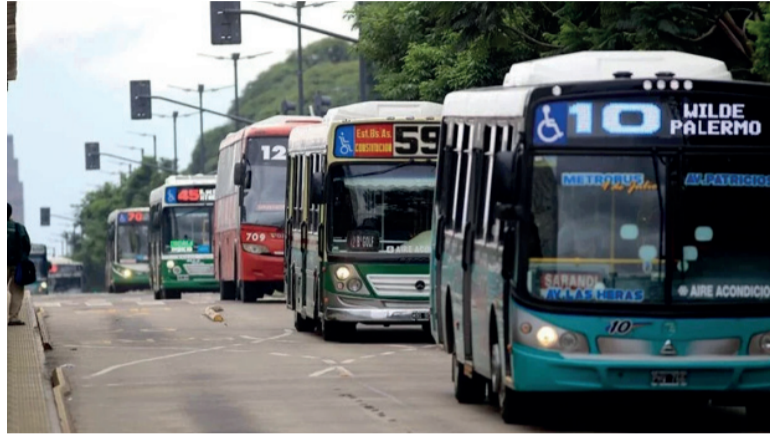
Humor social. La UTA advirtió que “la paz social peligra”.

A su vez, en la carta aseguraron que “dejamos en claro que nuestro pedido salarial es a partir del mes de mayo del corriente año”, recordaron y subrayaron que