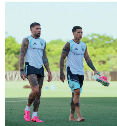
Enzo y "Ota" encabezan la lista.

No todos los futbolistas de la Selección argentina llegarán a Norteamérica con la misma carga de competencia. Mientras algunos arriban tras temporadas marcadas por lesiones o poca continuidad, otros desembarcan en la gran cita con un volumen de minutos que los posiciona entre los jugadores con mayor rodaje del plantel de Lionel Scaloni.