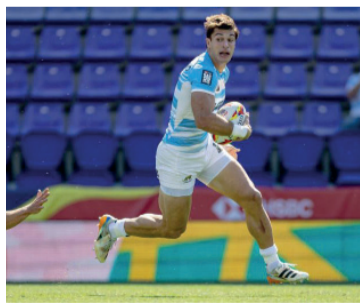
Garra. La Selección va por la reacción en Bordeaux.

En el complemento, algunas infracciones condicionaron al conjunto argentino y el local aprovechó esos momentos para inclinar la balanza. Jordan Sepho y Gregoire Arfeuil marcaron los tries que sellaron el triunfo francés.