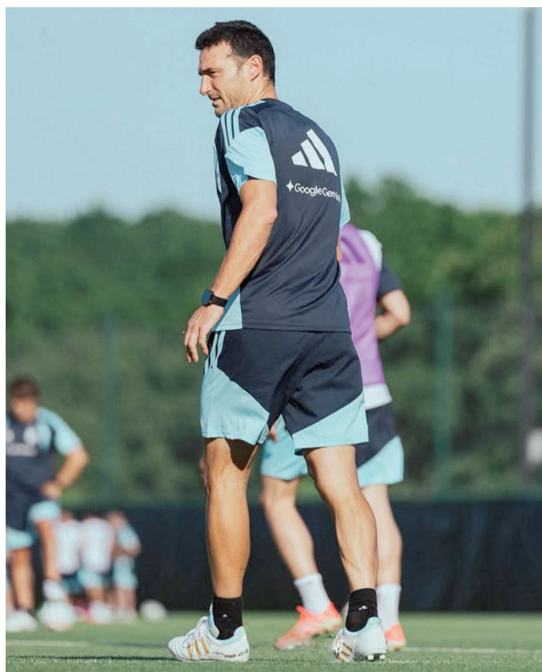
Expectativa. Scaloni ensaya variantes antes del debut en Norteamérica.

novedades: Lautaro Martínez comandaría el ataque acompañado por Giuliano Simeone y Thiago Almada, en una delantera que mezcla movilidad, presión y velocidad. Para varios de ellos será la posibilidad de asumir protagonismo en una competencia interna que todavía permanece abierta.