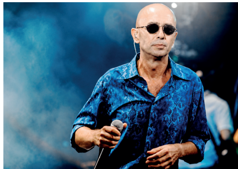
Gran pérdida. Carlos Alberto "el Indio" Solari tenía 77 años.

La separación de Los Redondos (nombre con el que se llamaba popularmente a la banda) en 2001 supuso un punto de inflexión en la carrera de Solari. En 2004 presentó el primer álbum de su nueva etapa, con su nuevo combo llamado Los Fundamentalistas del Aire Acondicionado. Se trata de "El tesoro de los inocentes (Bingo Fuel)". Siguió con "Porco Rex" en 2007, "El perfume de la tempestad" en 2010 y "Pajaritos, bravos muchachitos"