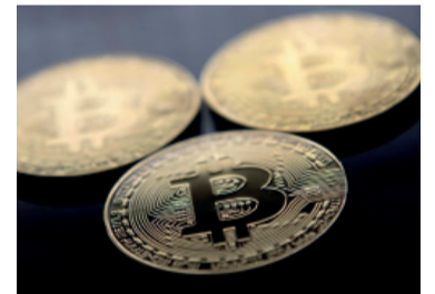
Bitcoin, se acerca a la barrera de los US$ 60.000

Las pérdidas profundizan la que ya es la racha bajista más larga de bitcoin desde agosto, iniciada después de que Strate-