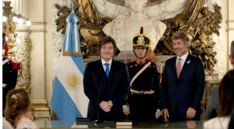
El Gobierno. Logró aprobar en el Senado 74 pliegos para cubrir vacantes a la justicia