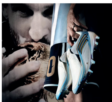
Blanco, celeste y dorado.

La presentación estuvo acompañada por imágenes que recorren distintas etapas de su trayectoria, desde sus inicios hasta la consagración en Qatar 2022. El lanzamiento no solo apunta al impacto visual, sino también a reforzar la