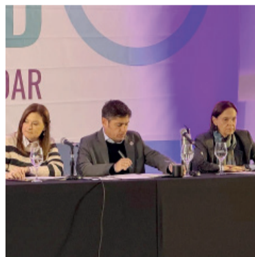
Axel Kicillof habla de Solari.

El gobernador bonaerense Axel Kicillof recordó ayer a Carlos "Indio" Solari horas después de su muerte y, con sentida emoción durante un acto realizado en Ensenada definió al artista como un "héroe argentino". Antes de iniciar su discurso en el marco del V Congreso por la Igualdad, en la Facultad de Psicología de la UNLP, Kicillof pidió un momento para recordar al exlíder de Patricio Rey y sus Redonditos de Ricota. "Es un día tristísimo para cientos de miles de ricoterros, entre los que me considero uno. Despedimos al Indio y la verdad es que despedimos a un artista, pero sobre todo a un héroe argentino", expresó con la voz entrecortada y visiblemente conmovido. El gobernador sostuvo que la muerte del Indio representa una pérdida cultural para la Argentina y destacó la influencia que tuvo sobre distintas generaciones. "Es alguien