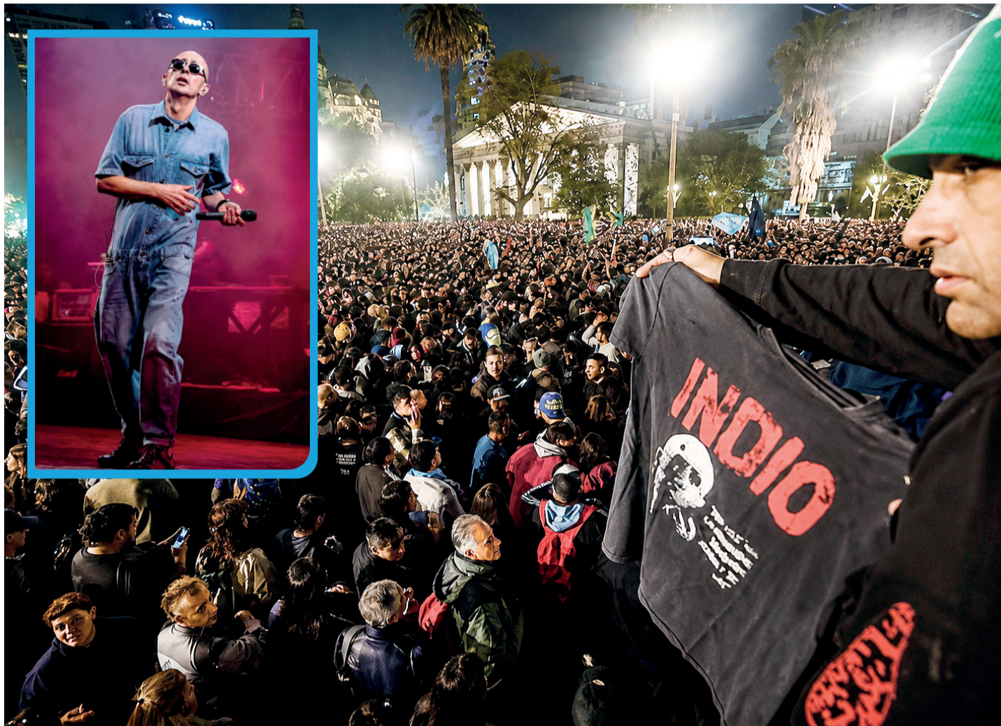
Miles se lanzan a las calles y las plazas en todo el país para despedir al Indio.