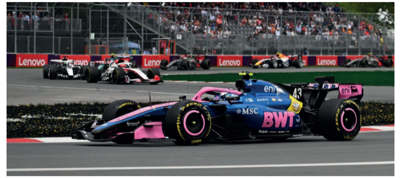
Carrera. Franco afronta otro fin de semana intenso.

Buscará sostener el buen momento de Alpine en uno de los circuitos más exigentes.