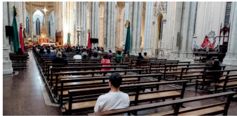
Descenso. Bajó el número de feligreses.

El informe del Observatorio de las Creencias en Argentina de la UBA muestra una caída de la identificación con el catolicismo en los últimos años.