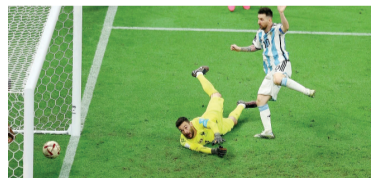
Último gol mundialista de Leo.

La situación que más preocupa es la de Gonzalo Montiel. El lateral derecho sufrió un desgarramiento de grado 2 en el cuádriceps y todavía no existen certezas sobre su presencia en el arranque de la competencia. Ante ese panorama, Scaloni comenzó a evaluar variantes y uno de los nombres que apareció en escena