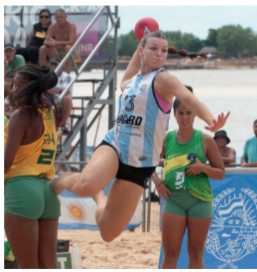
Kamikaze. Hora de la verdad.

Será la quinta participación mundialista para el beach handba-