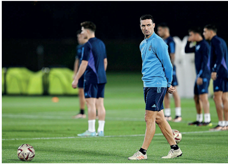
Atento. El DT monitorea las cargas de trabajo.

Mbappé, en tanto, aparece como la mayor amenaza a futuro. Con apenas dos Mundiales disputados, el delantero francés ya suma 12 goles. Cuatro los convirtió en Rusia 2018 y otros ocho en Qatar 2022, donde fue el máximo artillero del torneo y firmó un inolvidable triplete en la final frente a Argentina.