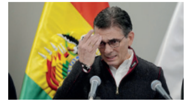
Proponen adelantar un referéndum revocatorio.

Bolivia: crece la presión sobre Rodrigo Paz