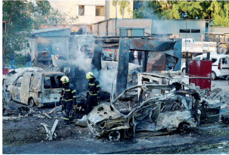
Dnipró. Fue la ciudad más castigada: se registraron 16 muertos y 42 heridos.

Uno de los episodios más graves ocurrió en el distrito de Podil, donde un edificio de viviendas sufrió un colapso parcial. Según denunció el alcalde Vitali Klitschko, el inmueble fue alcanzado mediante una táctica conocida como "doble golpe", que consiste en lanzar un segundo proyec-