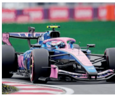
Franco busca consolidarse.

Mónaco es un trazado único por sus características: calles estrechas, pocos espacios de sobrepaso y una clasificación que suele ser determinante. En ese