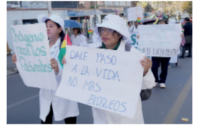
El conflicto comenzó el 1 de mayo pasado.

Bolivia inició ayer el segundo mes de bloqueos con casi un centenar de puntos cerrados en vías públicas y sin señales de diálogo entre manifestantes y el Gobierno, en un contexto de desabastecimiento, escasez de combustibles y alza de precios, según lo consignan los medios locales.