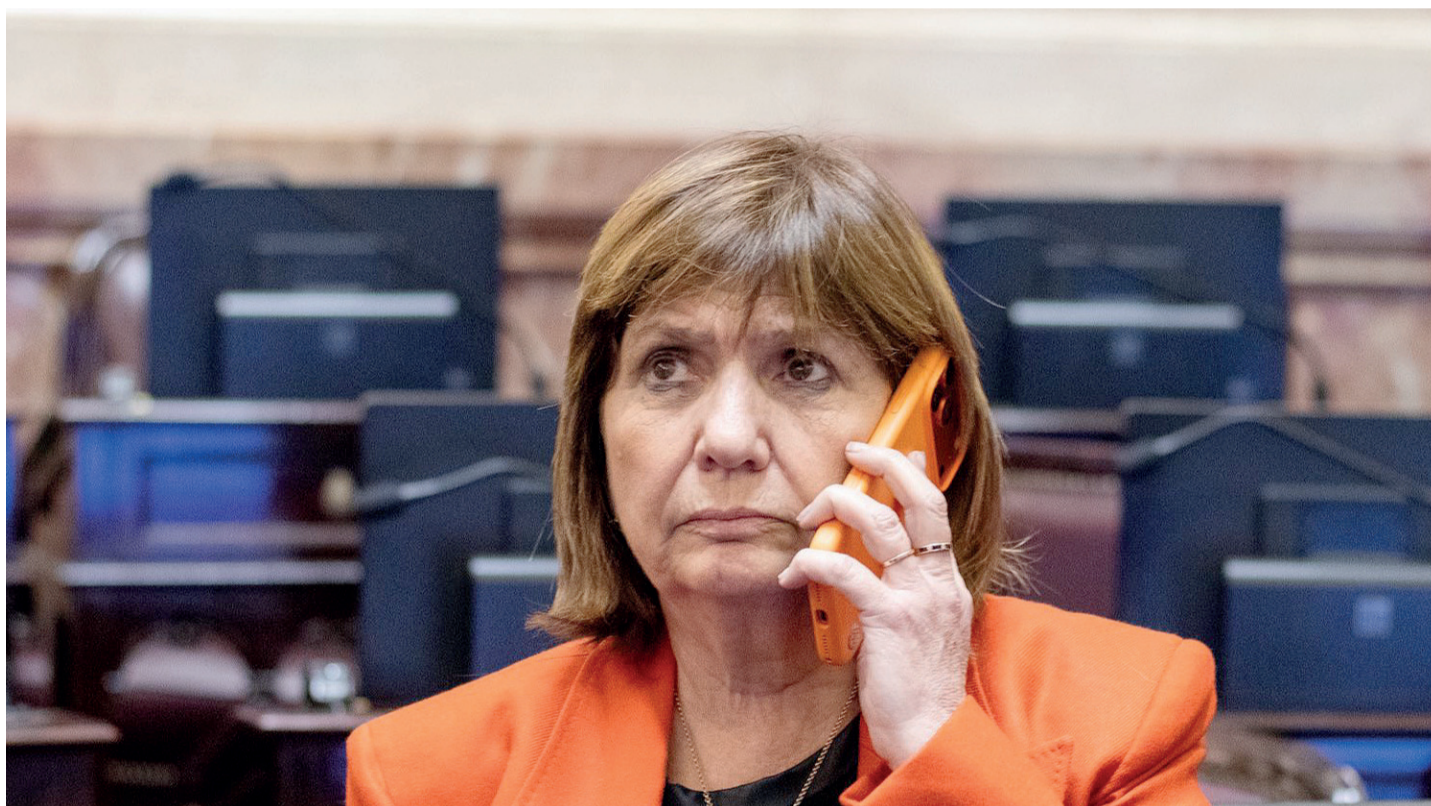
La senadora comunicó personalmente su postura al presidente Javier Milei y ratificó su respaldo al rumbo del Gobierno.

sos fiscales aumentaron 35,6% interanual y registraron una mejora real del 1,7 por ciento. El repunte estuvo vinculado a mayores utilidades empresarias, cambios normativos y vencimientos clave del tributo. Página 2