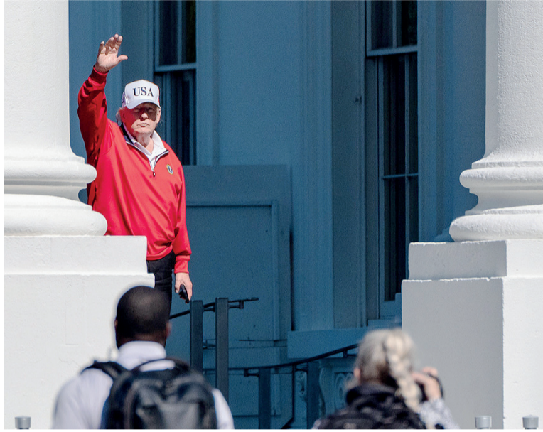
Tensión. Las declaraciones del líder republicano se produjeron mientras Israel intensificaba las operaciones militares.

Según funcionarios israelíes consultados por Reuters, el gobierno de Netanyahu aguardaba incluso una aprobación final de Trump para avanzar sobre esa