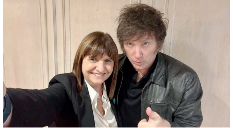
Aliados. El presidente junto a la senadora y exministra Bullrich.

Pese a marcar diferencias, Bullrich buscó evitar una confrontación directa con la Casa Rosada. "Soy parte de este proyecto y apoyo con convicción la transforma-