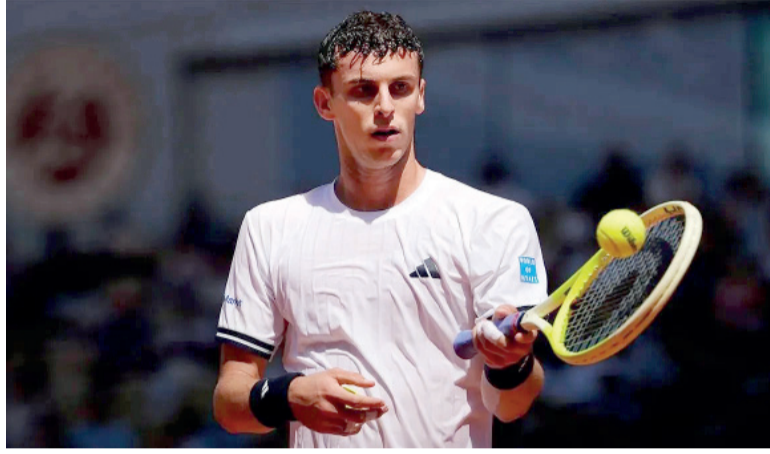
Desilusión. Ya no quedan argentinos en el torneo.

El menor de los hermanos Cerúndolo había irrumpido como