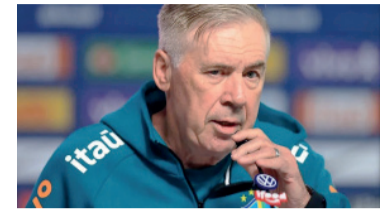
El DT en la conferencia de prensa.

A días de la Copa del Mundo y antes del amistoso frente a Panamá en el Maracanã, Carlo Ancelotti dejó definiciones importantes sobre el presente de la Selección brasileña. El entrenador confirmó que Neymar continúa con la recuperación de la molestia física que lo marginó de los últimos compromisos, aunque se mostró optimista respecto de su evolución y aseguró que espera contar con el delantero para los primeros encuentros.