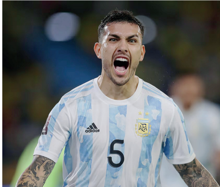
Preocupación. Se confirmó un desgarro en el isquiotibial derecho.

vo dolor de cabeza para Scaloni en la antesala de la Copa del Mundo. Paredes es considerado una pieza central dentro de la estructura del Seleccionado, tanto por su capacidad para organizar el juego como por su experiencia en competencias internacionales. Habitualmente titular, también se convirtió en una alternativa de confianza cuando le toca ingresar desde el banco.