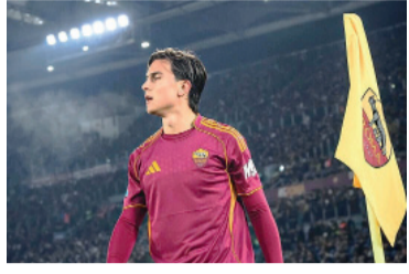
Paulo permanecerá en Europa.

Paulo Dybala continuará su carrera en la Roma y quedó descartada, al menos en el corto plazo, cualquier posibilidad de verlo con la camiseta de Boca Juniors. El delantero cordobés acordó la renovación de su contrato por dos temporadas más y seguirá siendo una de las principales figuras del conjunto italiano.