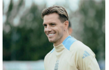
¿Giovani recala en Núñez?

River Plate inició con intensidad el mercado de pases y, tras cerrar la llegada de Nicolás Otamendi, mantiene varias gestiones abiertas por futbolistas con pasado o presente en la Selección argentina. Entre ellos aparece Giovani Lo Celso, uno de los grandes objetivos de Eduardo Coudet para reforzar el plantel.