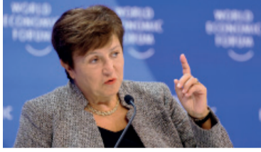
Kristalina Georgieva, titular del FMI.

El FMI advirtió al Gobierno por la corrupción y la falta de transparencia