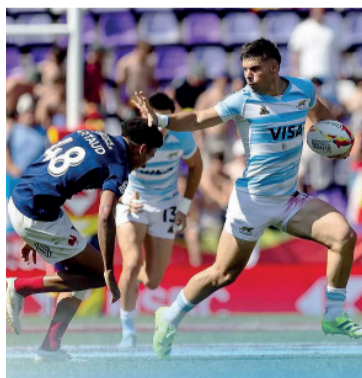
Hand off. Resistir y ganar.

tará a Australia, completando un cuadro de semifinalistas de jerarquía en el Seven de Valladolid, uno de los torneos más competitivos del Circuito SVNS World Championship.