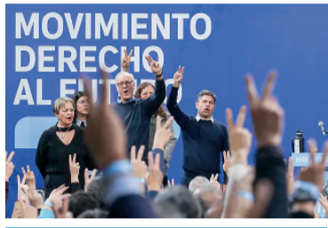
Kicillof en plena instalación.

Kicillof blanqueó al tucumano Yadlin como aliado