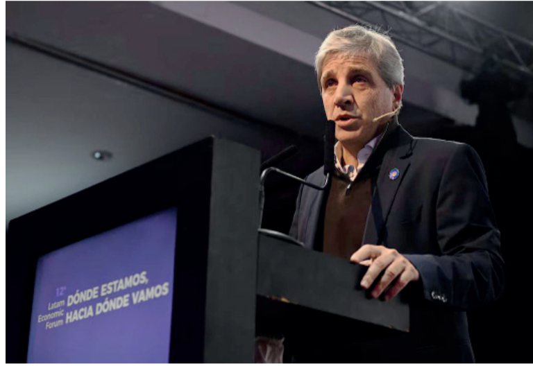
Exposición. El ministro de Economía, Luis Caputo.

Los datos aportados por Caputo: la Canasta Básica Alimentaria (CBA) fue de 1,1% la más baja desde agosto del año pasado; récord de exportaciones en abril; récord en la agroindustria en el primer cuatrimestre; las exportaciones industriales en abril