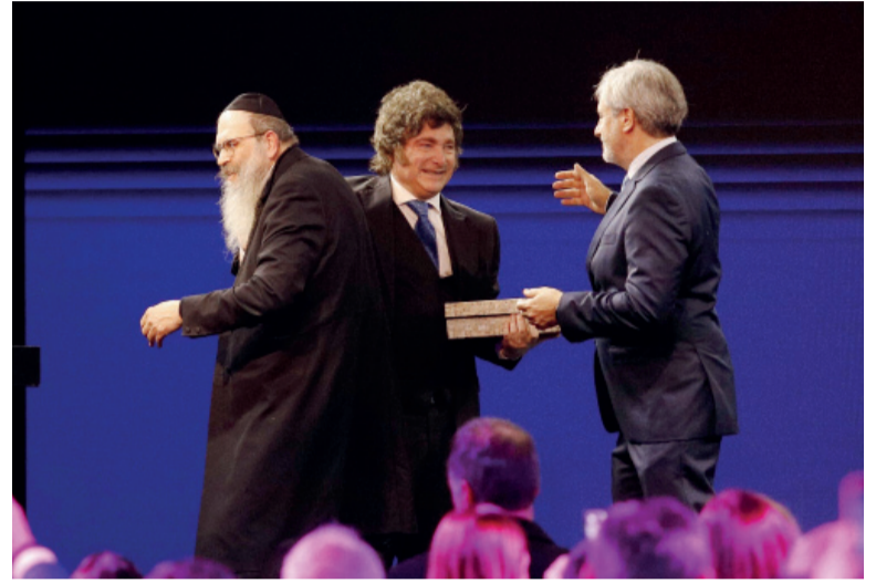
En el foro. Javier Milei, en el encuentro organizado por el asesor financiero Darío Epstein.

Al desarrollar su crítica a cómo cree que los medios muestran a su administración, Milei recurrió a la performance legislativa del oficialismo: "El supuesto