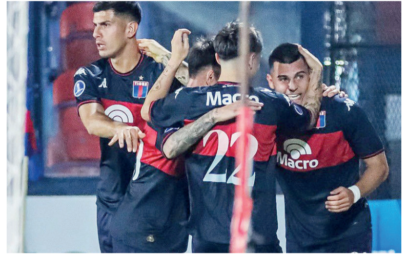
Festejo. Tigre hizo los deberes y después esperó el resultado y finalmente se dio todo lo que necesitaba.

El conjunto de Victoria se impuso 2 a 0 a Alianza Atlético, de Perú, y con el empate de América de Cali y Macará terminó segundo en el Grupo A y jugará los 16avos de final.