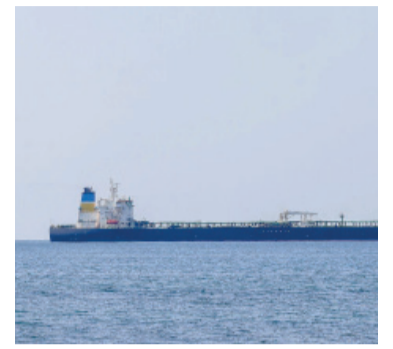
El ataque se produjo cerca de las costas turcas.

Tres petroleros que navegan bajo bandera de conveniencia y aparentemente están implicados en el transporte de crudo ruso fueron atacados ayer con drones en el mar Negro, cerca de las costas turcas.