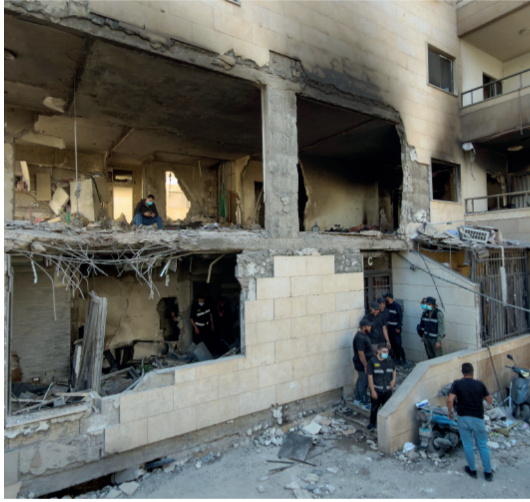
Reclamo. Teherán también pide que se detengan las operaciones militares israelíes en el Líbano contra Hezbollah.

Desde Teherán, en cambio, sostuvieron que se trató de una represalia frente a nuevos bombardeos estadounidenses registrados horas antes sobre objetivos iraníes. Funcionarios norteamericanos informaron que sus fuerzas derribaron cuatro drones de ataque unidireccionales en las inmediaciones del estrecho de Ormuz y destruyeron una estación de control terrestre en Bandar Abbas que, según denunciaron, estaba a punto de lanzar un quinto aparato