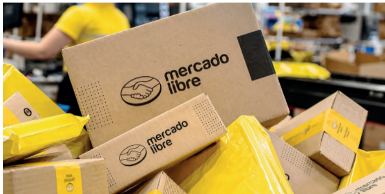
Complicado. Mercado Libre en la mira.

Entre los puntos observados aparecen la indeterminación en el