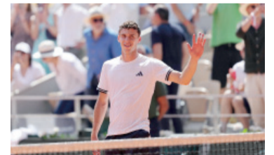
Histórico. El festejo del menor de los Cerúndolo.

El estreno de la Albiceleste en el Grupo J será el martes 16 de junio frente a Argelia en Kansas. A partir de ese momento comenzará el desafío de intentar algo que sólo dos selecciones lograron en la historia moderna: defender exitosamente un título mundial.