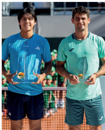
Trofeo. Gran torneo de "La Nave".

En los games decisivos, Tien fue más sólido: sostuvo su servicio sin ceder puntos y luego consiguió el quiebre definitivo para quedarse con el título, el segundo de su carrera a los 20 años.