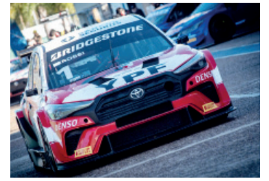
El Toyota Corolla Cross fue un misil.

Matías Rossi volvió a ser el protagonista del TC2000 en el autódromo de Salta al quedarse con la pole position de la cuarta fecha de la temporada 2026. El piloto del Toyota Corolla Cross marcó un registro de 1:30.864 en su último intento y alcanzó así su tercera clasificación del año en apenas cuatro competencias disputadas.