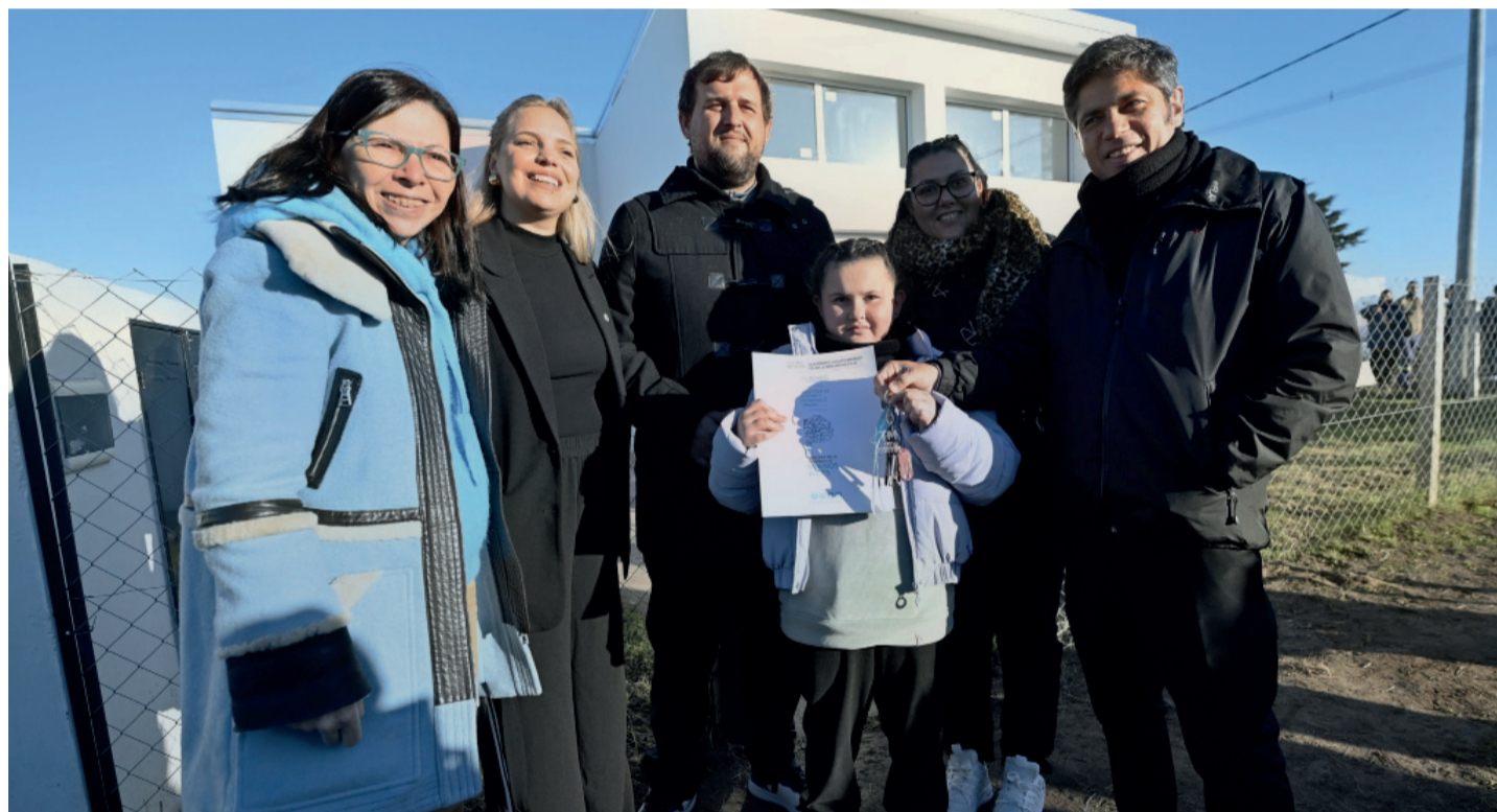
El gobernador de la Provincia encabezó el acto de entrega de 48 viviendas para familias del municipio de Tornquist.

en el último informe técnico del organismo que además pidió avanzar con una nueva legislación para modernizar el funcionamiento del organismo estadístico y señaló limitaciones en otros indicadores económicos. Página 3