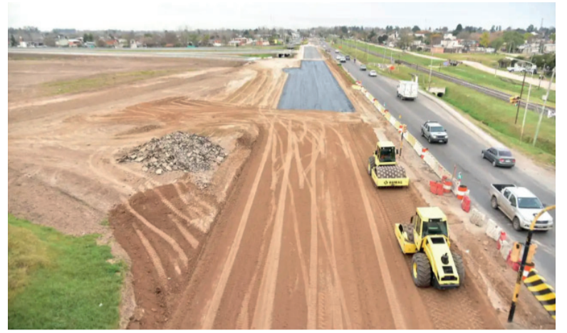
Obras paradas. Por el deterioro de las cuentas de la Provincia.

Esta situación afecta de lleno a la estrategia de suplantación de la presencia del Estado nacional que viene llevando adelante Kicillof. No