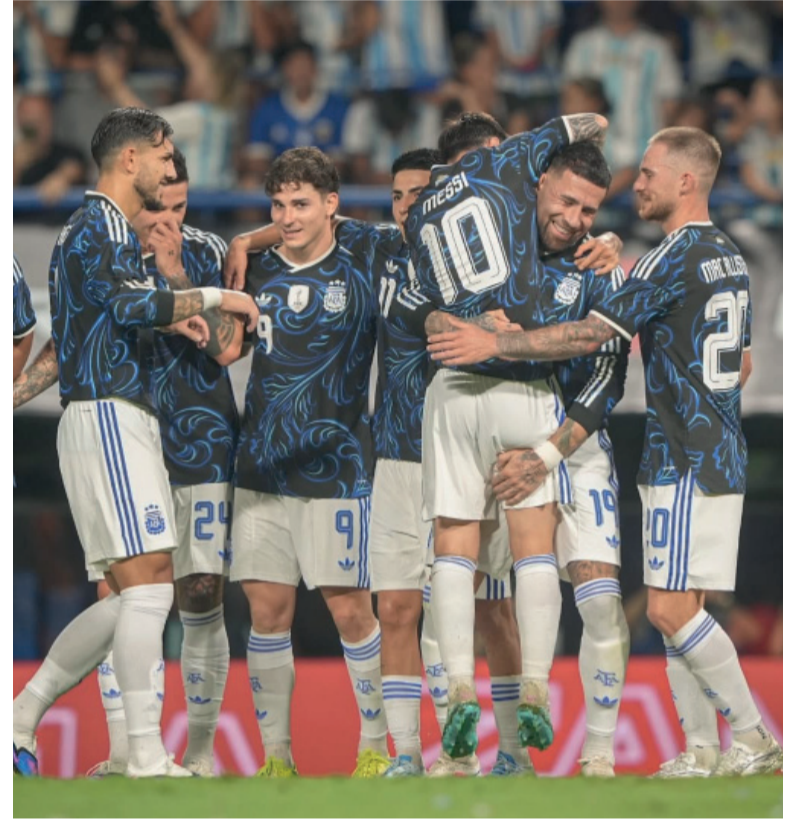
Caudillos. Argentina consolidó una estructura de mando alrededor de Messi.

Detrás de esa construcción también existe una estructura. El éxito argentino no surgió únicamente de una camada brillante, sino de un proyecto que logró darle continuidad al trabajo de selecciones juveniles. Desde la consolidación del cuerpo técnico encabezado por Scaloni, Pablo Aimar, Roberto Ayala y Walter Samuel, la Selección empezó a funcionar como un sistema integrado. Las juveniles dejaron de ser compartimentos aislados para