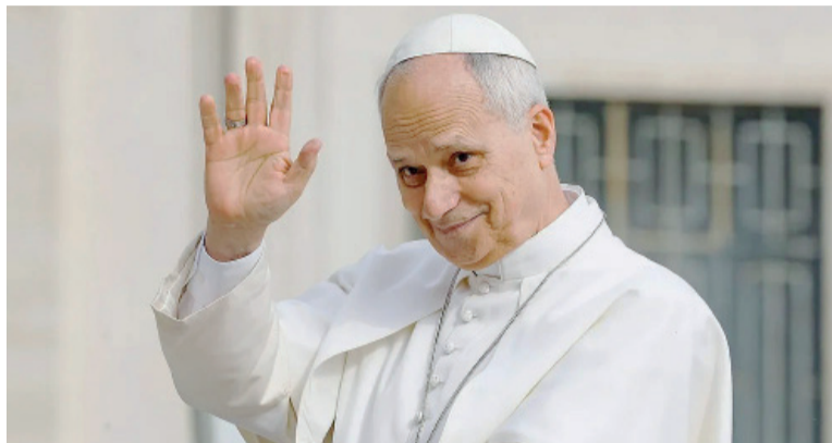
¿Viene? Su Santidad, el papa León XIV.

La gestión diplomática de Argentina para concretar el viaje se remontaría al menos a febrero de este año, cuando Quirno viajó a Roma y entregó en mano al Papa una carta