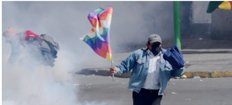
Cerca del estallido. Se agrava la situación en Bolivia.

Miles de manifestantes convergieron desde distintos puntos hacia el centro político de La Paz, colapsando avenidas y parali-