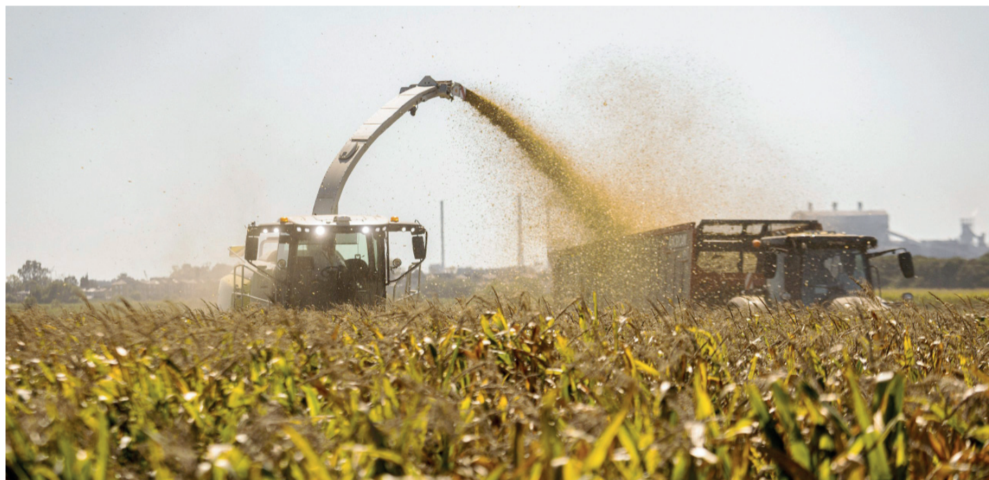
■ Datos oficiales. Los 6 cultivos principales sumaron 163 millones de toneladas.

de prensa que también reducirán las alícuotas para maíz, sorgo y girasol. Una de las primeras confirmaciones del equipo económico fue que la soja tendrá una reducción mensual de 0,25 puntos porcentuales a partir de 2027. Página 3