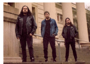
Los miembros de Inacayal.

En medio de la difícil situación que atraviesa el país y con la llegada del frío más intenso del invierno, un grupo de bandas de música realizarán una jornada solidaria en La Plata para juntar ropa y alimentos para la gente más necesitada.