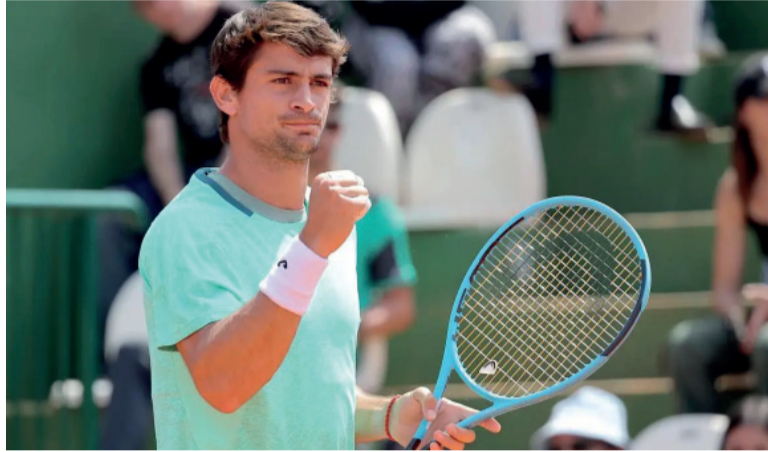
Carácter. El bonaerense y una nueva demostración de personalidad.

En la segunda manga, el bonaerense mostró su versión más sólida. Aunque el inicio volvió a ofrecer intercambios de quiebres, Navone fue asentándose progresivamente y