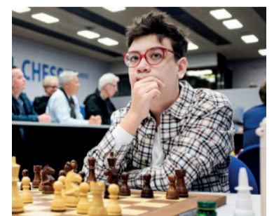
Élite. Oro, entre gigantes.

Además, el torneo repartirá una bolsa total de 500 mil euros en premios. La modalidad de rápidas se jugará entre el 17 y el 19 de junio bajo un sistema de 12 rondas, mientras que el Blitz se