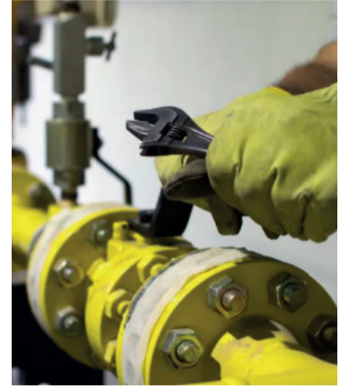
Ola polar. Provoca falta de gas en empresas.

El Gobierno dejó de lado la planificación energética y entregó al sector privado la decisión