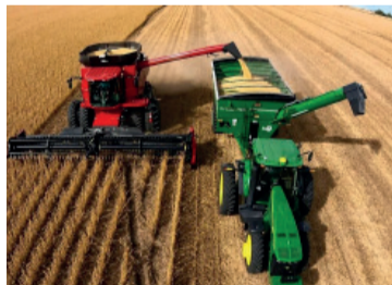
Cosecha récord. Los 6 cultivos principales sumaron 163 millones de toneladas

27,9 millones de toneladas, alcanzando también un máximo de la serie histórica.