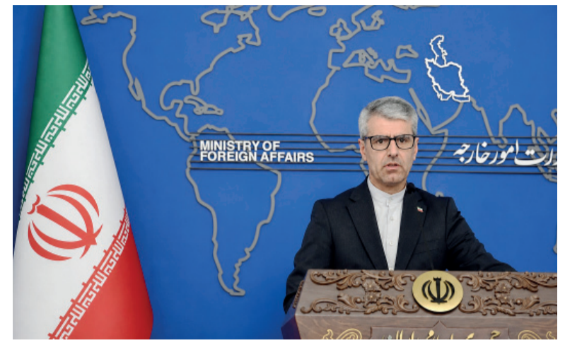
Esmail Baghaei. Portavoz del Ministerio de Relaciones Exteriores iraní.

Baghaei enfatizó que las conversaciones tienen como objetivo poner fin a las hostilidades en todos los frentes, incluido el Líbano.