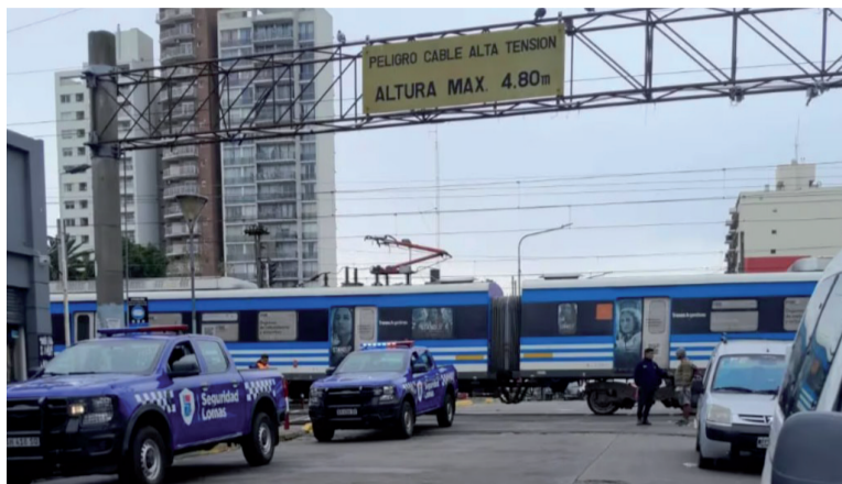
Tragedia. La formación del Roca circulaba en dirección hacia Alejandro Korn.

En un primer momento, fuentes oficiales vinculadas con el caso indicaron que la principal sospecha era que las víctimas "se habrían arrojado" a las vías con intención de quitarse la vida. No obstante, personas que se encontraban en la plataforma plantearon otra posibilidad: que la pareja haya intentado cruzar cuando se aproximaba la formación y no logró alcanzar el andén a tiempo.