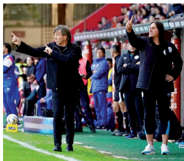
Orgullo. El "Ruso" va por todo.

El DT también valoró el esfuerzo del plantel y le dedicó el triunfo a los hinchas cordobeses.