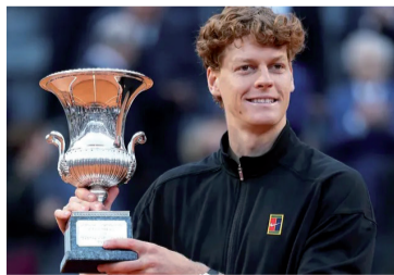
Top. Sinner posa con el trofeo.

Horacio Zeballos y Marcel Granollers cayeron ante los locales Simone Bolelli y Andrea Vavassori por 7-6 (8), 6-7 (3) y 10-3, tras dos horas y 17 minutos, en