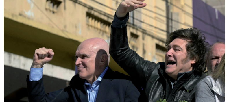
Aliados. El presidente Milei junto al por entonces candidato Espert.

Según Milei, a Espert “durante semanas lo ENSUCIARON, lo DIFAMARON y lo condenaron públicamente sin pruebas, sólo porque defendía las ideas de la libertad y les resultaba incómodo. Pero finalmente, la Justicia de Estados Unidos aceptó la declaración de INOCENCIA respecto del narcotráfico del que se acusaba a la persona utilizada para golpear y ensuciar a José Luis Espert. Ahora pregunto: ¿A quién carajo se le ocurre que, a los 58 años y después de toda una vida exitosa de trabajo en