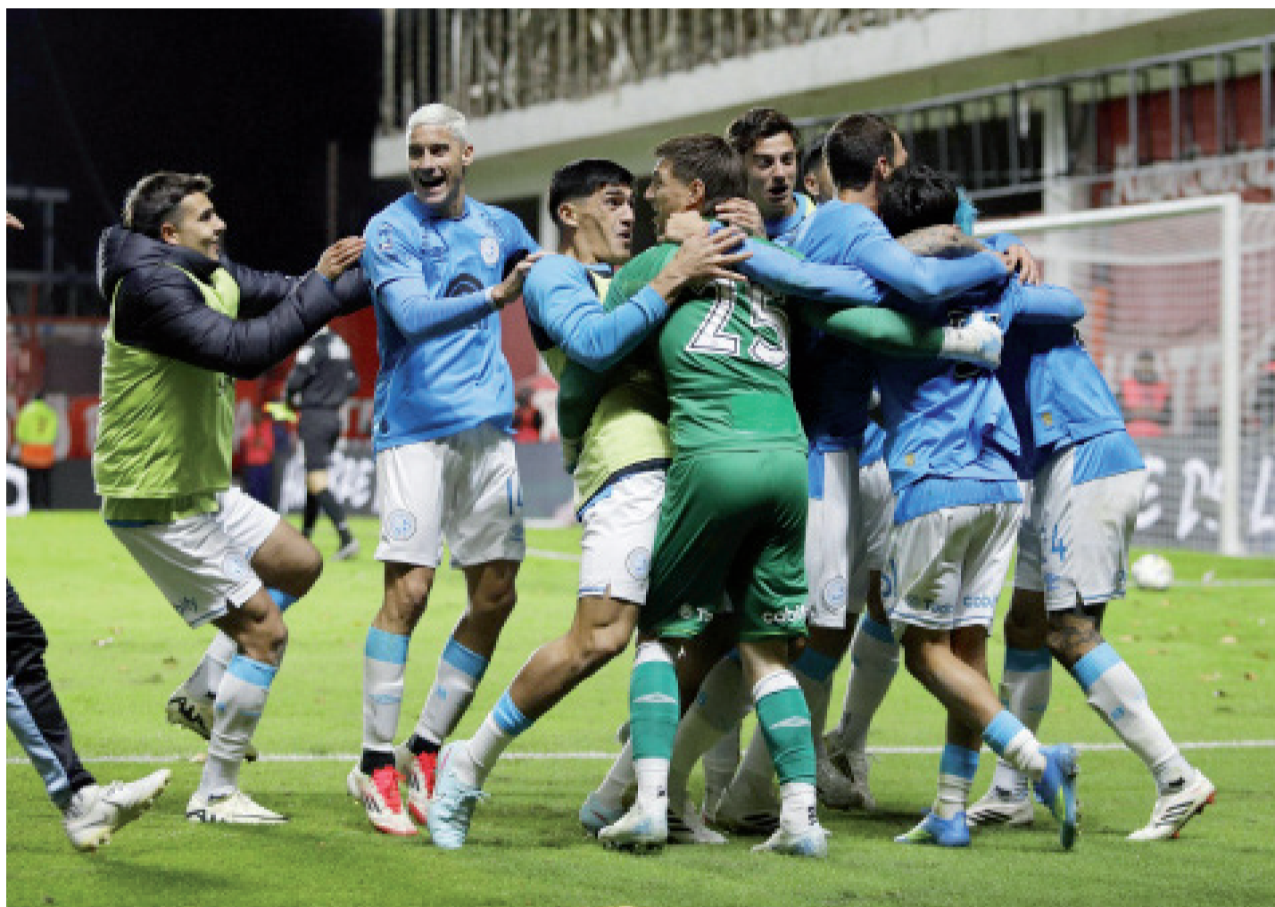
■ Belgrano, finalista, jugará el domingo con River en la mismísima Córdoba.

tó declararse culpable de conspiración para lavar activos y fraude por vía electrónica. Un juez deberá definir si convalida el entendimiento que le permitió dejar atrás el cargo por narcotráfico, lo que motivó la publicación de Milei. Página 3