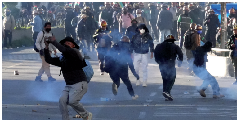
Cara a cara. Enfrentamientos entre manifestantes y fuerzas de seguridad.

Gabriel Espinoza, desmintió versiones difundidas en redes sociales sobre supuestas muertes durante los operativos de despeje, a las que calificó de “absolutamente falsas”. Además, aseguró que las fuerzas del orden no utilizaron armas letales. Por su parte, la administración encabezada por el presidente Rodrigo Paz confirmó la apertura de canales de diálogo con sindicatos, mineros y organizaciones sociales, en un intento por descomprimir el escenario de conflicto.