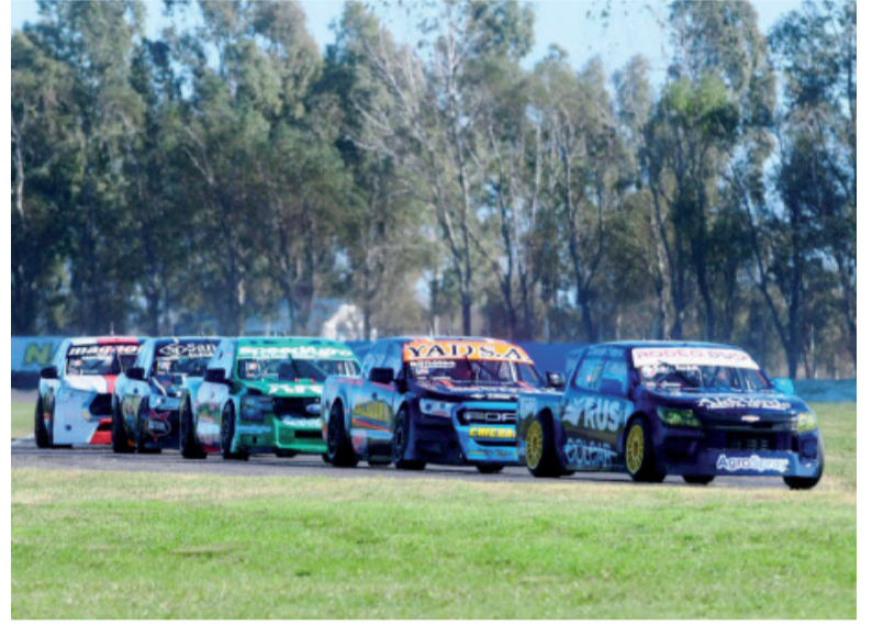
Implacable. La Chevrolet S10 soportó el asedio en el Mouras.

El ganador también destacó la importancia de la largada para sostener el liderazgo y admitió que en las últimas vueltas debió defenderse como pudo ante el avance de sus perseguidores. De hecho, durante la competencia