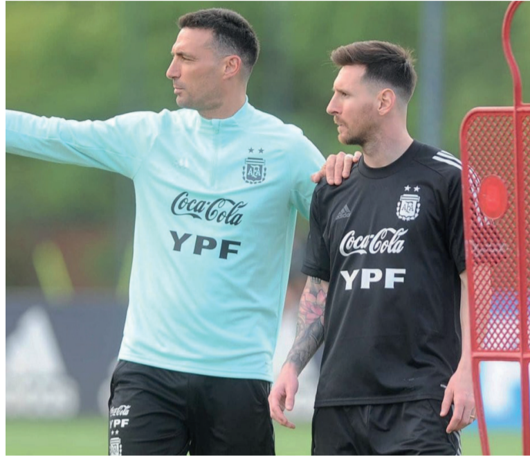
Sociedad. Scaloni pidió disfrutar de la vigencia de Messi.