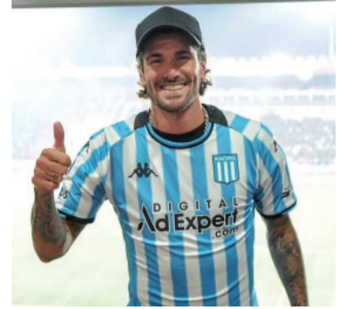
Fuerte identificación con el club.

Rodrigo De Paul, mediocampista de la Selección argentina e Inter Miami, volvió a referirse a su deseo de regresar a Racing Club de Avellaneda: "Me encantaría volver, pero no quiero ser preso de mis palabras", expresó en un streaming, donde remarcó que el fútbol y la vida cambian constantemente.