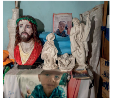
Inspección. Se realizará el martes en la casa de la abuela de Loan

"El proceso sigue avanzando hacia esa fecha prevista", agregó la fuente ante la consulta de NA, mientras que precisó: "Las audiencias serán presenciales, se está preparando