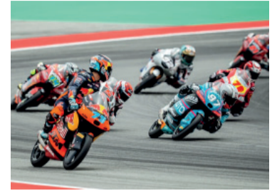
Ambos van por la primera fila.

Los pilotos argentinos tuvieron un auspicioso comienzo en el Gran Premio de Cataluña de Moto3, correspondiente a la sexta fecha del campeonato mundial de motociclismo, tras completar una sólida actuación en las prácticas disputadas en el circuito de Montmeló.