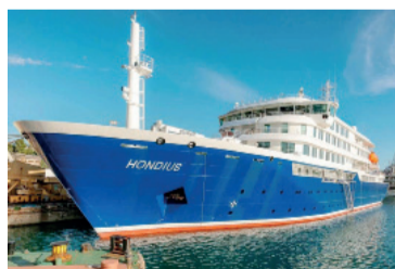
En cuarentena. El crucero MV Hondius llegará a Rotterdam el próximo lunes.

Los ministros indicaron que algunos tripulantes realizarán cuarentena domiciliaria a su llegada, mientras que aquellos que no puedan regresar de inmediato a sus países de origen serán alojados en instalaciones de cuarentena designadas.