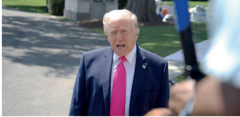
Estratega. Trump declaró que no asumió "ningún compromiso en ningún sentido".

Trump también dio a entender que aún no se había tomado una decisión definitiva sobre las futuras ventas de armas de Estados Unidos a Taiwán. "Tomaré una determinación", dijo Trump cuando se le preguntó al respecto.