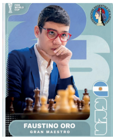
Figurita. Oro, en la cima.

La actuación en Italia volvió a demostrar el alto nivel competitivo del país en las competencias offshore y consolidó al Katara como uno de los grandes protagonistas del yachting internacional.