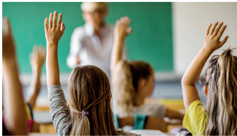
Trabajo duro. Alumnos y un docente en el aula.

Al mismo tiempo, la normativa habilita a los docentes recalificados a continuar desempeñándose en cargos que no impliquen sobreexigencia vocal, siempre que una evaluación médica determine que mantienen aptitud residual para esas funciones.