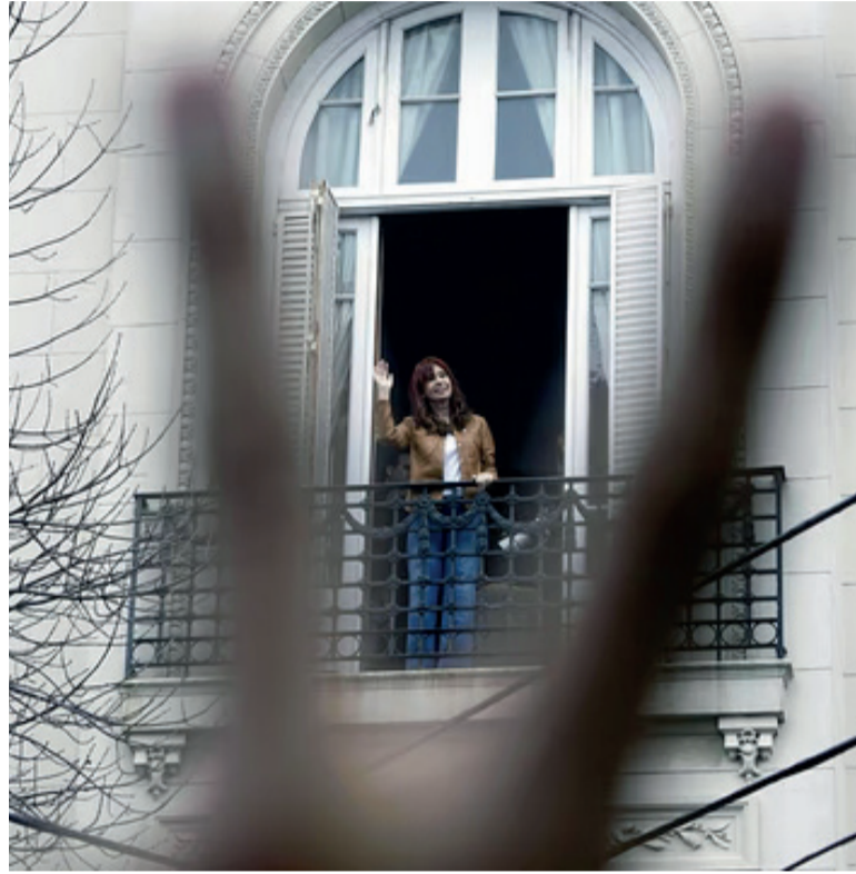
Avance de la Justicia. Fiscales piden incautación del departamento de Cristina

Según el dictamen fiscal, ese inmueble -al igual que otros activos- estaría vinculado al entramado patrimonial investigado en la causa y, por lo tanto, debería ser incorporado al deco-