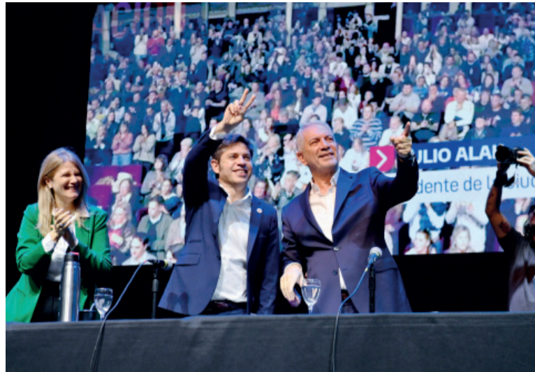
El encuentro. El gobernador Kicillof en el teatro Coliseo Podestá.

El episodio tenso se produjo cuando un pequeño grupo de jóvenes que estaba apostado en el sector trasero de las plateas comenzó a exigirle a los gritos al Gobernador "Cristina libre, Cristina libre. Axel decilo", en una acción coordinada con otro que desple-