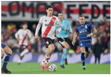
River vs. Central, el sábado 19.30.

Se confirmaron los horarios para las semifinales