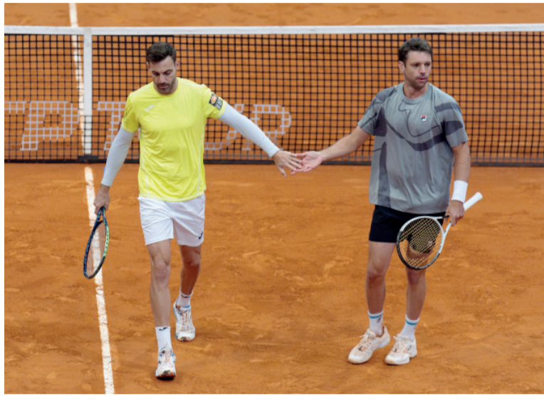
Por la final. La dupla argentina-española enfrentará a la pareja compuesta por el estadounidense Austin Krajicek y el croata Nikola Mektic.

Zeballos y Granollers buscarán hoy meterse en la final por el título. Sus rivales serán el estadounidense Austin Krajicek y