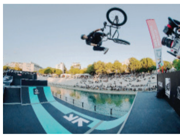
Destacado. A sus 31 años, el campeón olímpico continúa compitiendo al máximo nivel.

A sus 31 años, el campeón olímpico continúa compitiendo al máximo nivel en un circuito dominado mayormente por atletas de entre 22 y 25 años, apoyado en su experien-