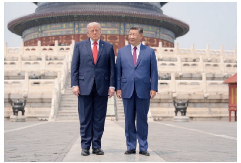
Taiwán. Fue el tema que volvió a exponer las tensiones estratégicas entre las dos potencias.

Sin embargo, mientras Washington priorizó la cuestión iraní y los avances económicos, la versión difundida por Beijing mostró que el tema más sensible para China continúa siendo Taiwán. Según la agencia estatal Xinhua, Xi advirtió a Trump que