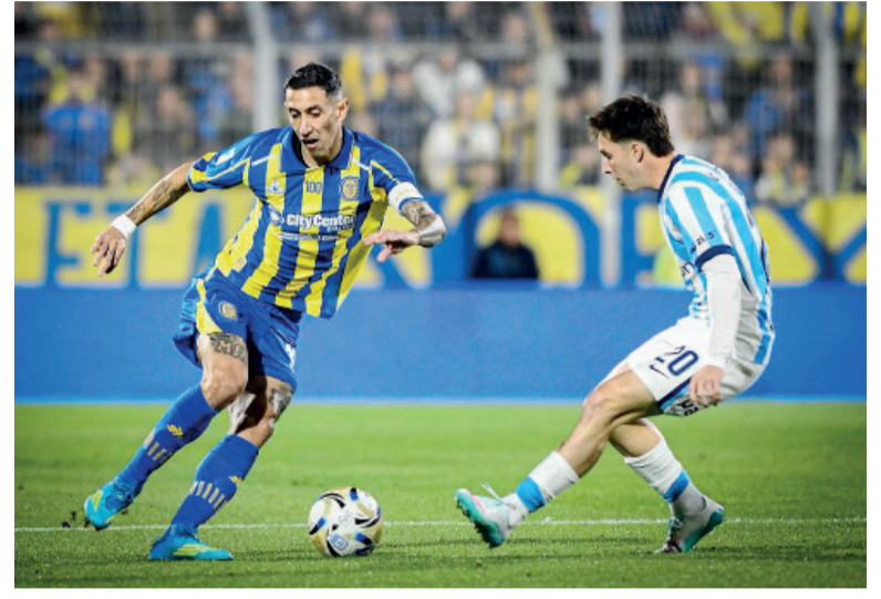
"Caretas". El campeón del mundo con la Selección defendió a Central y respondió por los cuestionamientos en su contra.

"Creo que todos lo vieron, terminar como se terminó nos deja, no solamente tristes, sino con el