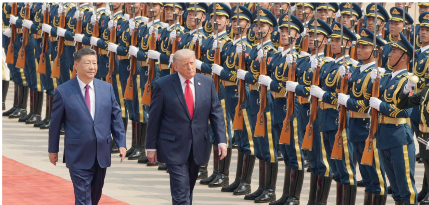
El presidente de Estados Unidos participa en una ceremonia de bienvenida junto a su par chino en el Gran Salón del Pueblo.

pese a los "intentos golpistas de la política (y sus socios del círculo rojo y el shock externo)". Una familia tipo de cuatro integrantes necesitó en abril de 2026 ingresos por $ 1.469.768 para no ser considerada pobre en el Gran Buenos Aires. Página 3