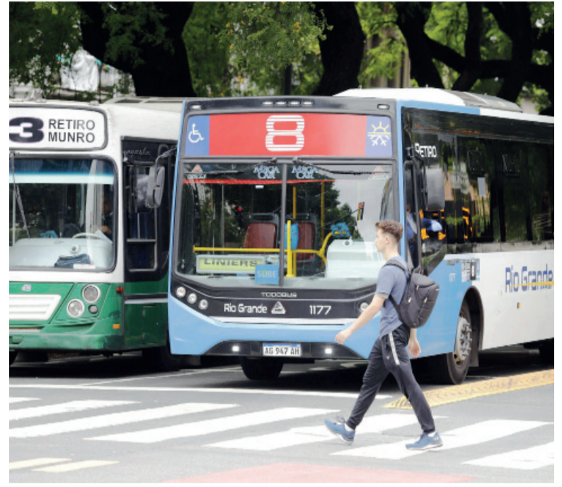
Para arriba. “Transporte” encabezó los incrementos con una variación de 4,4%.

“La variación en el nivel general fue la menor desde noviembre del año pasado, en tanto la inflación núcleo fue la menor desde octubre”, celebró en redes sociales el ministro de Economía, Luis Caputo. “Si se excluye 2020, fuertemente influido por el incremento tran-