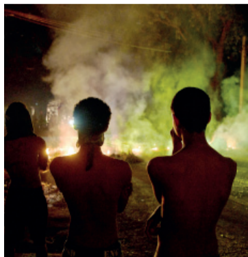
Cortes. Alcanzan hasta 24 horas consecutivas.

gando a las 24 horas corridas en La Habana. En muchos barrios los vecinos golpearon sus cacerolas al caer la tarde de ayer.