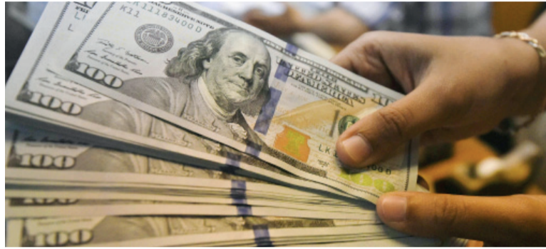
Racha. El 2 de enero fue el único día en que el BCRA no intervino en el MLC.

El Banco Central (BCRA) sumó otra jornada con compras de divisas en el Mercado Libre de Cambios (MLC) y superó el 80% de la meta pactada para todo el año. La entidad financiera lleva 86 ruedas consecutivas en las que se hace de dólares; el 2 de enero fue el único