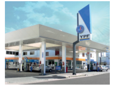
La empresa no trasladará el aumento del petróleo.

YPF aumenta 1% los combustibles y extiende el "buffer de precios"