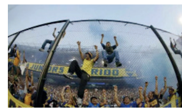
Una hinchada en la cancha.

Los deudores alimentarios no entran a la cancha