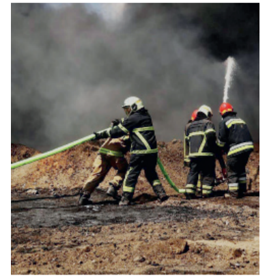
En Kiev, las explosiones se escucharon durante gran parte del día.

El gobierno de Rusia lanzó ayer uno de los ataques más intensos desde el inicio de la guerra contra Ucrania al desplegar al menos 800 drones sobre unas 20 regiones del país, en una ofensiva que dejó al menos seis muertos y decenas de heridos, según informó el presidente ucraniano, Volodimir Zelensky.