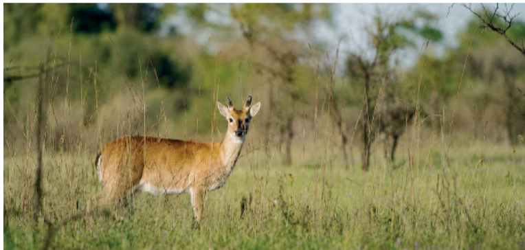
Bajo protección. Un ejemplar de venado de las pampas.