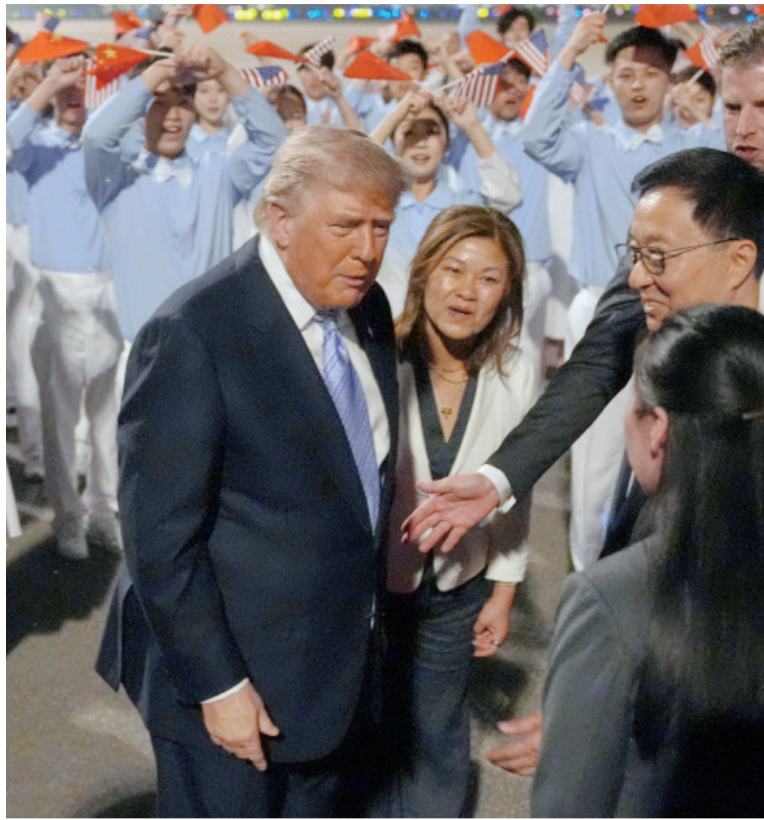
Llegada. El líder republicano arribó a Beijing y fue recibido a pie de pista por el vicepresidente chino, Han Zheng y otros funcionarios.

La llegada de Trump también dominó las redes sociales chinas,