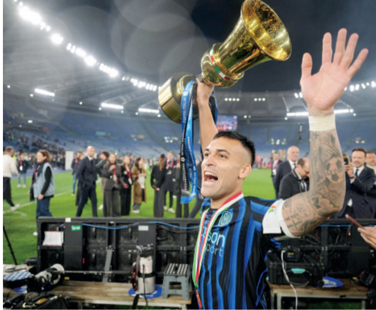
Afilado. Así llega el bonaerense al Mundial tras el doblete de títulos en Italia.

Con la ventaja a su favor, Inter manejó el desarrollo del encuentro y amplió la diferencia a los 35 minutos. Tras un grave error defensivo de Lazio, el neerlandés Denzel Dumfries recuperó la pelota dentro del área y asistió a Lau-