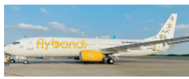
Un avión de Flybondi.

Flybondi donará los pasajes para los chicos estafados