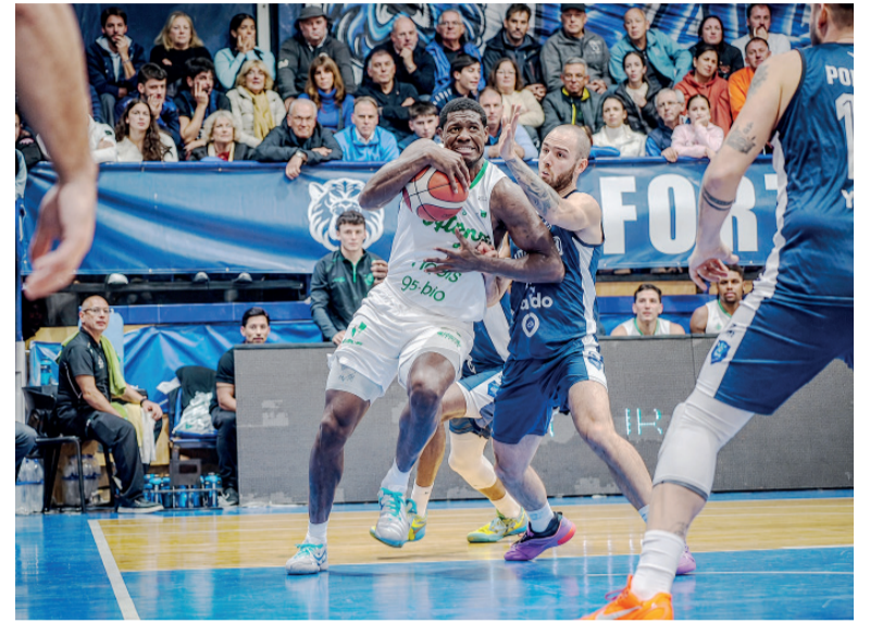
Dura derrota. El conjunto cordobés cayó ante Argentino de Junín.

El equipo más ganador de la Liga Nacional no pudo sostenerse en la máxima categoría y jugará en La Liga Argentina.