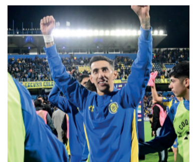
Felicidad. Di María celebra con su público una gran victoria.