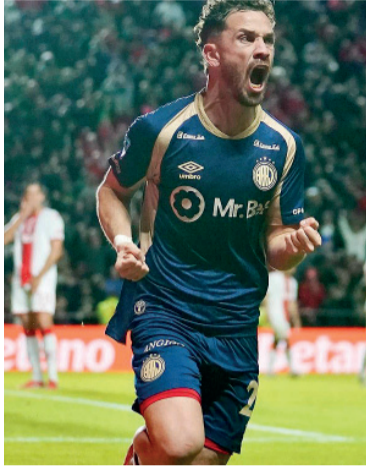
Letal. Molina no defraudó.

En el complemento creció el dominio del Bicho. Lescano volvió a inquietar con un remate cruzado