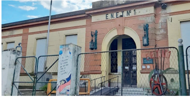
Estafados. La ENET n° 1 de la ciudad de Bragado.

Los chicos habían juntado con rifas y tortas el dinero para ir a El Bolsón. La fecha se fue postergando, hasta que la escuela reconoció que la plata no estaba. Ahora se realiza una campaña solidaria para que el viaje pueda hacerse.