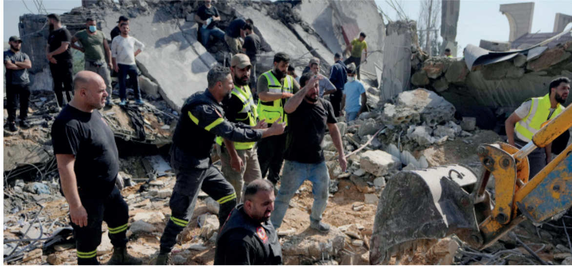
Tensión. Crece mientras el alto el fuego vence en una semana y continúan los bombardeos.

“Llamamos a optar por negociaciones indirectas donde las cartas fuertes están en manos del