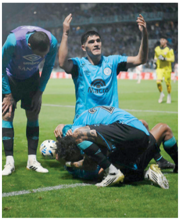
Locura. Festeja Alberdi.

Aunque Belgrano perdió algo de intensidad sobre el cierre del primer tiempo, nunca renunció