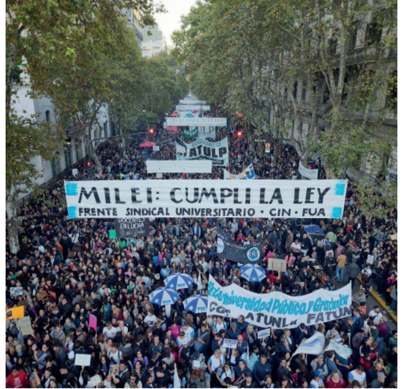
Multitudinaria. El centro porteño fue copado por los manifestantes.