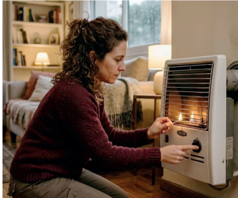
Cimbronazo. El cambio impactará en el aumento de la tarifa de gas de unos 800.000 hogares de unos 80 municipios de la provincia.

Sin embargo, la suerte del despacho dependerá de la voluntad