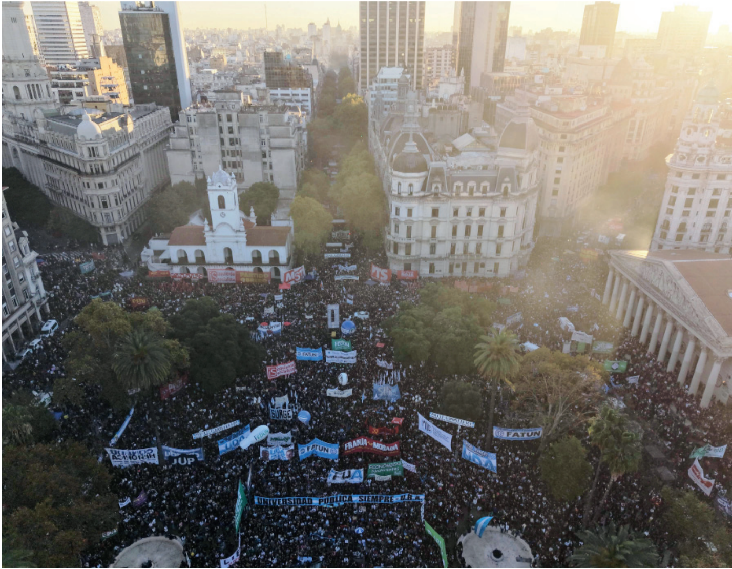
La Plaza de Mayo repleta de manifestantes. Además hubo columnas del peronismo, la izquierda, la UCR y la CGT.