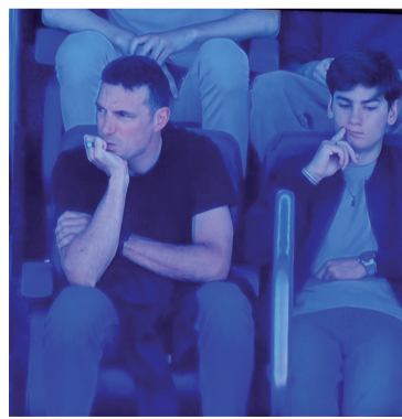
Estadio. Scaloni siguió el partido.

Scaloni, que conoce bien el entorno del club mallorquín -donde fue futbolista y también trabajó en las divisiones inferiores-, sigue de cerca no solo a los jugadores argentinos sino también el contexto competitivo en el que se desempe-