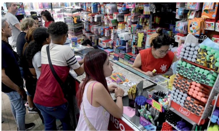
Para abajo. Seis de los siete rubros analizados presentaron resultados negativos.

"Bazar, decoración, textiles de hogar y muebles": sufrió un descenso interanual del 12,3%. El informe atribuye este comportamiento al estancamiento de los ingresos, la competencia externa