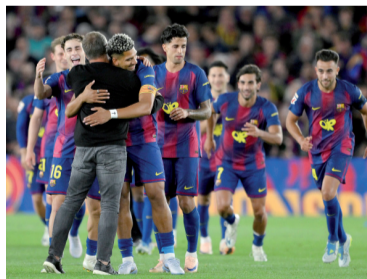
Efusivo festejo para los de Flick.

El segundo llegó a los 18' tras una gran acción colectiva. Dani Olmo improvisó un exquisito taco dentro del área y dejó servido el balón para Ferrán Torres, que definió con categoría para ampliar la ventaja.