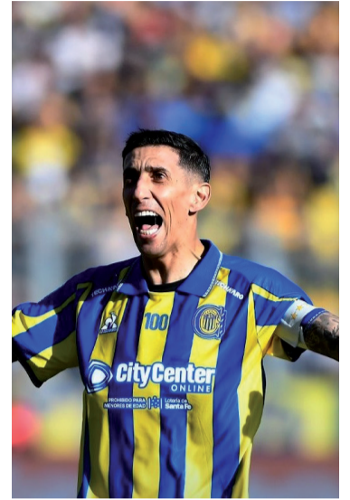
Desahogo. El Canalla, en cuartos.

En el complemento el desarrollo fue más equilibrado y friccioso. A ambos equipos les costó