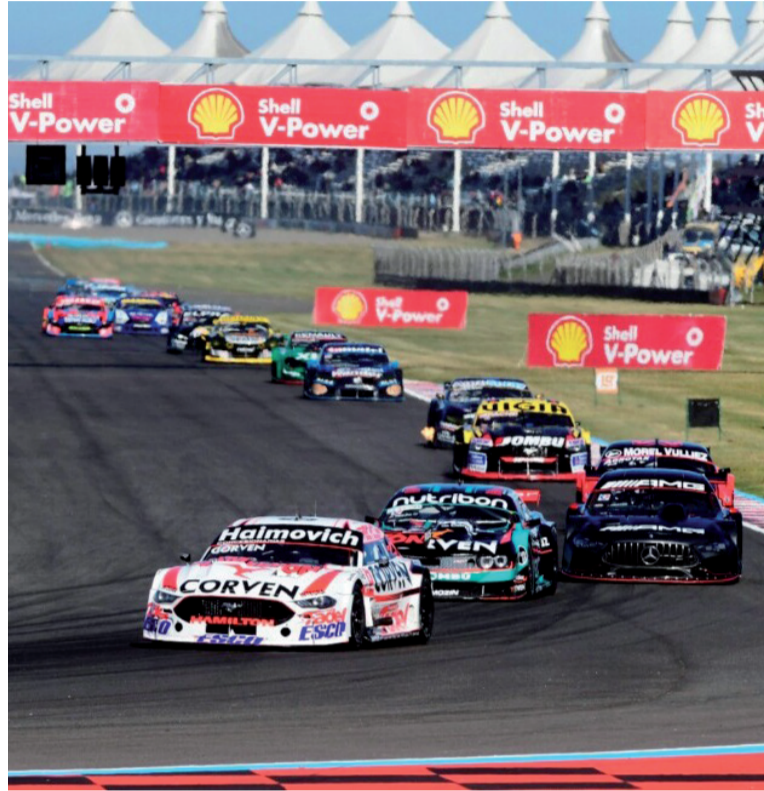
Superioridad. El Ford Mustang se adueñó de la quinta fecha.

cial para el piloto de Paraná, que no había logrado finalizar entre los diez primeros en ninguna de las cuatro finales anteriores de la temporada. Su última victoria en el TC databa del 1 de junio de 2025 en el autódromo Oscar Cabalén de Córdoba, por lo que este resultado representa un desahogo deportivo significativo.