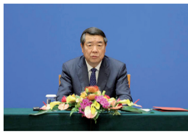
El vice primer ministro chino, He Lifeng.

China-EE.UU.: consultas económicas y comerciales