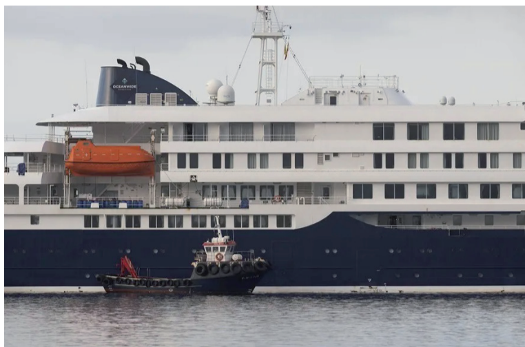
En destino. El crucero neerlandés MV Hondius, en Tenerife.

Pese a la gravedad del episodio, las autoridades sanitarias llamaron a la calma y recordaron que el hantavirus presenta una capacidad de transmisión mucho menor que la del Covid-19, por lo que el riesgo para la población general es considerado bajo. - DIB -