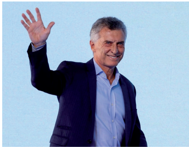
Cancha marcada. Documento del PRO, el partido que lidera Mauricio Macri.

Por eso, en este contexto, "el próximo paso es claro: que el cam-