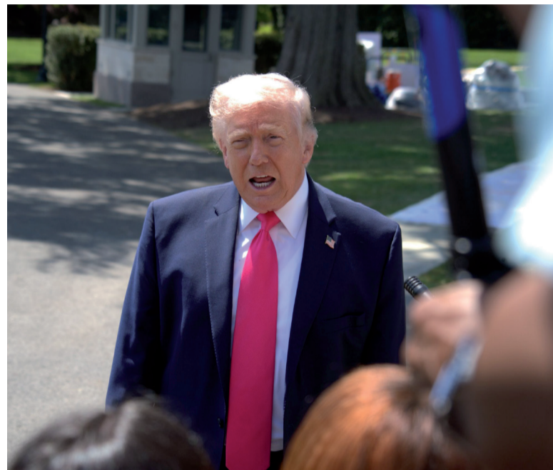
Negativa. Donald Trump y otro desencuentro con Teherán.

Desde Teherán, el presidente Masoud Pezeshkian reafirmó que “Irán nunca se rendirá ante el enemigo”, aunque aclaró que