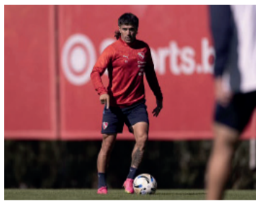
Vuelve. Malcorra, un viejo conocido.

El ganador de esta serie avanzará a los cuartos de final, donde deberá enfrentarse al vencedor del duelo entre Vélez Sarsfield y Gimnasia y Esgrima La Plata en la continuidad de los playoffs del Torneo Apertura.