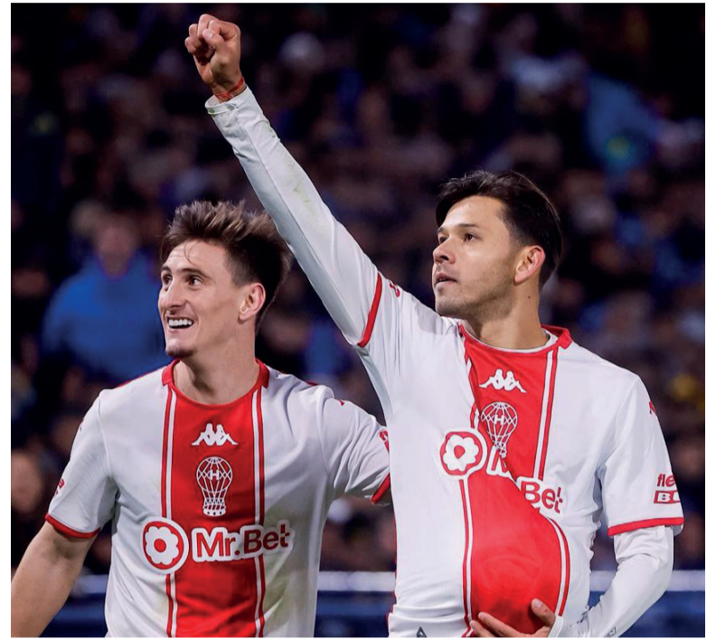
Adentro. Romero marcó por duplicado para el Globo.

En el complemento bajó el ritmo. Boca volvió a inquietar recién a los 15', con un centro de Aranda que Giménez estrelló en el palo.