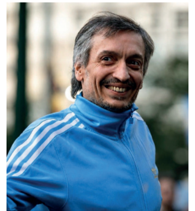
Recuperación. El dirigente deberá continuar con "seguimiento y controles ambulatorios".

El diputado dijo que, si bien le hubiera gustado que su madre estuviera acompañándolo, él le sugirió "especialmente que no lo haga", alegando que "ella no merece el show que montarían con su traslado si le concedieran el permiso". - DIB -