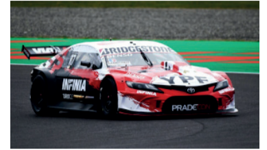
El Toyota Camry dominó la pista.

Matías Rossi consiguió la pole position en la quinta fecha del Turismo Carretera, disputada en el circuito de Termas de Río Hondo, y reafirmó su dominio histórico en las clasificaciones de la categoría más popular del automovilismo argentino.