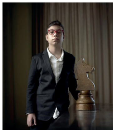
Oro. Historia del ajedrez.

La última partida tendrá además un atractivo especial: enfrentará desde las 4.30 al ruso Ian Nepomniachtchi, ex candidato al