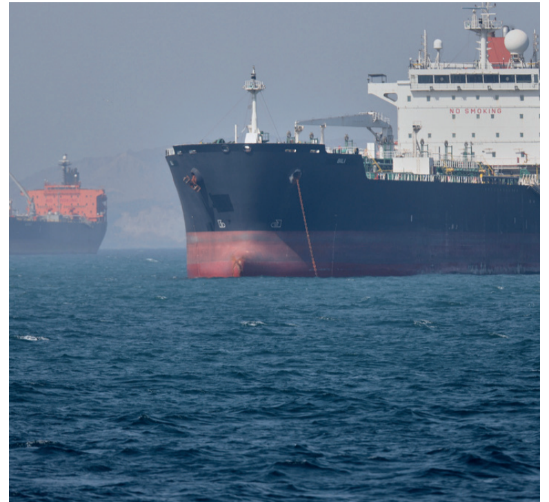
Queja. Teherán denunció una violación del alto el fuego y respondió con una ofensiva contra destructores norteamericanos.

Según la versión oficial, los detenidos integraban una organización asociada a la doctrina