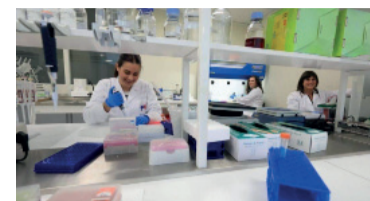
El objetivo es que "nuestros científicos no tengan que irse".

La oposición impulsa un proyecto en la Legislatura bonaerense para un polo de desarrollo de biotecnología, que tiene el objetivo de "convertir a la Provincia de Buenos Aires en el gran motor científico y tecnológico de la Argentina y de América Latina".