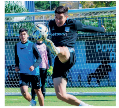
Se jugará con dientes apretados.

Racing Club de Avellaneda enfrenta a Estudiantes de La Plata desde las 17 en el estadio Jorge Luis Hirschi, por los octavos de final del Torneo Apertura. El árbitro del encuentro será Sebastián Martínez, mientras que José Carreras estará a cargo del VAR.