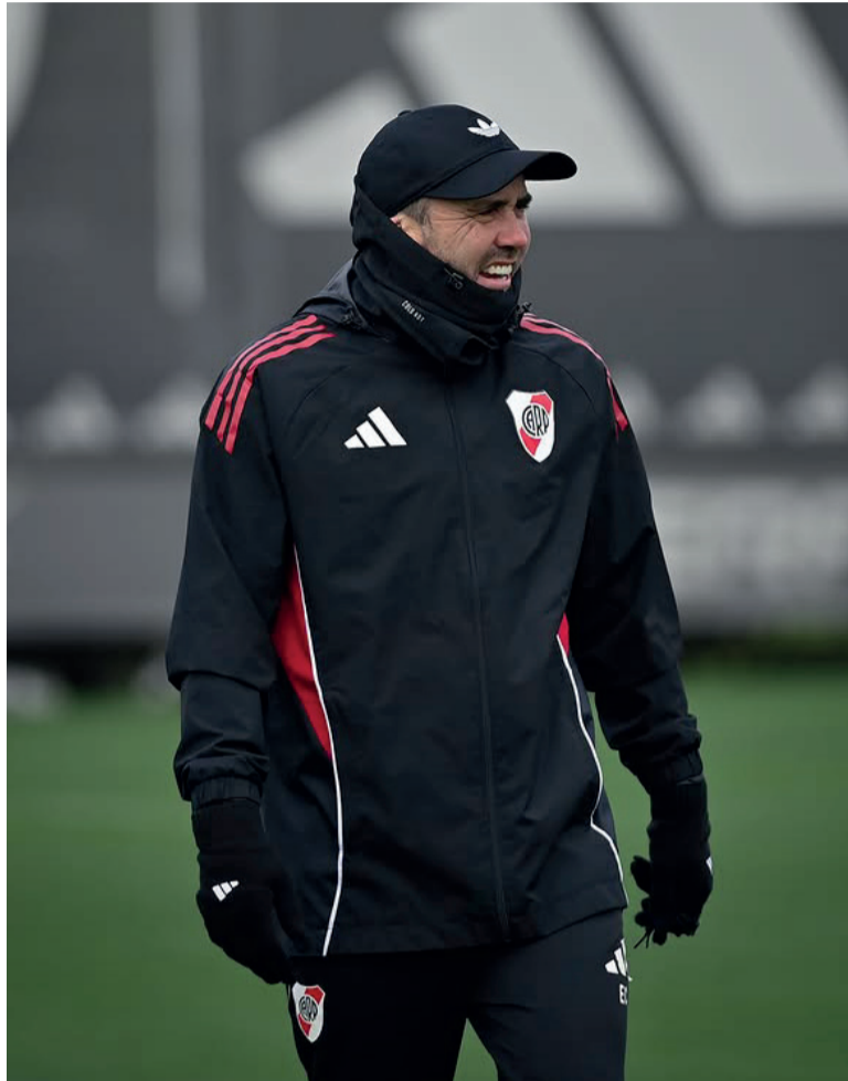
Enfocado. "Chacho" debe convencer desde el juego.

mitieron conservar el séptimo puesto del Grupo A y avanzar a la fase eliminatoria.