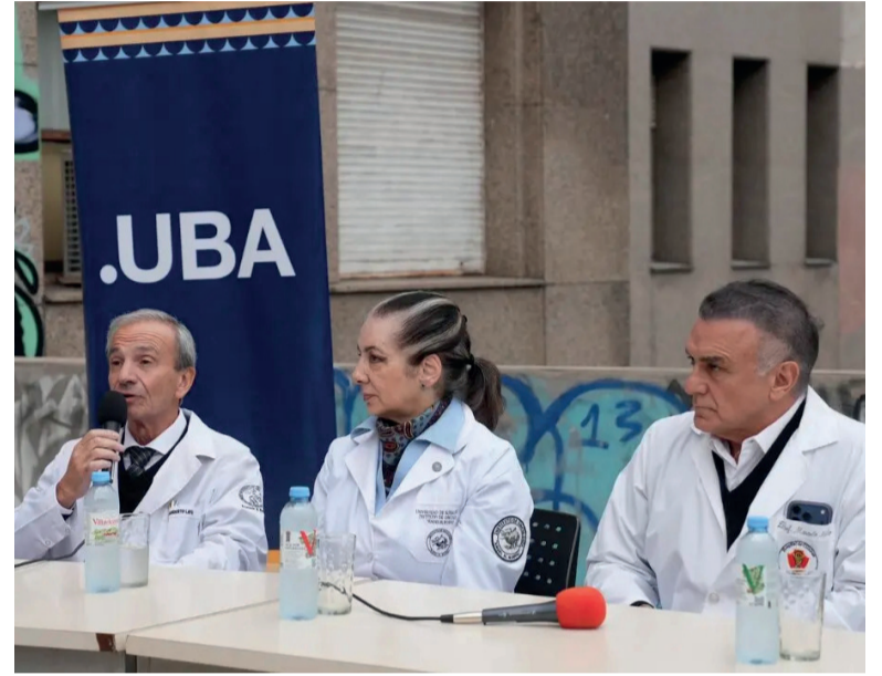
Reclamo. Los directores de los hospitales universitarios denunciaron que en 45 días podrían dejar de funcionar si no se revierte la situación.