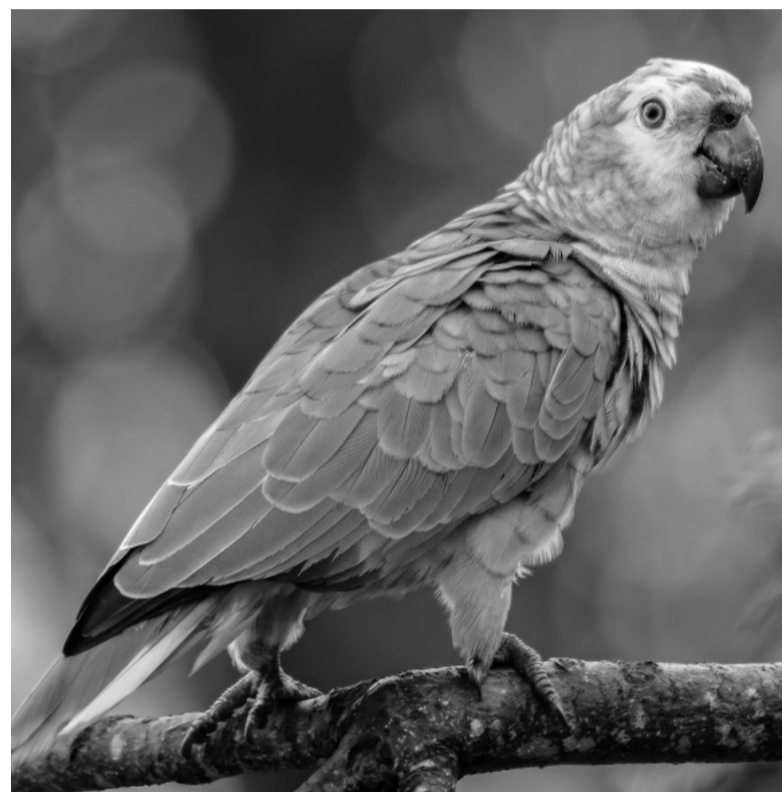
Marcados. La infección está históricamente asociada a loros, cotorras y papagayos.

La principal vía de contagio ocurre por inhalación. Cuando las secreciones respiratorias y los excrementos de aves infectadas se secan, liberan pequeñas partículas contaminadas que quedan suspendidas en el aire. Al ser respiradas por las personas, pueden provocar