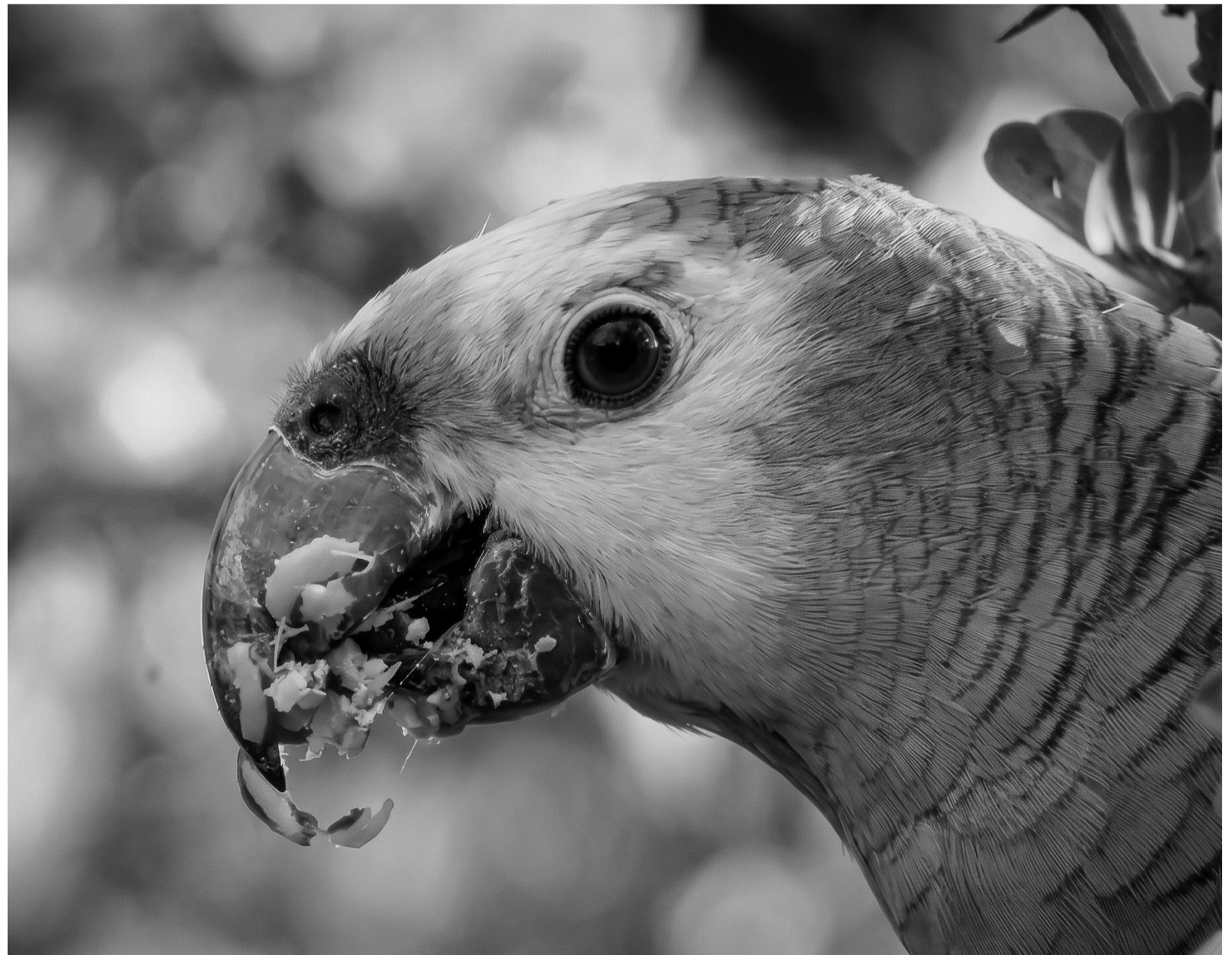
Bajo la lupa. Los loros son los vectores más conocidos de la psitacosis.