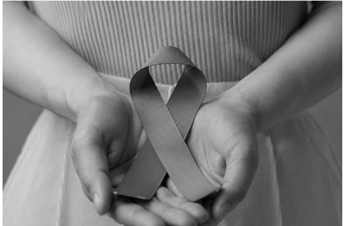
Fecha clave. Cada 8 de mayo se conmemora el Día del Cáncer de Ovario.

De hecho, más de 6 de cada 10 mujeres con cáncer de ovario encontraron dificultades para realizar la primera consulta médica tras la aparición de síntomas. Los principales motivos fueron la desestimación, dificultades para conseguir turno, turnos con mucha demora y dificultades