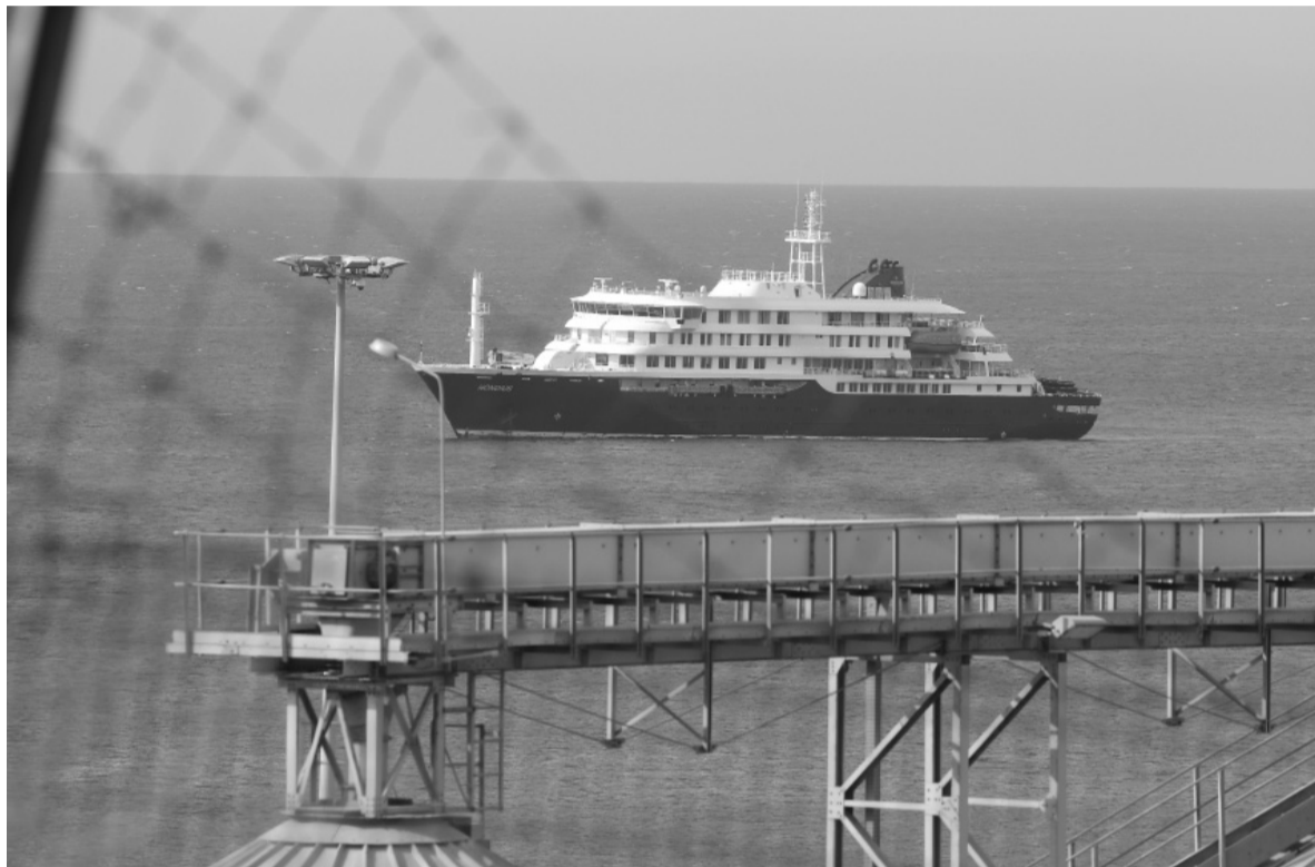
En el ojo del huracán. El crucero MV Hondius salió de Ushuaia el 1° de abril.

La OMS le pidió a Argentina que revea su salida del organismo, y desde Nación hablaron de “decisiones soberanas”.