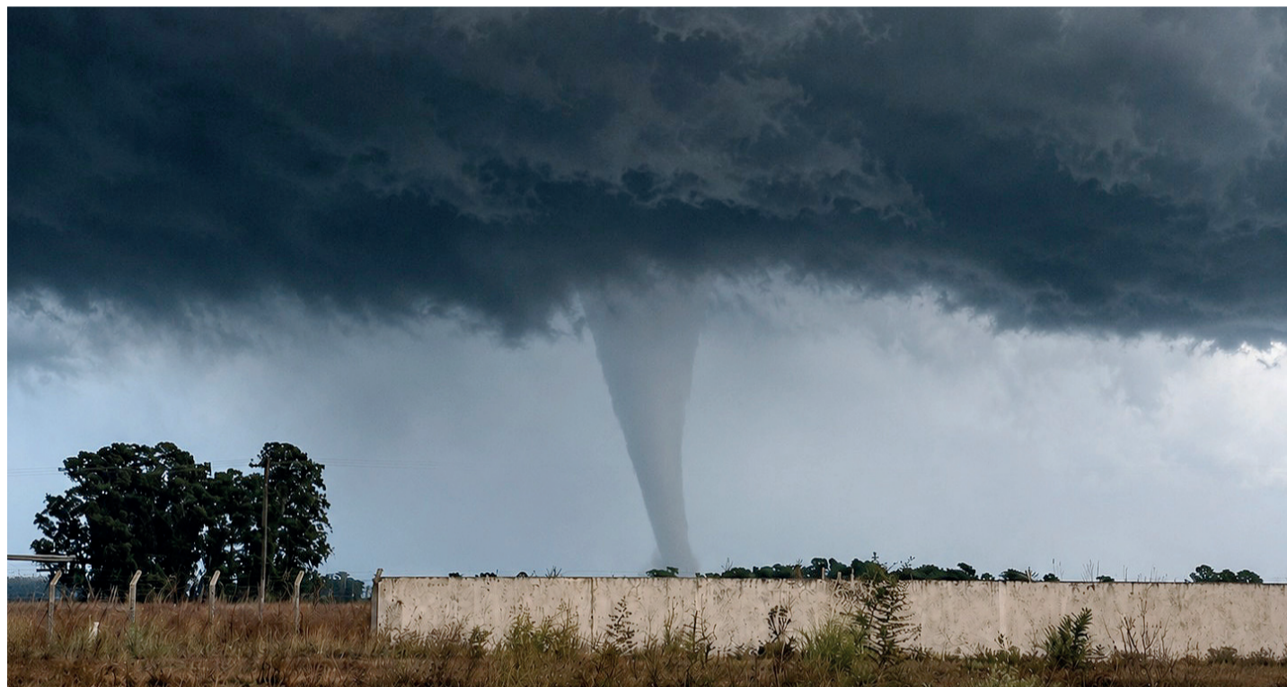
En la localidad de Las Flores un tornado arrasó con una vivienda y cuatro integrantes de una familia debieron ser trasladados al hospital.

legales para habilitar el salto de instancia. La decisión mantiene el trámite ordinario de la causa, que continuará en el fuero Contencioso Administrativo luego de que la Cámara de Trabajo resolviera remitir allí el expediente. Página 3