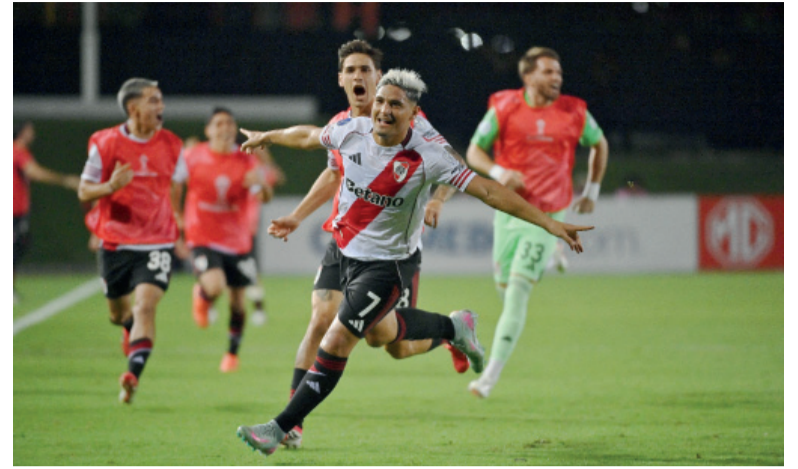
Un paso. El "Millonario" quedó muy cerca de sellar la clasificación.

Antes del descanso, Carabobo sufrió un golpe importante. En