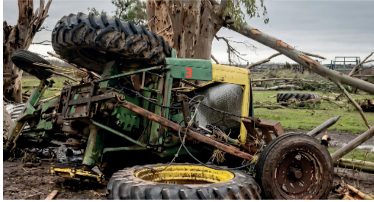
Las Flores. Un tractor destruido tras el paso del tornado.

La tormenta de lluvia y viento también se descargó con fuerza en la Costa Atlántica. En Mar del Plata, de acuerdo con medios locales,