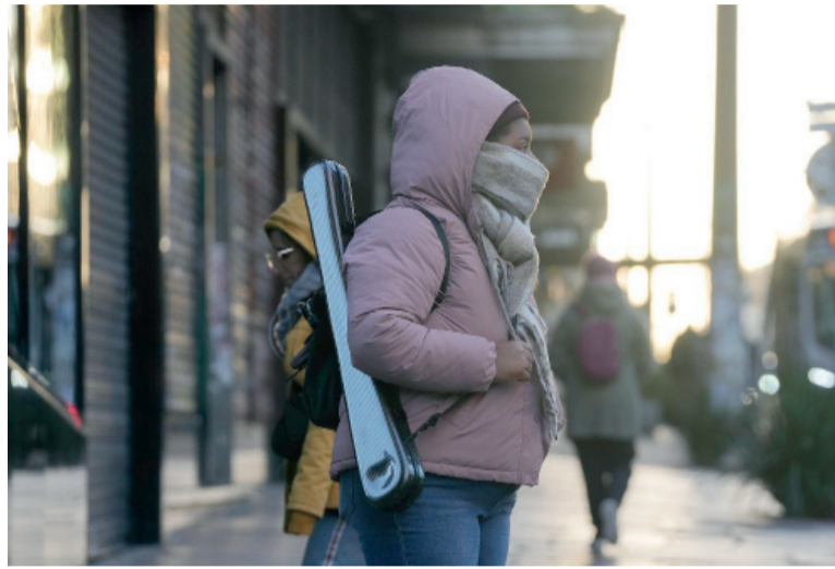
El giro. De aprobarse, impactará en la tarifa de gas en casi toda la provincia.

El proyecto que analizó Agencia DIB propone restringir el alcance geográfico del régimen y volver al esquema original, concentrado en las provincias de la Patagonia (incluía a algunos mu-