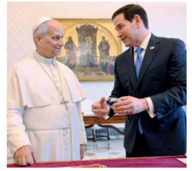
El Papa recibió en el Vaticano al secretario de Estado.

Rubio llevó a León XIV un mensaje de paz