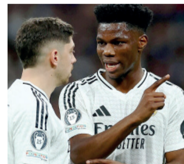
En llamas. El vestuario de la Casa Blanca explotó y el club inició expedientes disciplinarios.

El Real Madrid anunció la apertura de expedientes discipli-