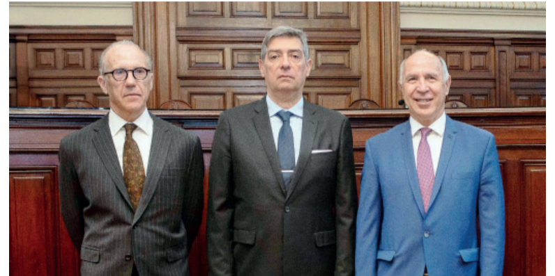
Relativa mala noticia. La Corte falló contra pedido del Gobierno.

En el fallo que se conoció ayer, la Corte sostuvo que a juicio de la Corte "no se observan los requisitos que, con arreglo a lo dispuesto por el artículo 257 bis del Código Procesal Civil y Comercial de la Nación, habilitan la procedencia de la vía cuya apertura se promueve mediante el recurso por salto de instancia". Ante esto, concluyó que "se declara inadmisibile el recurso interpuesto" por el Gobier-