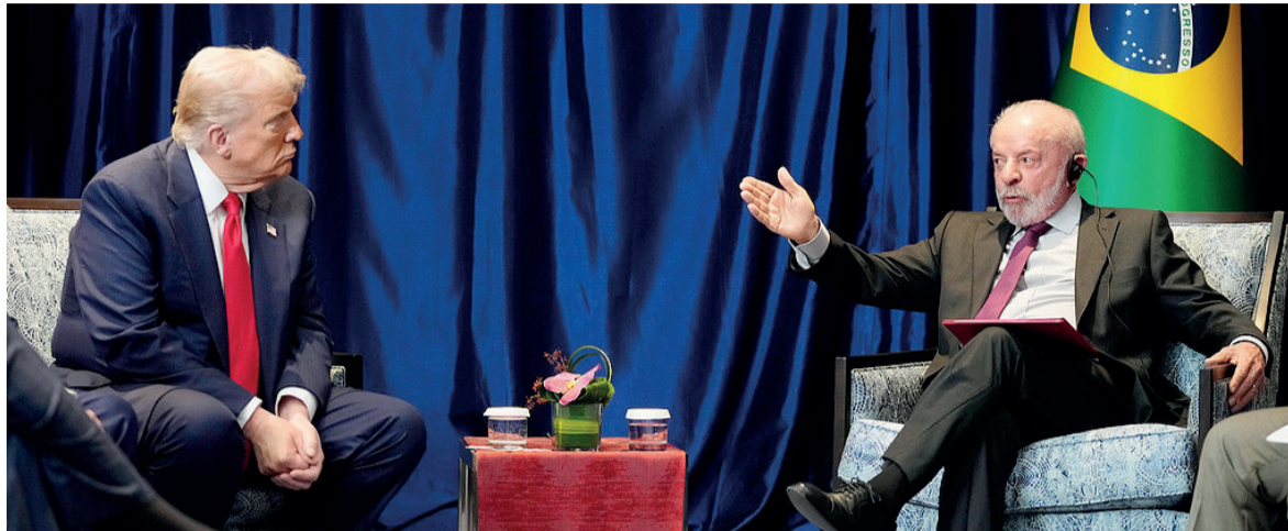
Nueva etapa. Ambos gobiernos coincidieron en abrir conversaciones, con foco en aranceles, comercio, seguridad y cooperación estratégica.

Según fuentes brasileñas, fue Lula quien planteó que cualquier contacto con periodistas se realizaría una vez concluida la reunión. Fi-