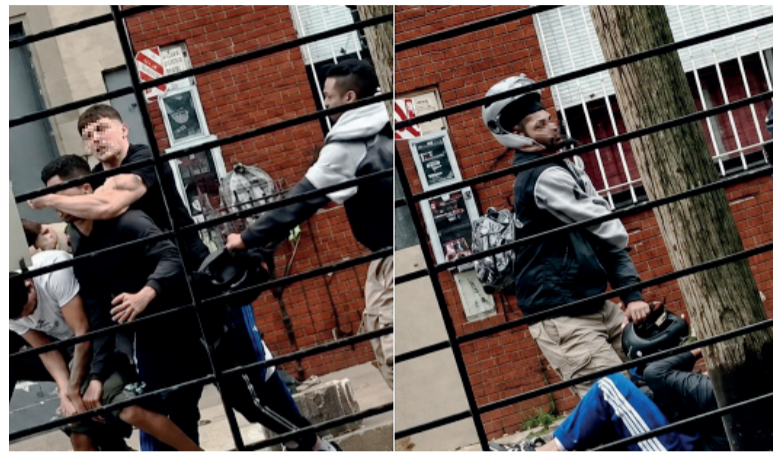
Captura de video. El momento en el que el ladrón es reducido por los vecinos. (Imagen de video retocada con herramientas de IA)

Un grupo de vecinos de La Matanza advirtió que se estaba desarrollando un robo y no tardó en actuar. Uno de ellos redujo al delincuente con una toma de esta práctica de defensa personal.