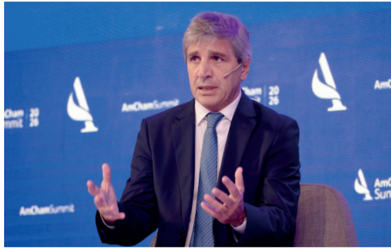
Voz oficial. El ministro de Economía, Luis Caputo.

En la misma, el funcionario afirmó que la gente "no va a votar volver al pasado", en referencia al kirchnerismo. "En un escenario en el que todo está yendo mejor,