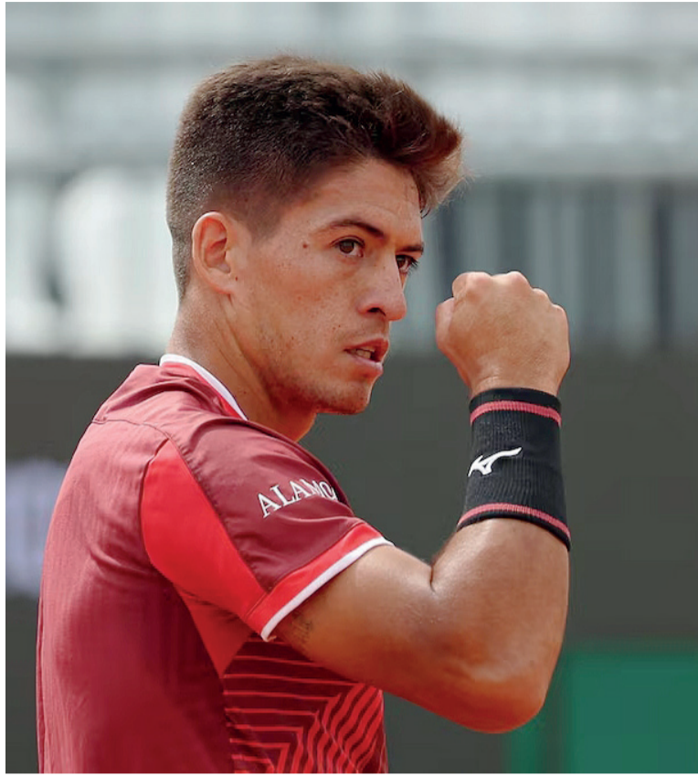
Segunda ronda. El rival de Báez será el kazajo Aleksandr Bublik.

La actividad para los argentinos en el Masters de Roma continuará este jueves, con las presentaciones correspondientes a la