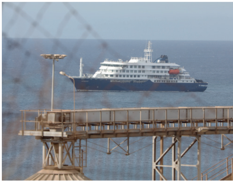
Anclado. El MV Hondius permanece frente a Cabo Verde.

de Sudáfrica y Suiza identificaron una cepa del virus que puede transmitirse de persona a persona en casos raros en tres casos. Se trata de la variante Andes, presente en América del Sur, la única cepa del hantavirus conocida hasta ahora que es transmisible de persona a persona y fue la causante del brote en Epuén, Chubut, en 2018 que provocó 34 contagios y 11 muertes.