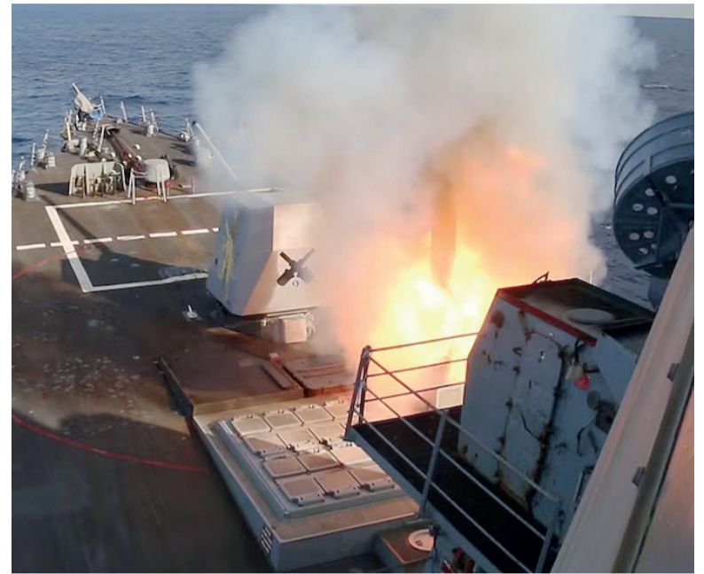
Advertencia. Si fracasan las negociaciones, Estados Unidos retomará los ataques con una intensidad mayor.

La aeronave había despegado desde el portaaviones USS Abraham Lincoln, desplegado en la zona desde enero de 2026 como parte de la campaña de presión