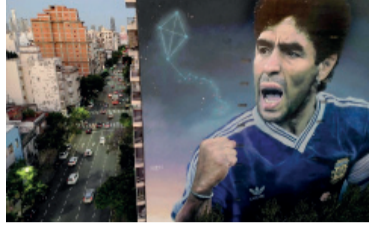
Juicio. Diego Maradona falleció el 25 de noviembre de 2020.