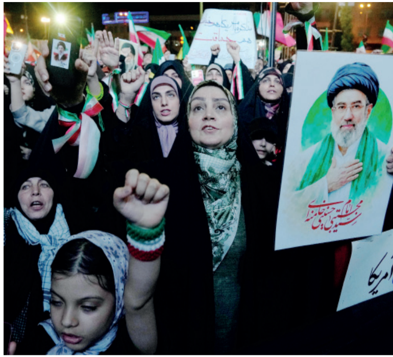
Fragil. Aunque la tregua formal sigue vigente, persisten los cruces diplomáticos y militares.

La decisión iraní llegó después de la reciente ofensiva militar conjunta de Estados Unidos e Israel contra objetivos en territorio iraní. Desde entonces, la región atraviesa una etapa de tensión permanente. Aunque el 8 de abril se anunció una tregua, en los días posteriores continuaron los ataques con misiles y drones lanzados por Teherán contra