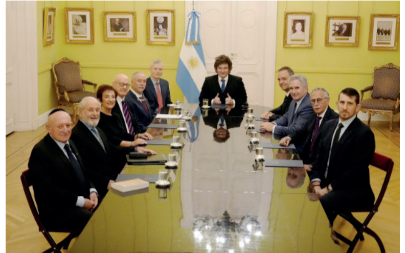
A su lado. Javier Milei y Manuel Adorni, ayer, en Casa Rosada.