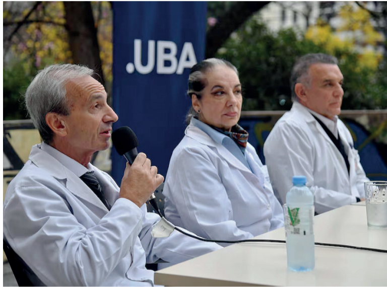
En las calles. Los directores médicos reclamaron por la aplicación de la Ley de Financiamiento 27.795. - Página/12 -

Asimismo, Lafos señaló que en los hospitales tienen que "recorrir a todo tipo de ingeniería", entre lo