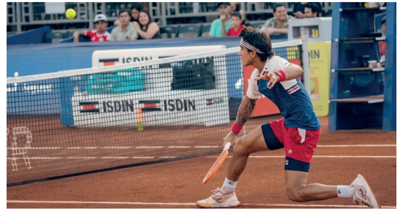
Avanzó. El bonaerense superó al suizo Leandro Riedi, por 6-4, 2-6 y 6-4, en dos horas y dos minutos de juego.

El tenista marplatense logró superar la qualy y se convirtió en el décimo argentino que competirá en el Foro Itálico.