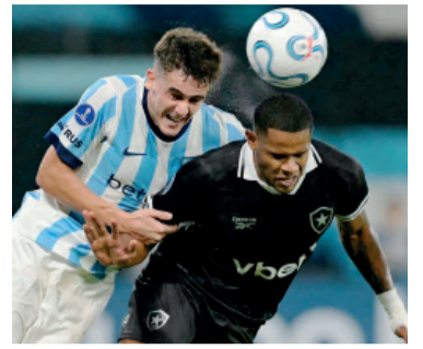
La Academia se juega hoy una gran chance.

Racing visitará hoy a Botafogo de Brasil, por la cuarta fecha del Grupo E de la Copa Sudamericana, en busca de un triunfo clave que le permita meterse en la pelea por el liderazgo.