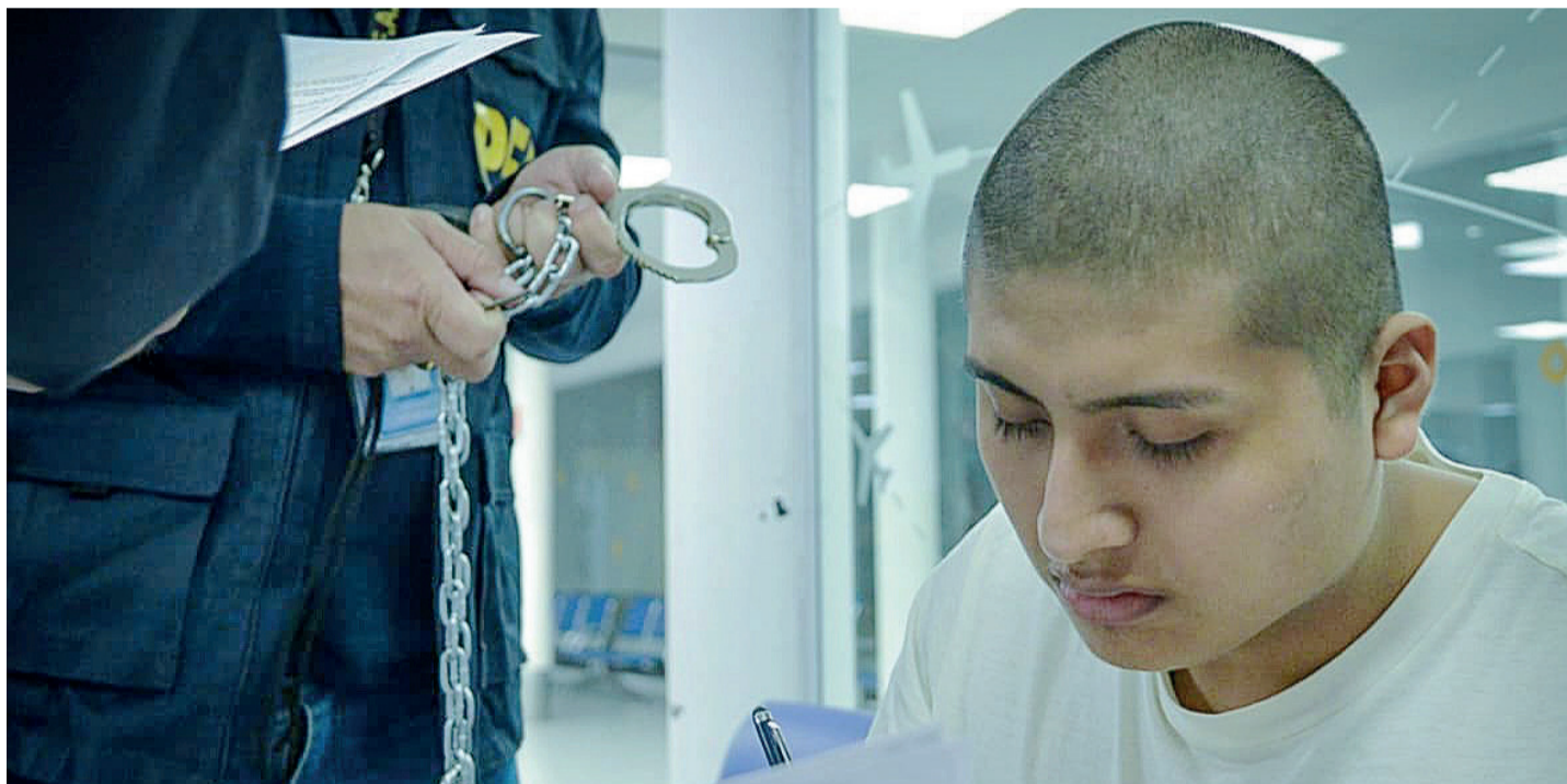
El abogado del presunto narco dijo que su defendido le aseguró que se fue a Perú porque "tenía miedo a que lo maten".

actividad oficial en la Casa Rosada junto a representantes de una entidad jurídica internacional y dispuso que el viernes encabece la reunión de Gabinete. Los movimientos buscan desactivar versiones de malestar interno. Página 3