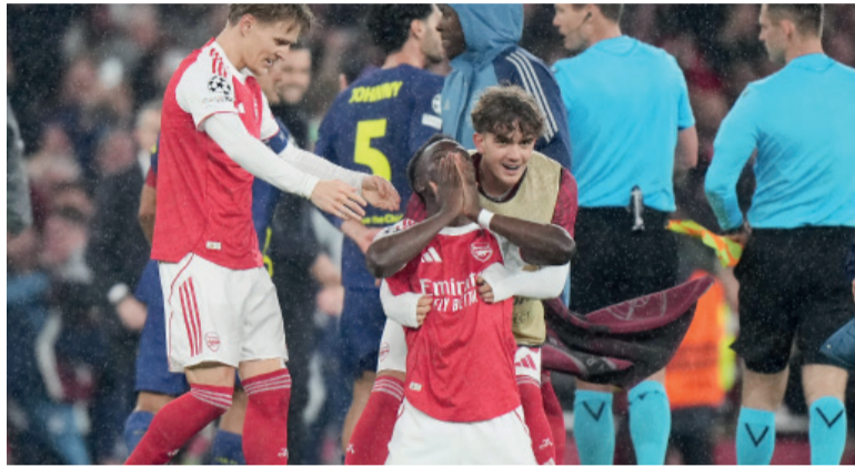
Segunda final. Los ingleses disputarán una definición veinte años después de la caída ante Barcelona.

El equipo de Mikel Arteta derrotó 1-0 al equipo del Cholo Simeone en el Emirates Stadium con un gol de Bukayo Saka sobre el cierre del primer tiempo y selló el 2-1 en el resultado global.