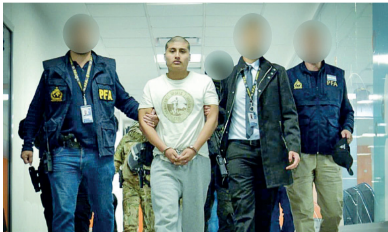
Declaración. El acusado negó haber contratado sicarios.

En la causa hay otras 11 personas imputadas por el juez Rodrí-