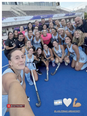
Selfie. Postal del equipo.

Luego, el gran desafío del año será la Copa del Mundo en agosto, también en Bélgica, donde el