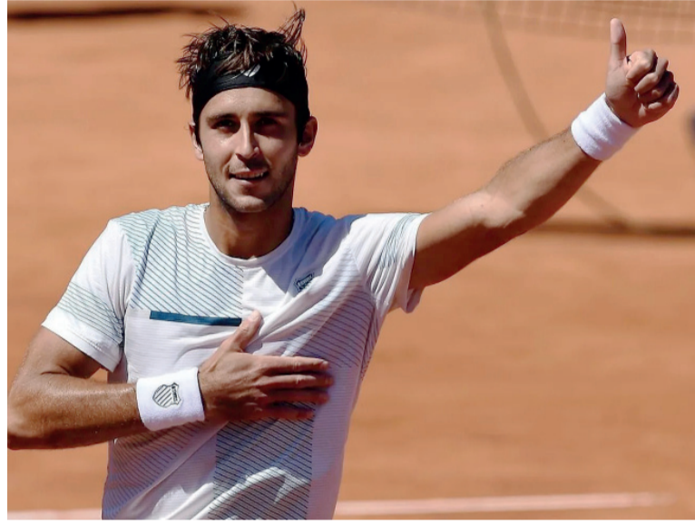
As. Etcheverry, la carta principal de la delegación nacional.