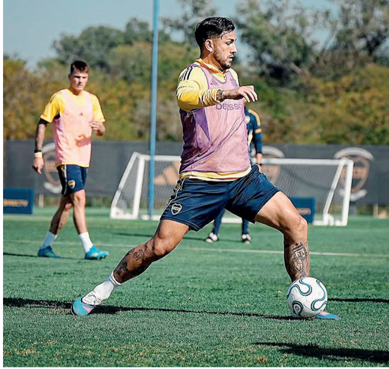
Enfocado. El Xeneize quiere acomodarse en el grupo.

En la Copa Libertadores, Boca tuvo un inicio positivo en el Grupo D: sumó triunfos importantes frente a Universidad Católica de Chile y el propio Barcelona, resultados que lo posicionaron en zona de clasificación. Sin embargo, en su última presentación sufrió un traspíe: cayó 1-0 como visitante ante Cruzeiro, en un encuentro parejo que terminó cortando su