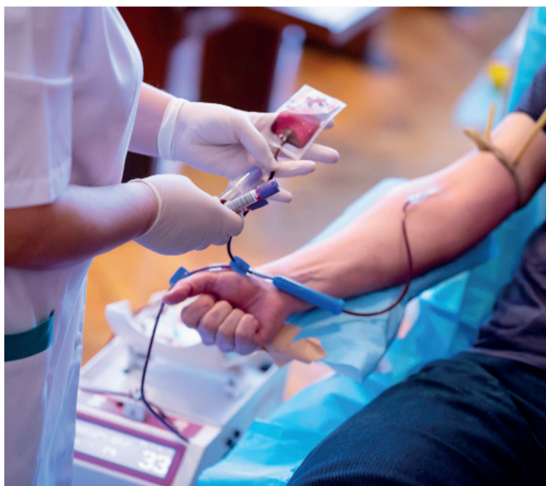
Más cambios. Se actualizan los tiempos de espera para donar según factores de riesgo.

De igual modo, en sintonía con los avances en las pruebas de ta-