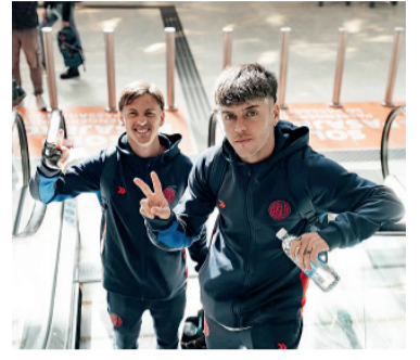
Parada brava en Ecuador.

San Lorenzo de Almagro visita a Deportivo Cuenca desde las 23 en Ecuador, por la cuarta fecha del Grupo D de la Copa Sudamericana, con el objetivo de acercarse a los octavos de final.