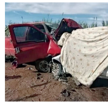
El choque se produjo en un camino rural.

Cerca del mediodía del domingo, dos camionetas chocaron de frente sobre el camino rural que une los pueblos de Fortín Olavarría con Roosevelt, en el partido de Rivadavia, en el sudoeste bonaerense. Debido a la violencia del impacto fallecieron tres personas y dos resultaron heridas.