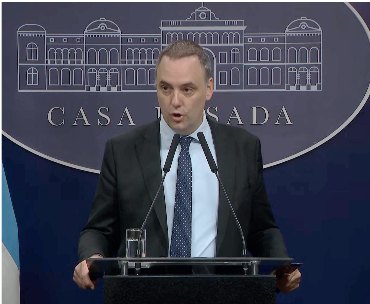
El jefe de Gabinete retomó las conferencias de prensa y usó las respuestas que brindó en el informe de gestión en Diputados.