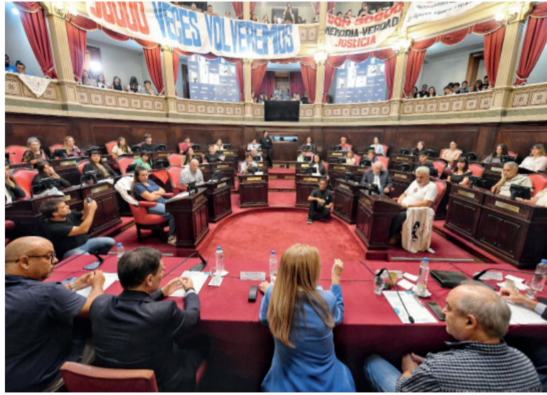
Disputas. Los acuerdos permitirán salir del largo letargo en el que estaba enfrascado el cuerpo.

Más allá de que históricamente el que está primero en la lista es el que queda a cargo, las autoridades de las comisiones las votan los miembros de cada una y eso todavía no está definido. Por ello desde sectores como La Cábora,