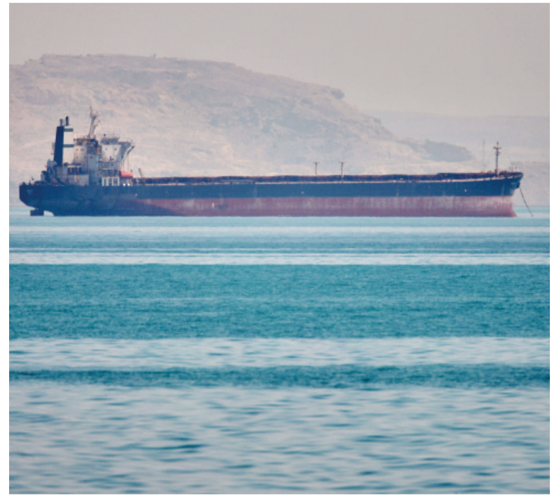
Embarcaciones afectadas. Se indicó que pertenecen a 87 países los buques anclados en alta mar en el estrecho de Ormuz.

su capacidad de escolta, Teherán ofreció una versión diametralmente opuesta de los hechos. Las Fuerzas Armadas iraníes aseguraron que destructores estadounidenses intentaron aproximarse al estrecho de Ormuz desde el mar de Omán y que fueron advertidos en varias oportunidades por radio sobre el riesgo de violar el alto el fuego.