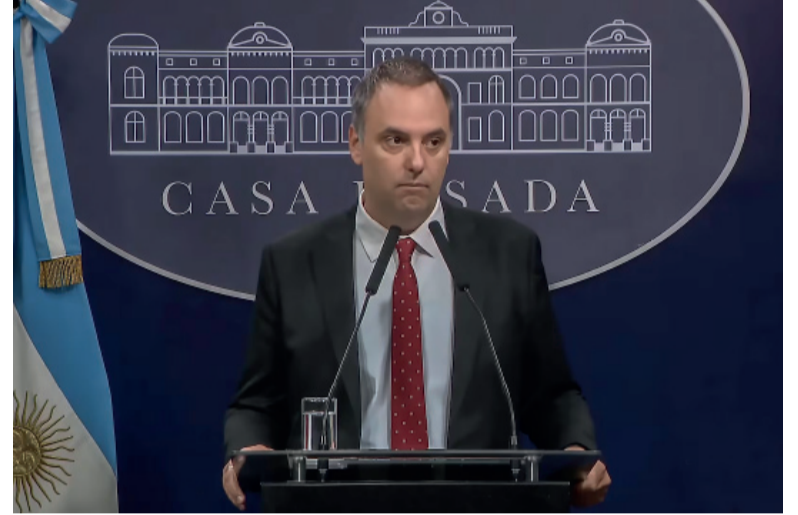
En funciones. Manuel Adorni, ayer, en la reapertura de la Sala de Periodistas.