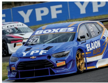
El Chevrolet Tracker dominó la pista.

Franco Vivian fue el gran dominador de la clasificación del TC2000 en el autódromo "Ciudad de Concordia" al marcar 1m41s197 con el Chevrolet Tracker del Pro Racing. El piloto porteño se quedó con la pole position sumando sus primeros puntos fuertes de la temporada.