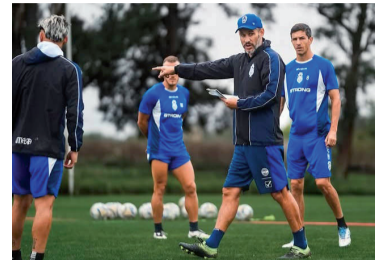
Pereyra le cambió la cara al equipo.

Gimnasia y Esgrima La Plata se cruza con Argentinos Juniors desde las 16 en el estadio Juan Carmelo Zerillo, por la novena fecha del Torneo Apertura. El juez principal será Juan Pafundi, acompañado por Nicolás Lamolina en el VAR.