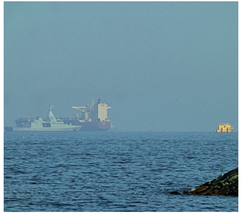
Nueva medida. Las navieras podrían ser sancionadas si realizan pagos al gobierno iraní para transitar de manera segura por Ormuz.

La advertencia incluyó no sólo transferencias en efectivo, sino también activos digitales, compensaciones, intercambios informales, pagos en especie e incluso donaciones canalizadas a través de embajadas iraníes.