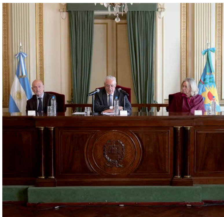
Viejo reclamo. La presentación que hizo la Corte puso en primer plano un proyecto de ley para dotar de autarquía al Poder Judicial.

Una encuesta de la consultora brasileña Atlas-Intel, que funciona en tándem con la agencia de noticias financiera estadounidense Bloomberg, confirmó lo que ya se sabía: que Milei está en su piso de imagen positiva, entre el 30 y el 35%. Pero agregó un dato sorprendente: en la cima de ese ítem aparece la trotskista Miriam Bregman, seguida de Kicillof y de Cristina Kirchner, en ese orden. No se trata de intención de voto, sino de imagen, lo que implica una diferencia fundamental. Pero consolida una idea con impacto concreto en el escenario: la que, hoy, la de que hoy les va bien a quienes se diferencian en forma