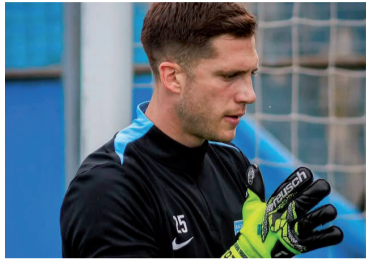
Cambeses, listo para la "final".

Racing Club de avellaneda enfrenta a Huracán desde las 16 en el estadio Presidente Perón, por la novena fecha del Grupo B del Torneo Apertura. El árbitro será Leandro Rey Hilfer, secundado por Yamil Possi en el VAR.