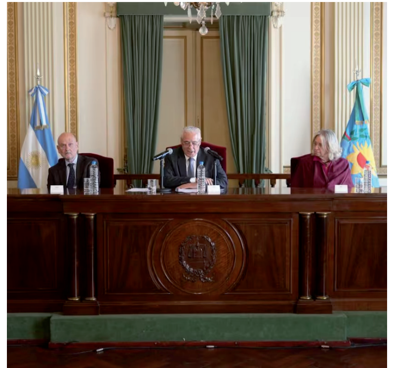
Viejo reclamo. La presentación que hizo la Corte puso en primer plano un proyecto de ley para dotar de autarquía al Poder Judicial.

Una encuesta de la consultora brasileña Atlas-Intel, que funciona en tándem con la agencia de noticias financiera estadounidense Bloomberg, confirmó lo que ya se sabía: que Milei está en su piso de imagen positiva, entre el 30 y el 35%. Pero agregó un dato sorprendente: en la cima de ese ítem aparece la trotskista Miriam Bregman, seguida de Kicillof y de Cristina Kirchner, en ese orden. No se trata de intención de voto, sino de imagen, lo que implica una diferencia fundamental. Pero consolida una idea con impacto concreto en el escenario: la que, hoy, la de que hoy les va bien a quienes se diferencian en forma