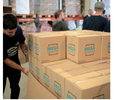
Obligado a recortar. El gobierno provincial suspende la entrega del MESA.

marco de la emergencia económica provincial y, según el texto oficial, responde a la "profunda recesión" y al "incumplimiento de transferencias automáticas y no automáticas" por parte del Estado nacional. Pese a esto, el Gobierno bonaerense anunció días atrás un aumento de los fondos para el Servicio Alimentario Escolar (SAE), la asistencia alimentaria a los municipios y un conjunto de programas sociales.