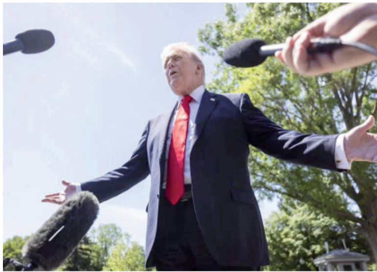
Presentó un informe. Trump dio su versión en el Congreso

un momento en que los líderes del Congreso se enfrentan esta semana a crecientes preguntas sobre si planean programar votaciones sobre una autorización formal de guerra por parte del Congreso.