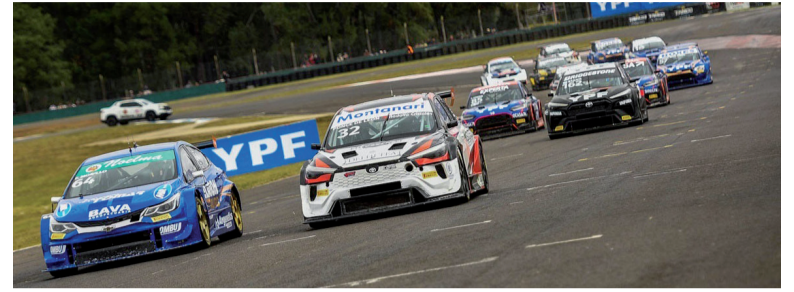
En pista. El TC2000 vuelve al autódromo Ciudad de Concordia.