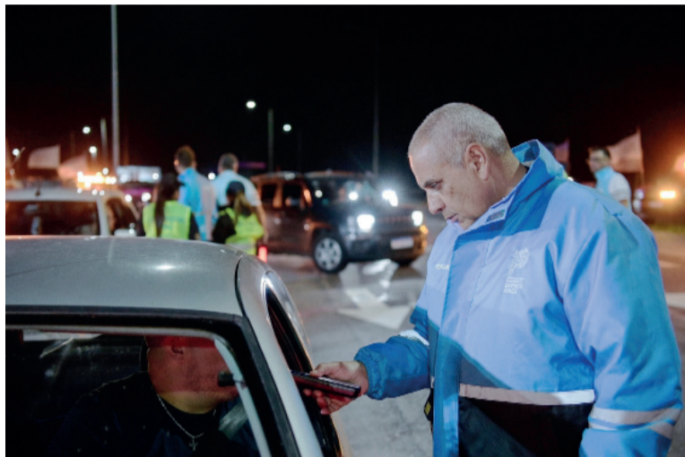
Ojo con las multas. Un operativo de control en una ruta bonaerense.

Cabe recordar que las multas ya habían tenido un ajuste 5,6% en el inicio de 2026 y de 4,9% en el bimestre marzo-abril. La suba va de la mano del valor del litro de nafta Premium en la estación del Automóvil Club ubicada en La Plata, y durante 2025 el incremento rondó el 29,2% y desde que se inició la guerra en Medio