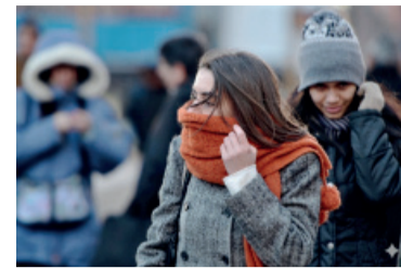
A abrigarse bien.

Las temperaturas elevadas que afectaban a parte de la provincia de Buenos Aires, especialmente el Área Metropolitana (AMBA), desde el último fin de semana de abril, desaparecerán con brusquedad el día de hoy, para dar paso a un frente frío que llega de la Patagonia. Se esperan en zonas rurales mínimas de hasta 3 °C, con lo que podría haber heladas en los cultivos.