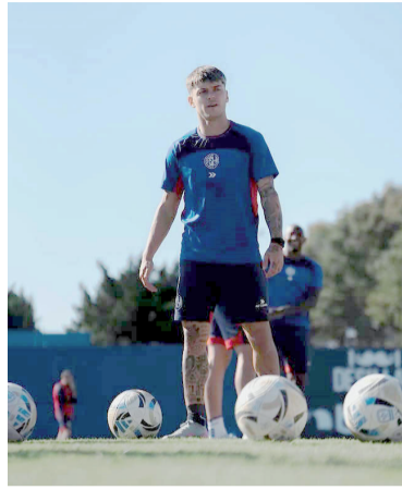
Enfocado. San Lorenzo busca sellar su pase a playoffs.

Incluso en un escenario adverso, el Ciclón mantiene chances: una derrota no lo dejaría automáticamente afuera, ya que su clasificación también dependerá de lo que ocurra con Unión de Santa Fe y Defensa y Justicia, dos rivales directos que también pelean por meterse en la fase final. Esa combinación de resultados mantiene abierto el pa-