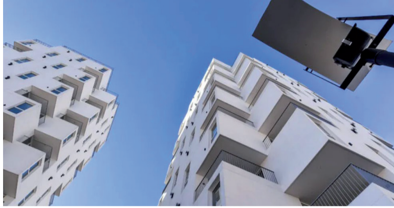
Alquileres. Mes complicado para los inquilinos por los aumentos

El Gobierno de Javier Milei aprobó nuevos aumentos en la tarifa de gas que comenzarán a regir desde este viernes 1 de mayo, en el marco del proceso de actualización del sistema energético. La normativa establece nuevos cuadros tarifarios para Metrogas en el Área Metropolitana de Buenos Aires (AMBA), pero también contempla un ajuste en el interior bonaerense de la mano de la prestadora Camuzzi Gas Pampeana. Estos últimos usuarios, van a tener un aumento superior a los del AMBA.