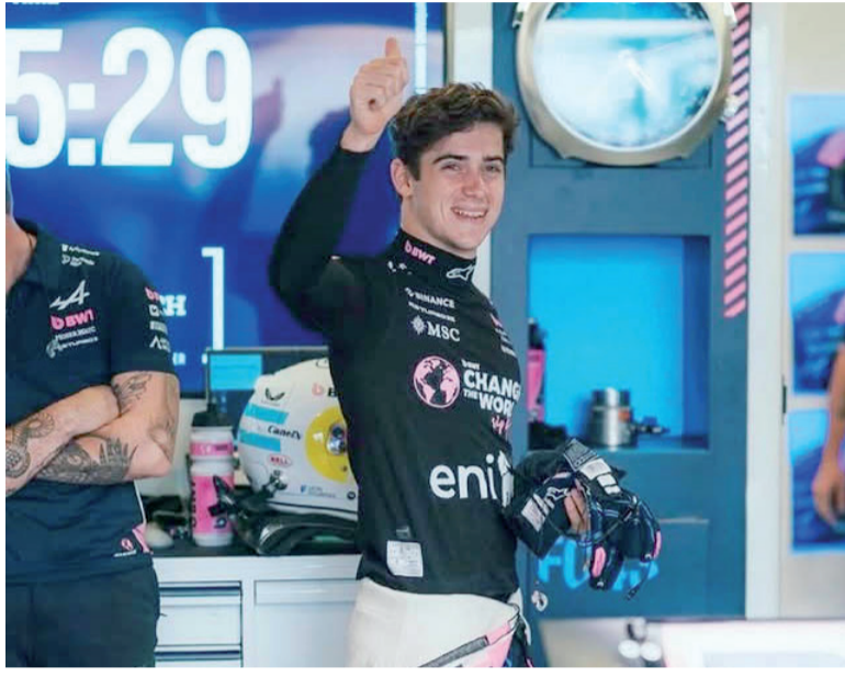
Pulgar arriba. Franco registró su mejor clasificación en Alpine.

El formato Sprint, que otorga puntos únicamente a los ocho primeros, eleva la exigencia desde el inicio. Cada maniobra cobra mayor valor y no hay margen para errores,