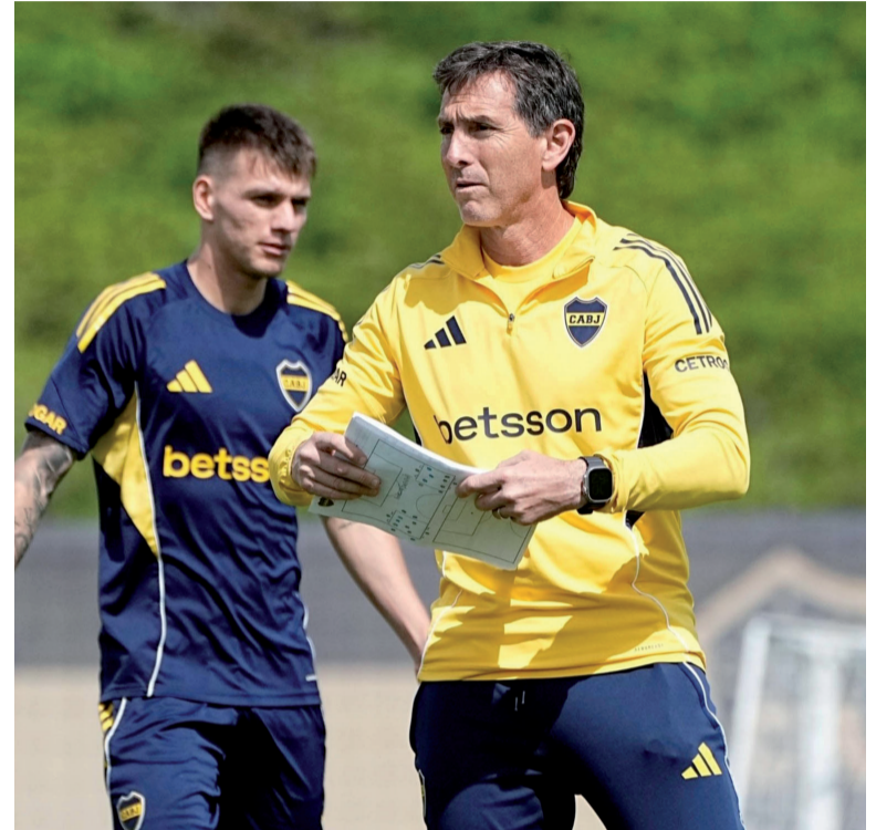
Rota. Úbeda presentará un once alternativo ante el Ferroviario.

Por eso, el cuerpo técnico tomó una determinación contundente: priorizar el duelo del próximo martes frente a Barcelona de Ecuador, en Guayaquil. Con ese objetivo, Úbeda apostaría por una formación alternativa en Santiago del Estero, preservando a va-