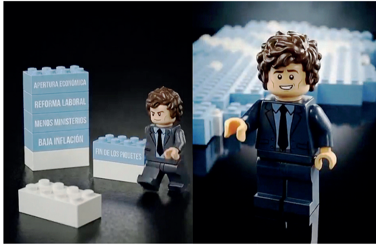
Lego Milei. El insólito video del Gobierno por el Día del Trabajador.

El video fue acompañado por un mensaje del jefe de Estado en redes sociales: “Feliz Día del Trabajador. MAGA! VLLC!”. “MAGA” hace referencia al eslogan “Make