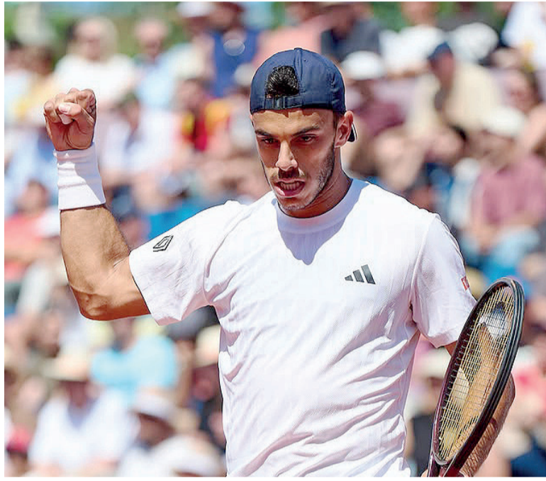
Encendido. "Rulo" desplegó su mejor tenis en Madrid.

La tendencia no se modificó en el segundo set. Cerúndolo mantuvo su consistencia y volvió