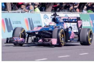
Show. Franco en Buenos Aires.

Con esta victoria, el porteño se instala entre los 16 mejores del torneo y aguarda por su próximo rival, que saldrá del cruce entre el canadiense Félix Auger-Aliassime y el belga Alexander Blockx. El desafío no será menor, ya que Cerúndolo defiende los puntos obtenidos por su destacada actuación en la edición pasada, donde alcanzó las semifinales.