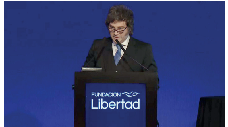
Cierre. El jefe de Estado fue el último orador en un encuentro en el que estuvo acompañado por su hermana Karina y Manuel Adorni.

La coincidencia entre Milei y Macri, tras meses de distancia-