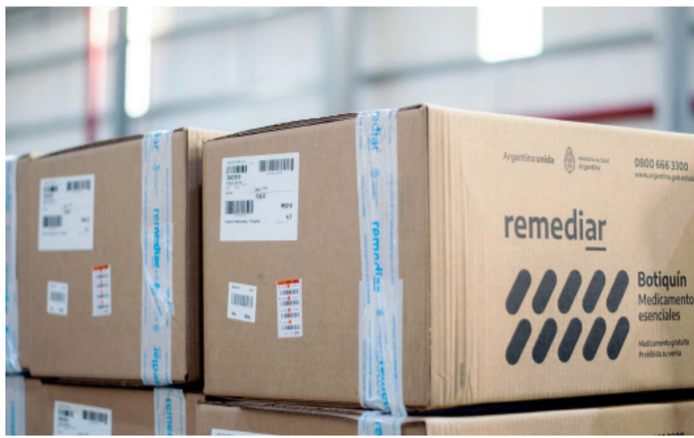
Remediar. La medida del gobierno bonaerense coincide con la interrupción del plan de Nación.

El programa permitirá centralizar y organizar los recursos con ma-