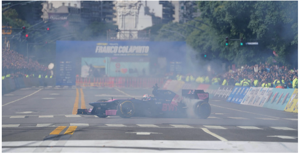
Atracción. Franco completó pasadas, derrapes y aceleraciones ante miles de espectadores.

circulación en ambos sentidos y maniobras constantes que transformaron el corredor porteño en un escenario de estilo Fórmula 1.