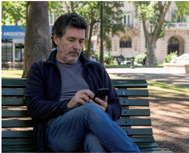
Problemático. La suba de tasas en el último trimestre de 2025 enciende alarmas. - IA -

Al evaluar los motivos que propiciaron la suba de la morosidad, el análisis del JP Morgan señaló, por un lado, que a diferencia de lo ocurrido en México o Brasil, Argentina registró fuertes incrementos en las tasas de interés du-