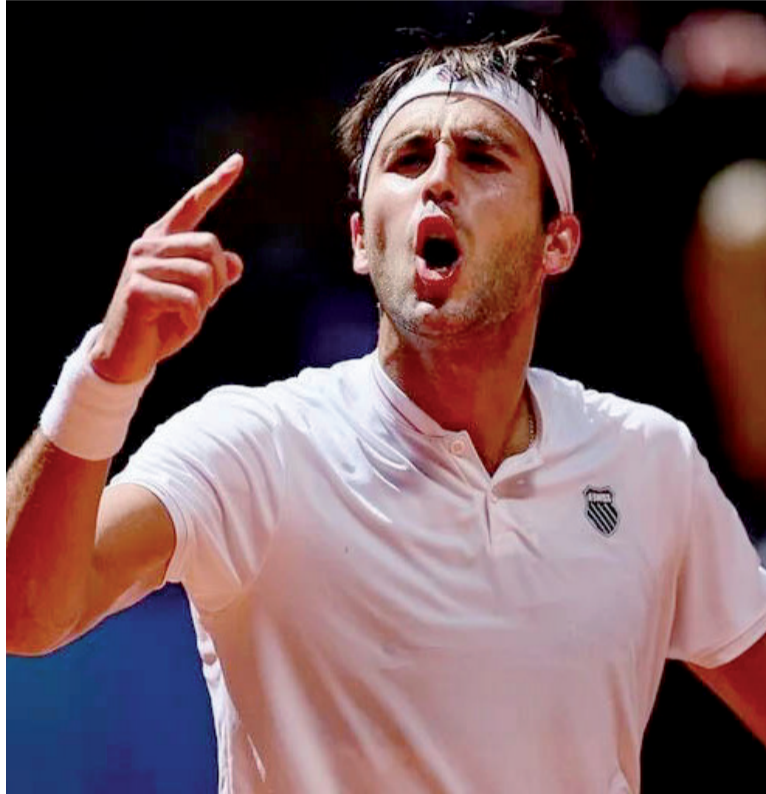
Imponente. El platense dio una muestra de carácter en la "Caja Mágica".

Ya en el tramo final, Etcheverry mostró su mejor versión. Rápidamente consiguió un quiebre en el inicio y luego amplió la diferencia para colocarse