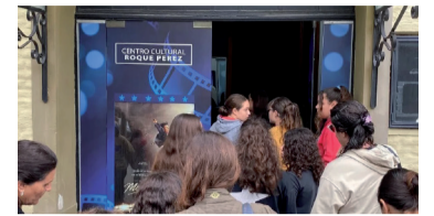
"Michael", la primera proyección en este regreso.

Los 12 mil habitantes de Roque Pérez vivieron un día de fiesta con el regreso del cine a la ciudad. Tras tres décadas de ausencia, volvió a abrir sus puertas. Y lo hizo el viernes a las 19, con el estreno de "Michael", la película sobre el "Rey del Pop", Michael Jackson. Las entradas tenían un valor de $ 6.000 para las funciones 2D, y de $ 7.000 para las 3D.