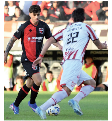
Paridad en el Coloso de Rosario.