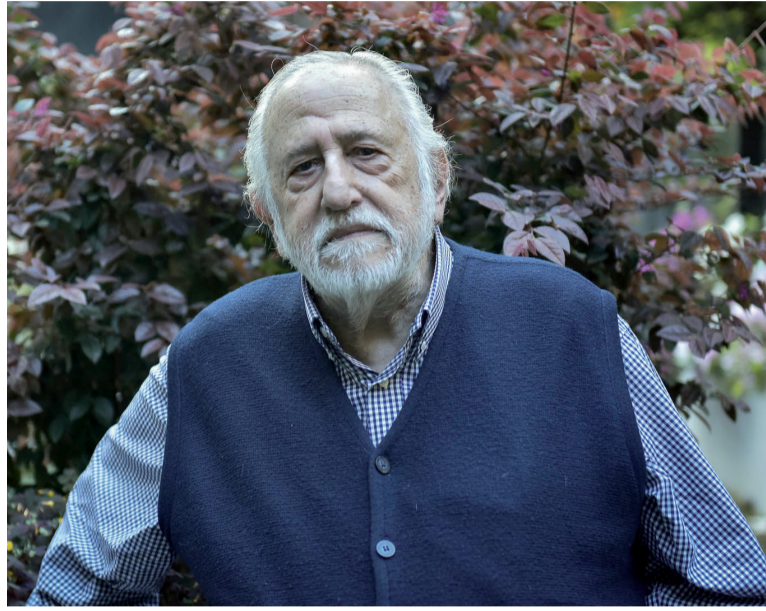
Enorme. El director de cine argentino Adolfo Aristarain.

Antes de consolidarse como director, trabajó como asistente en más de treinta producciones, incluidas realizaciones internacionales como "Érase una vez en el Oeste", de Sergio Leone. A lo largo de su carrera alternó proyectos entre Europa y Argentina, aunque fue en España donde recibió uno