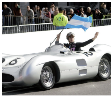
Franco manejó el W196.

Colapinto se fundió en un abrazo simbólico con la historia grande de nuestro automovilismo al ponerse al mando del Mercedes-Benz W196, la mítica "Flecha de Plata" con la que Juan Manuel Fangio grabó su nombre en la eternidad.