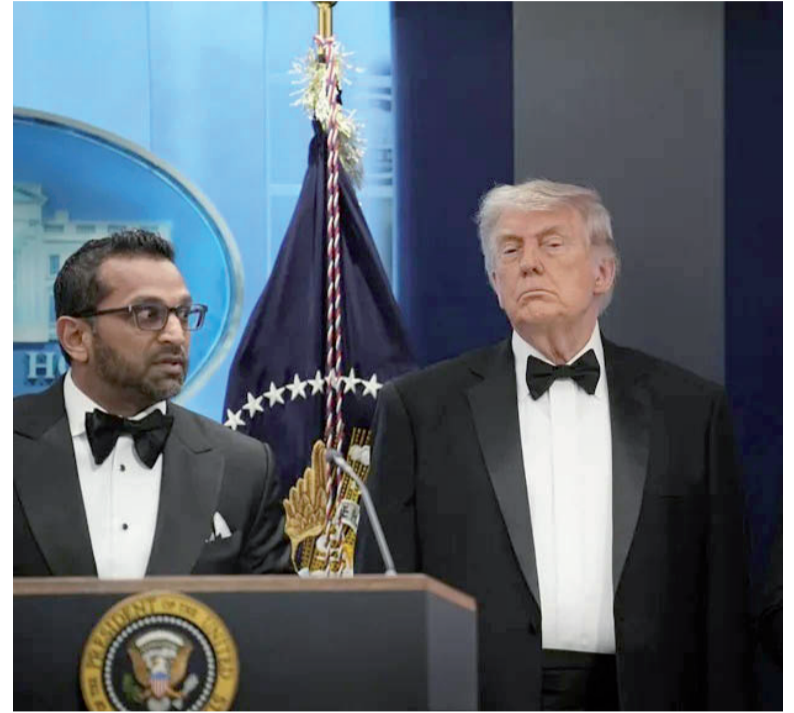
De urgencia. Conferencia de prensa en la Casa Blanca.

Donald Trump exigió la finalización inmediata del salón de baile que ordenó construir en la Casa Blanca. En la red Truth Social, argumentó que el incidente refuerza la necesidad de contar con un espacio de mayor seguridad dentro del complejo presidencial. - DIB -