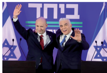
Unen fuerzas. Naftali Bennett (izq.) y Yair Lapid, aliados.

Netanyahu regresó al cargo en diciembre de 2022 después de elecciones anticipadas y encabezó lo que los críticos llaman el Gobierno más ultraderechista en