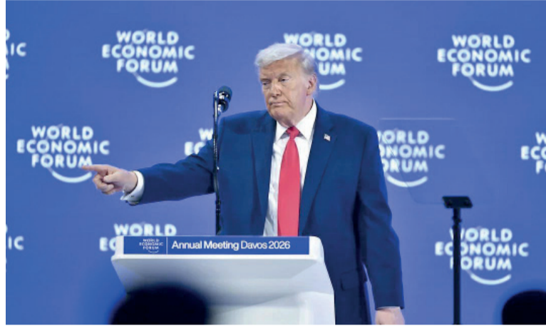
Firme postura. Del presidente estadounidense insiste con el acuerdo.

Según explicó, el canciller Abbas Araghchi -ya presente en la capital paquistaní- mantendrá conversaciones únicamente con autoridades de alto nivel de Pakistán, en el marco del rol mediador de ese país, pero no con enviados de Estados Unidos. La declaración desmintió de plano los anuncios previos de la Casa Blanca y puso en duda la inminencia de una segunda ronda