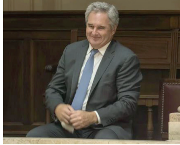
El canciller argentino. Pablo Quirno

Quirno comenzó su mensaje señalando que “ante las recientes declaraciones públicas de altos funcionarios del Gobierno del Reino Unido de Gran Bretaña e Irlanda del Norte respecto de la soberanía sobre las Islas Malvinas, la Argentina reafirma sus derechos soberanos sobre las Islas Malvinas, Georgias del