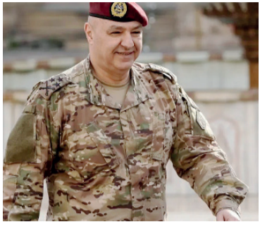
El presidente libanés Joseph Aoun.

El presidente libanés, Joseph Aoun, declaró el viernes que más de un millón de personas han sido desplazadas en el Líbano, más de 10.000 han muerto o resultado heridas, y las pérdidas acumuladas por la guerra superan los 14.000 millones de dólares, al tiempo que instó a la Unión Europea a convocar una conferencia internacional sobre la reconstrucción.