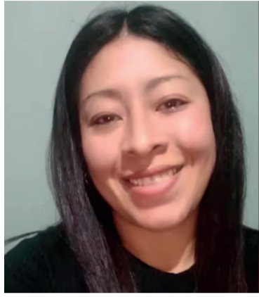
Prisión perpetua. Para el femicida de la enfermera asesinada en Jujuy.