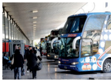
La terminal porteña de Retiro.