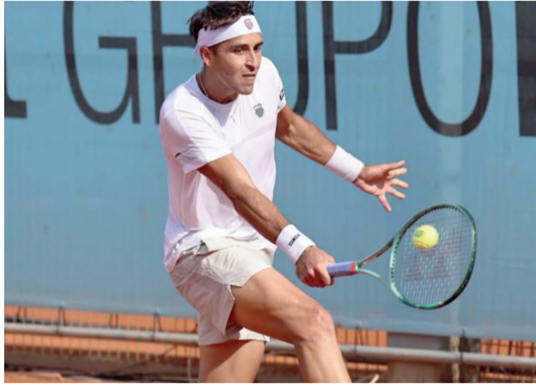
Slice. Sólido trabajo desde la línea de fondo del platense.

Desde el inicio, Etcheverry logró imponer condiciones. Si bien