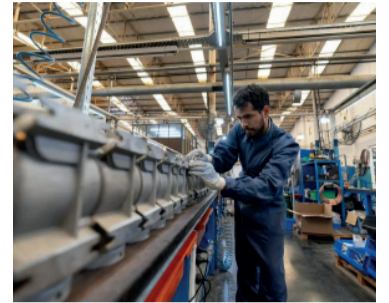
Anunciaron reducción. En las tasas de interés de sus líneas RePyME

Por su parte, la línea RePyme Inversión disminuyó su tasa de interés de desde 51% a desde 46% TNAV, lo que refuerza el financiamiento destinado a la adquisición de bienes de capital, proyectos de ampliación y mejoras