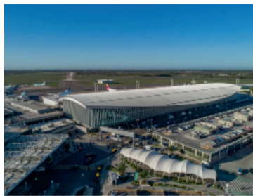
Saldo negativo. Cayeron un 19,9% las salidas.

En contrapartida, marcó que “las salidas al exterior incluyeron a 1.529,1 miles de visitantes residentes por todas las vías internacionales, de los cuales 1.061,8 miles fueron turistas y 467,3 miles fueron