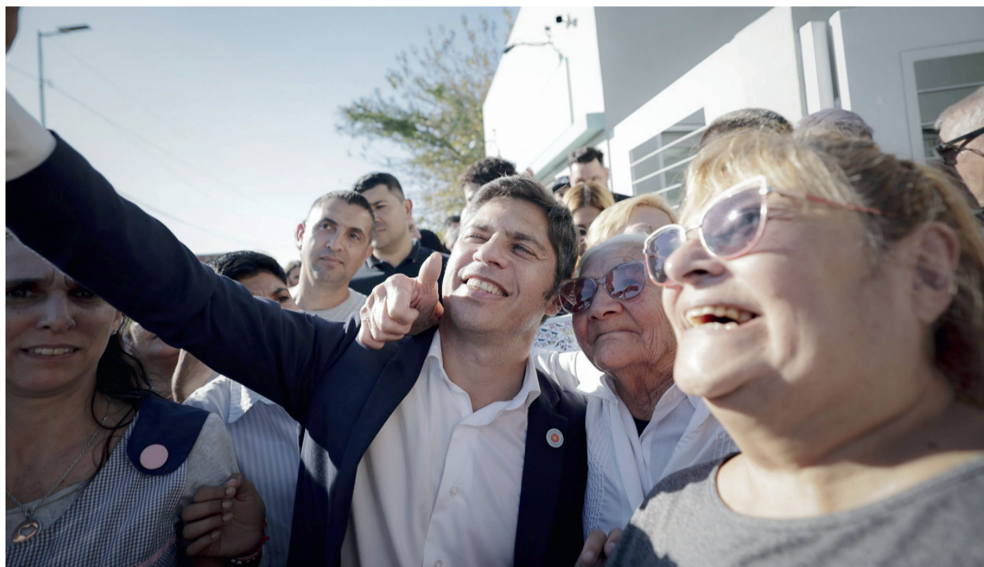
Kicillof encabezó la primera reunión del Consejo partidario desde que asumió el cargo

resto de los implicados, entre ellos el empresario Lázaro Báez. La medida está orientada a garantizar el recupero de los fondos públicos involucrados en uno de los casos de corrupción más resonantes de los últimos años. Página 3