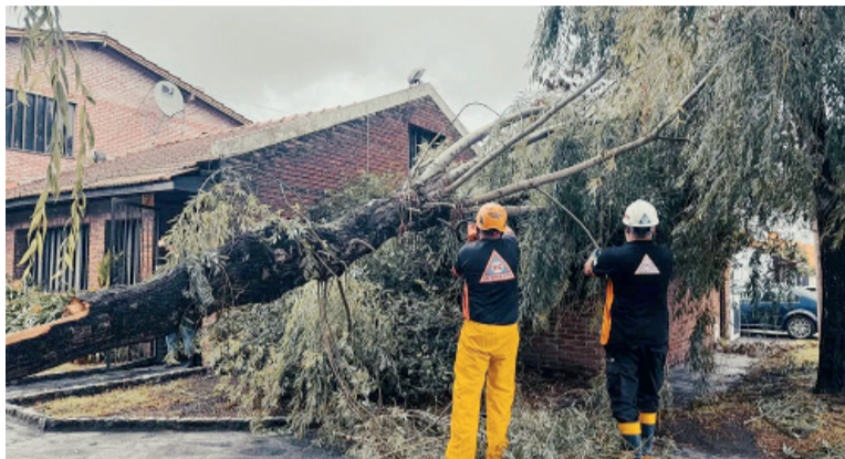
Peligro. Los fuertes vientos pueden provocar caídas de árboles e interrupción de servicios.

El escenario, según explican desde Meteored, está relacionado con la profundización de un ciclón extratropical sobre el Mar Argentino, frente a las costas bonaerenses. Este sistema avanzará durante el fin de semana desde la Patagonia y arrastrará una masa de aire muy frío de origen polar.