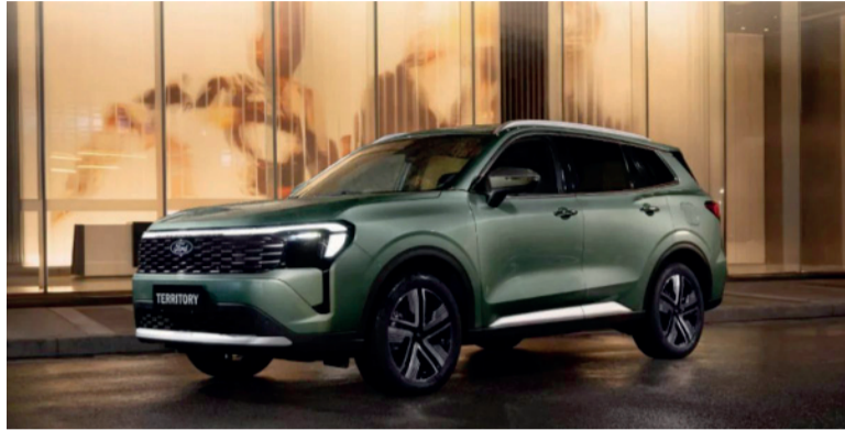
Importante crecimiento. Ya se patentaron 20 mil vehículos híbridos y eléctricos.

Los segmentos restantes muestran una participación más