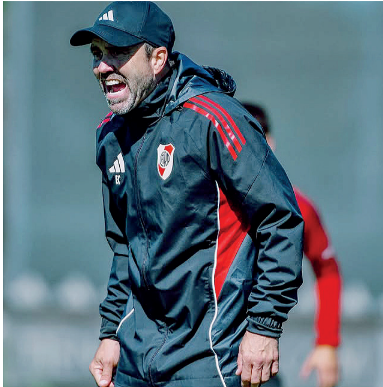
Cambia. Coudet cuidaría titulares pensando en la Sudamericana.

liza posibles variantes en la formación. La lesión de Sebastián Driussi obliga a rearmar el ataque, mientras que también podrían darse cambios en la defensa, en parte por cuestiones de rendimiento y en parte pensando en la exigente seguidilla de partidos: el próximo jueves tendrá un compromiso importante por la Copa Sudamericana frente a Red Bull Bragantino, lo que exige administrar cargas y mantener la competitividad en ambos frentes.