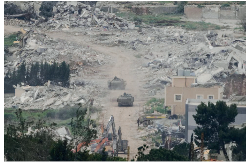
Sin tregua. En el sur del Líbano, al menos tres personas murieron en bombardeos atribuidos al Ejército israelí.

Mientras tanto, la violencia persiste en otros frentes de la región. En el sur del Líbano, al menos tres personas murieron en