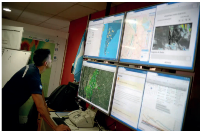
De paro. De 5 a 12 el SMN dejará de difundir pronósticos, avisos y reportes oficiales.

todo en las partidas programadas durante la mañana, mientras que los arribos no reprogramados deberán ser atendidos por razones de seguridad operativa.