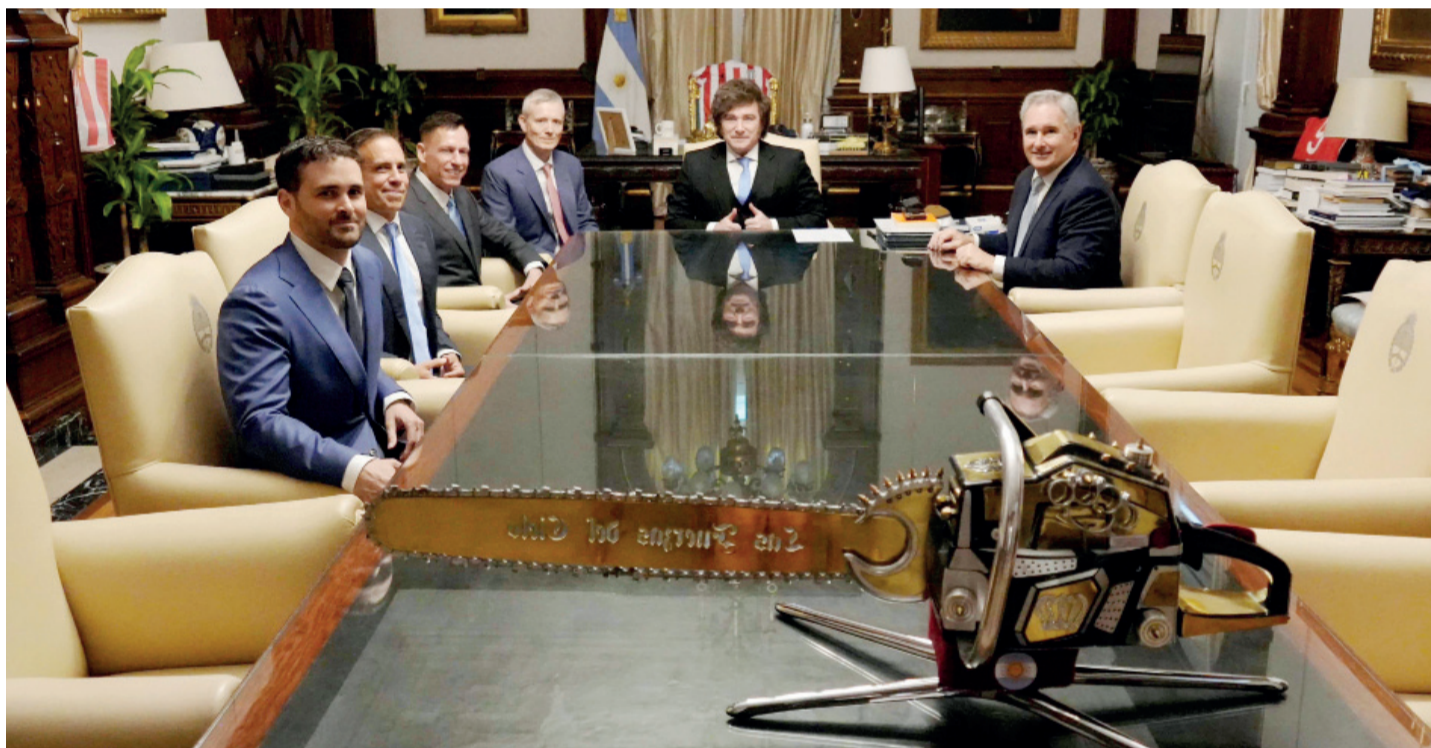
■ Encuentro con Peter Thiel. "Fue una reunión maravillosa. Es un anarcocapitalista, entonces está muy interesado en cómo es ser Presidente siendo anarcocapitalista".