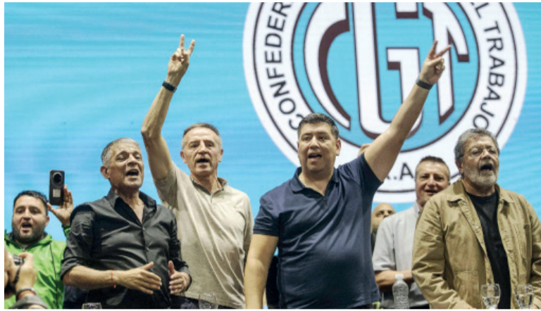
En otra dirección. La Justicia había hecho lugar a un planteo de la CGT.

El recurso fue concedido el 7 de abril "en relación y con efecto devolutivo", lo que implicaba que la cautelar seguía vigente durante la tramitación de la apelación. Frente a ese encuadre, el Estado se presentó en queja para que se modificara el efecto del recurso y se le otorgara