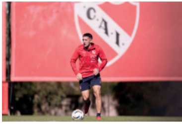
El Rojo llega en un buen momento.

Independiente buscará tres puntos claves ante Riestra