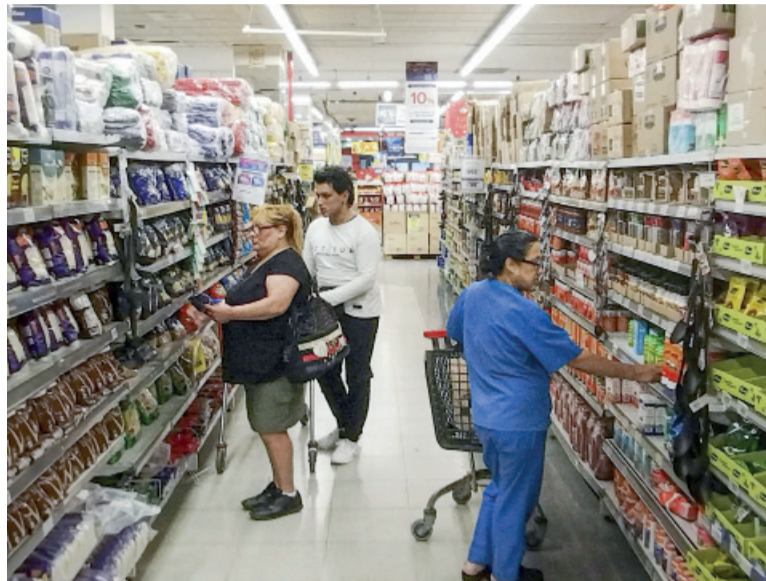
En rojo. En valores corrientes, todos los canales evidenciaron subas por debajo de la inflación.

En el caso de los supermercados, el descenso real del 3,1% interanual se da en un contexto donde algunos rubros muestran fuertes aumentos nominales, como carnes (+46,9%) y frutas y verduras (+37%). El comportamiento de los medios de pago marca una tendencia clara: las tarjetas de crédito concentraron el 43,6% de