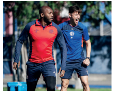
El Ciclón necesita sumar de a tres.

Platense recibe a San Lorenzo en un duelo crucial