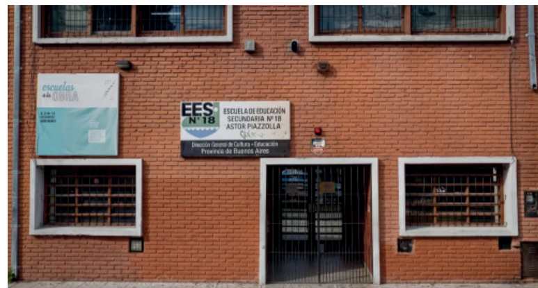
En “Mardel”. La Escuela Secundaria N° 18 “Astor Piazzolla”.

Identificaron a un alumno que llamó a la escuela para hacer una amenaza. La familia deberá pagar los costos del operativo.