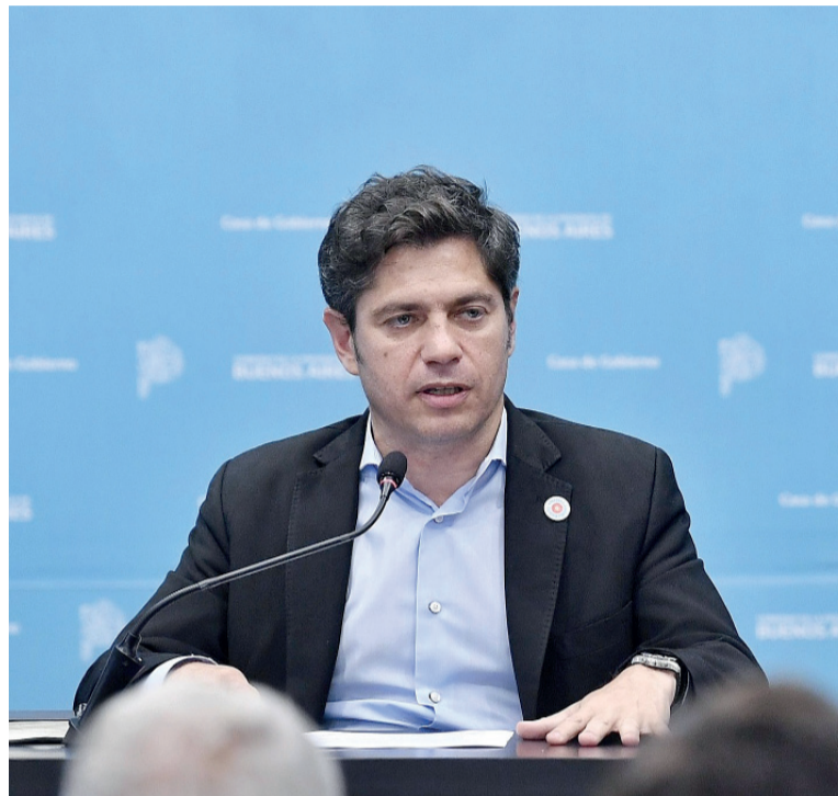
En la mesa. El gobernador Kicillof encabezará hoy la reunión en la Corte.

En la primera audiencia, Anses argumentó que no contaba con información suficiente para calcular las transferencias adeu-