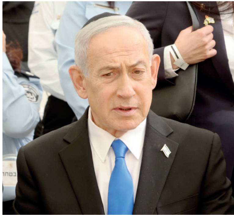
Defensa de la humanidad. El primer ministro dijo que es el rol de Israel ante "el fanatismo bárbaro".

En paralelo, el Gobierno israelí debió salir a contener un episodio que generó rechazo internacional.