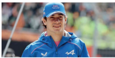
Saldrá a pista desde las 12.45.

El pilarense recorrerá el trazado en uno de los micros descapotables dispuestos por la Ciudad, en un contacto directo con los fanáticos que se acerquen al lugar, además de la entrega de remeras como parte del espectáculo. La exhibición contará con