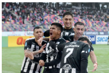
Tarde de goles en Santiago.

El Pirata se ubica quinto con 23 puntos, a falta de dos fechas, mientras que el Guapo suma 20 y se mantiene expectante en la pelea por ingresar a la próxima instancia.