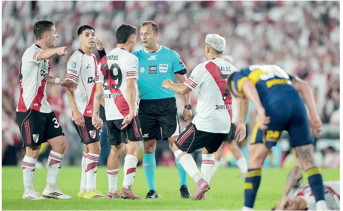
Polémica. Los jugadores de River rodean al árbitro tras la acción entre Blanco y Martínez Quarta.