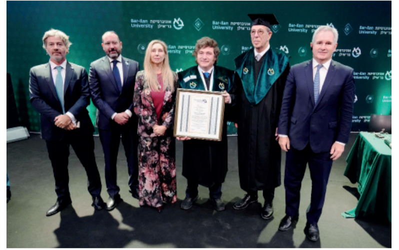
Honoris Causa. Milei y comitiva, ayer en la Universidad de Bar-Ilan.

El domingo Milei fue recibido en Jerusalén por el primer ministro Benjamin Netanyahu, a quien en redes sociales le dedicó un saludo: "Bienvenido a Israel,