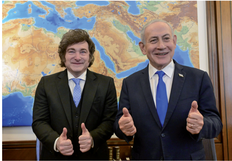
Bilateral. Javier Milei junto al primer ministro israelí Benjamin Netanyahu.

los anuncios más destacados fue la presentación de los llamados "Acuerdos de Isaac", una iniciativa que busca replicar en América Latina el espíritu de los Acuerdos de Abraham. Según explicó Milei, el objetivo es fortalecer vínculos diplomáticos, comerciales y estratégicos con Israel, además de coordinar acciones contra el terrorismo, el antisemitismo y el narcotráfico.