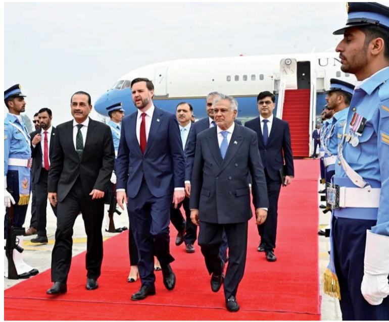
Una parte. El vicepresidente estadounidense, JD Vance, estará en Pakistán.

Trump afirmó ayer que la Armada atacó y tomó el control de un buque de carga con bandera iraní que intentó atravesar el bloqueo en el Estrecho de Ormuz. “Un buque de carga de bandera iraní llamado Touska, de casi 900 pies de largo y con un peso similar al de un portaaviones, intentó burlar nuestro bloqueo naval, y no les salió nada bien”, señaló en un mensa-