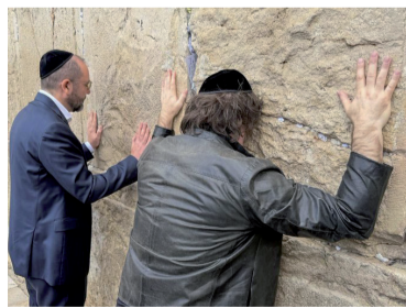
El presidente Milei visitó el Muro de los Lamentos.

En el plano tecnológico, anunció la firma de un memorando de entendimiento en inteligencia artificial y adelantó que ambos países trabajarán en el desarrollo conjunto de modelos, formación de especialistas y aplicación en sectores productivos. Pero uno de