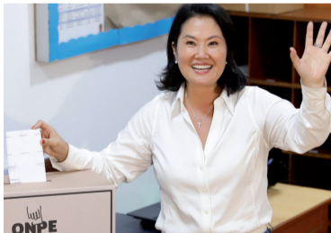
Keiko Fujimori, ganadora de la primera vuelta.