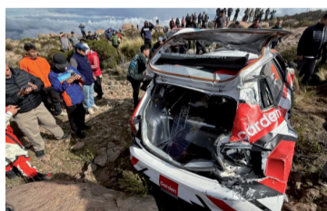
Tragedia. El Volkswagen Polo Rally tripulado por dos competidores paraguayos.

Tras el siniestro, se activaron de inmediato los protocolos de seguridad, con la intervención de