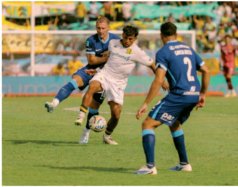
Irregular. La Academia puede quedarse fuera de playoffs.

buscó reacción con variantes ofensivas. Gustavo Costas movió el banco con los ingresos de Matko Miljevic, Tomás Conechny y más tarde Matías Zaracho, en busca de mayor claridad en ataque. El equipo de Avellaneda tuvo más iniciativa, pero le costó generar peligro sostenido ante un Aldosivi ordenado y dispuesto a sostener la ventaja.