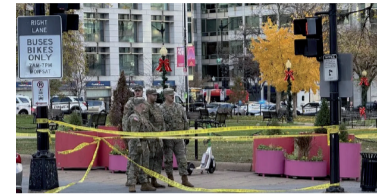
Horror en Shreveport, estado de Luisiana.

Unos ocho menores de entre 1 y 14 años murieron en un tiroteo que tuvo lugar en la madrugada de ayer en Shreveport, estado de Luisiana, según informó la Policía local, que calificó el suceso como un “altercado doméstico”.