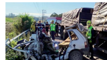
Fallecieron los cinco ocupantes del automóvil.

El choque se produjo durante la mañana del sábado, cuando un automóvil y un camión de gran porte colisionaron de manera frontal, según informaron autoridades brasileñas. El impacto ocurrió alrededor de las 7, en la región del Alto Vale de Itajaí, donde por causas que aún se investigan el Fiat Uno en el que viajaban las víctimas impactó contra el camión. De acuerdo con los reportes oficiales, todos los ocupantes del vehículo -incluidos los dos argen-