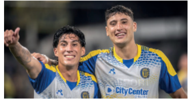
Un nuevo paso hacia los playoffs.