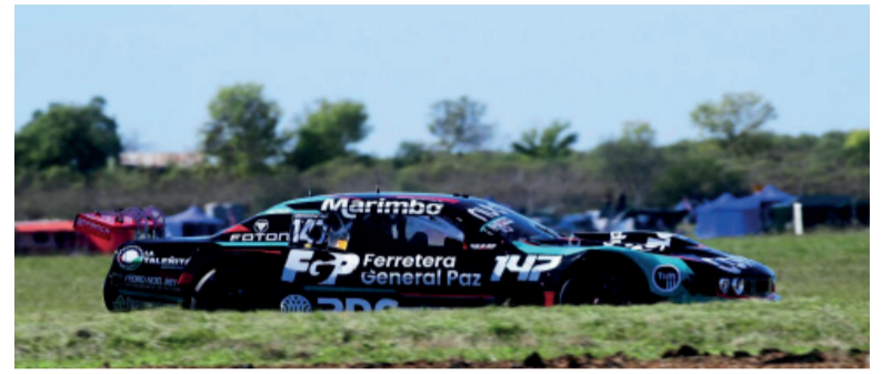
Voló. El cordobés al volante del Dodge Challenger del Galarza Racing.