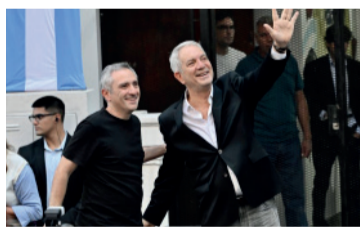
Perdón. "Si nos vamos a recriminar errores, no habrá unidad", señaló el jefe comunal.

El jefe comunal propuso avanzar hacia un "frente patriótico bonaerense" con el objetivo de pro-