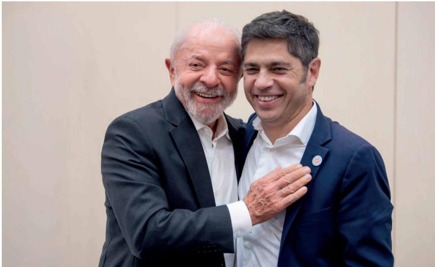
El gobernador junto al presidente de Brasil en una reunión clave para mostrar el contraste con la política internacional del Gobierno nacional.

el primer ministro Benjamin Netanyahu, participará de los festejos por la independencia israelí y recibirá reconocimientos institucionales, en una visita que refuerza su alineamiento con el gobierno israelí. Página 3