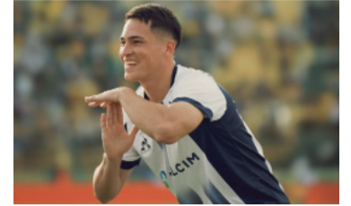
La T quiere sostener su rendimiento.

Talleres de Córdoba enfrenta a Deportivo Riestra desde las 20.30 en el estadio Mario Alberto Kempes, por la decimoquinta fecha del Grupo A del Torneo Apertura. Dirige Fernando Echenique, mientras que Salomé Di Lorio estará en el VAR.