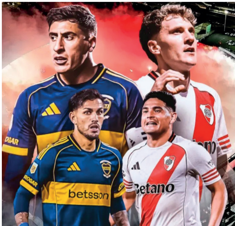
Electrizante. Una nueva edición del Superclásico en el Monumental.

River y Boca sufrirán ausencias de peso producto de sus participaciones internacionales. El miércoles, en el mano a mano con los venezolanos, se lesiona-