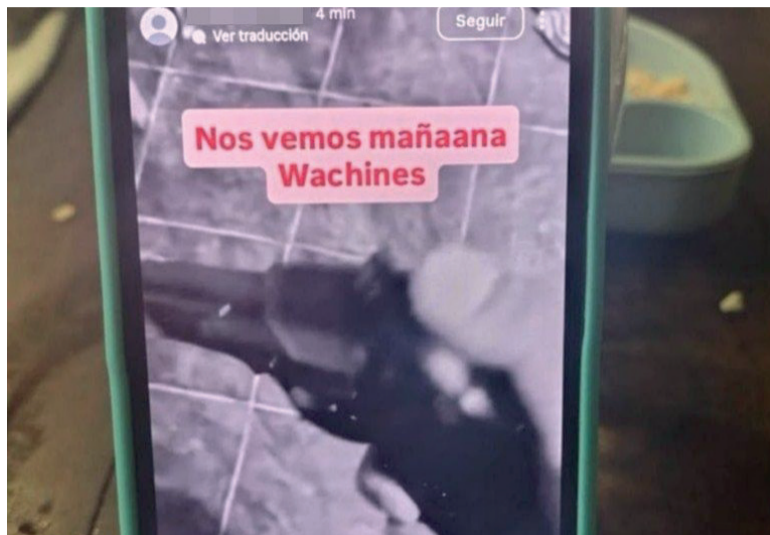
En San Miguel. La amenaza que aparecía en la cuenta de Instagram que después fue cerrada.

El denunciante aportó las capturas de pantalla y los investigadores constataron la existencia de las cuentas que luego fueron cerradas, pero luego profundizaron las diligencias