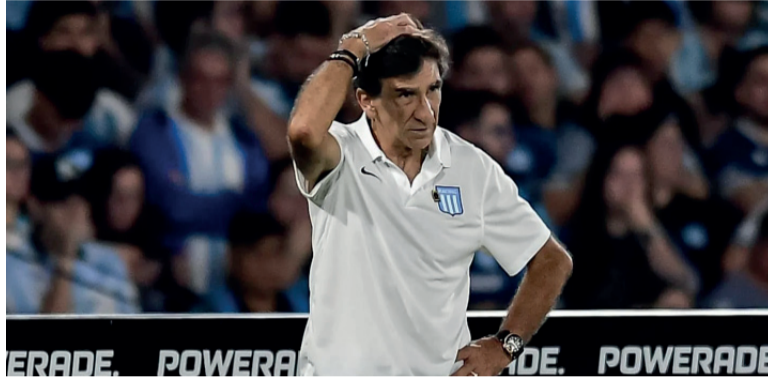
Cuestionado. Costas se juega su cargo en Mar del Plata.

Racing llega a este encuentro en un muy flojo momento, ya que perdió en tres de sus últimas cua-