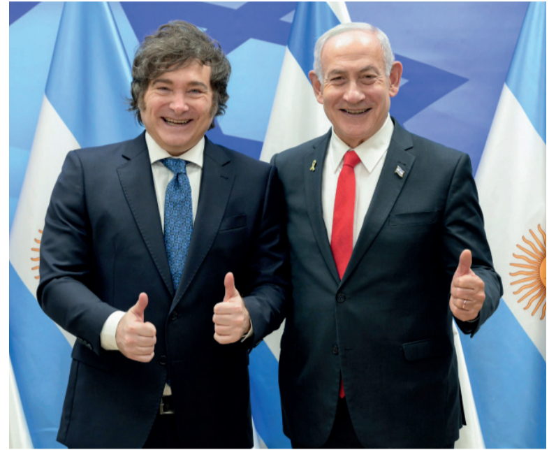
Aliados. El presidente argentino junto al primer ministro Benjamin Ne-

En paralelo a la gira, Milei reforzó su alineamiento ideológico con Israel en una entrevista concedida a un medio local. Allí