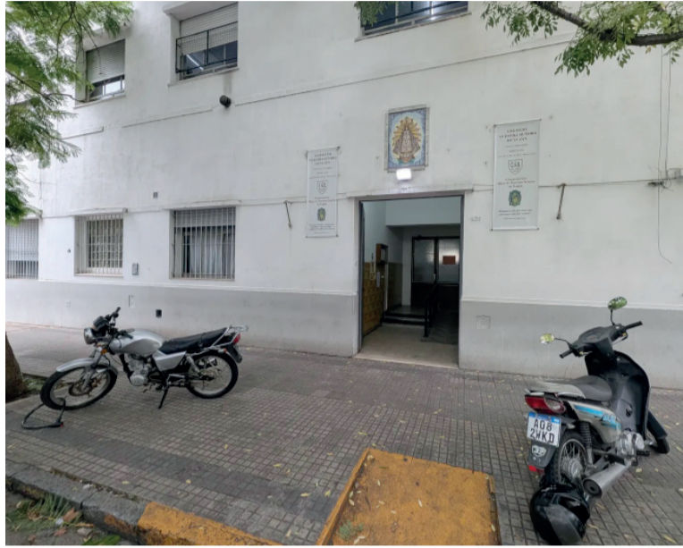
La Plata. El colegio Nuestra Señora de Luján, al que un alumno llegó armado. 0221

Además de las amenazas en la provincia de Buenos Aires y otros ocho distritos, también se registraron en colegios de Uruguay, Chile y Paraguay. - DIB -