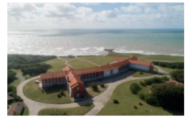
El complejo de Chapadmalal.

Unos 30 trabajadores del complejo turístico de Chapadmalal fueron intimados a desalojar las viviendas que ocupan dentro del predio desde hace años, en el marco del proceso que impulsa el Gobierno nacional para concesionar el histórico lugar a operadores privados. Según informó la Agencia de Administración de Bienes del Estado (ABE), tienen 10 días corridos para cumplir con el pedido.