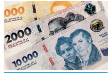
En caída. El índice de los salarios creció un 2,4% en febrero

Desglosado por sectores, únicamente el informal tuvo mejor