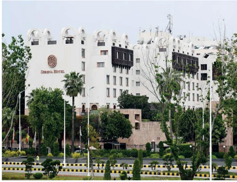
Negociaciones. En Islamabad aguardan para la firma del acuerdo, según Trump.

moratoria sobre el programa nuclear iraní vaya a expirar después de 20 años.