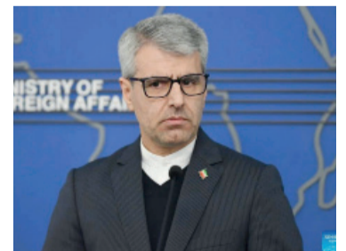
Esmail Baghaei. Ministro desmintió a Trump

Baghaei declaró a la televisión estatal que el levantamiento de las sanciones y la indemnización por