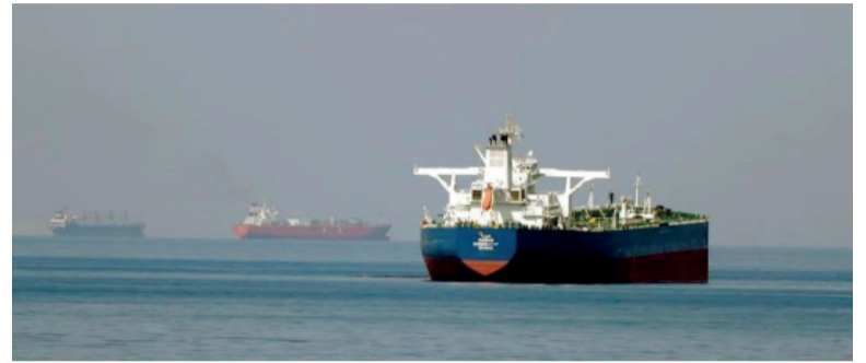
Abierto. El paso para buques comerciales por el estrecho de Ormuz.

Esto pese a la reapertura anunciada, tanto por Trump, como por Irán