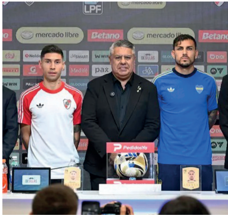
Trascendental. Los capitanes remarcaron la importancia del partido.

Paredes, por su parte, remarcó el valor emocional y deportivo del partido. “El deseo es competir por cosas importantes. Por eso volví. El Superclásico es de los partidos más importantes de nuestra carrera”, expresó, vinculando su