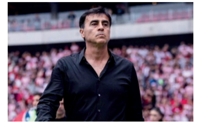
Quinteros busca los playoffs.

Independiente de Avellaneda recibe a Defensa y Justicia desde las 19.30 en el estadio Libertadores de América, por la decimoquinta fecha del Grupo A del Torneo Apertura, en busca de un triunfo que le permita afianzarse en los puestos de clasificación a los playoffs. El árbitro designado fue Sebastián Martínez, quien contará con la colaboración desde el VAR de Pablo Echavarría.