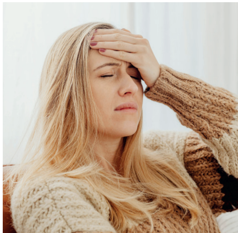
Enfermedad prevalente. La migraña afecta a una de cada diez personas en el mundo.

“El impacto funcional de esta enfermedad en la vida diaria también es un indicador muy importante. Cuando el dolor obliga a frenar todo, cancelar actividades o compromisos, ausentarse al trabajo o estudio, apagar la luz y acostarse, eso ya habla de un nivel de discapacidad que merece ser evaluado.