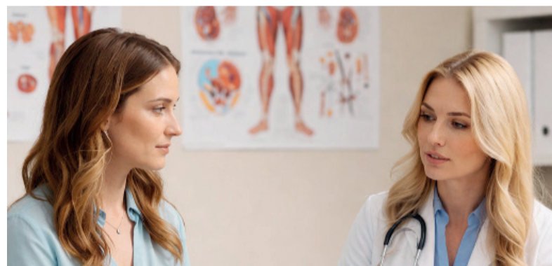
Diferencia. La mayor parte de las víctimas de la migraña son mujeres.