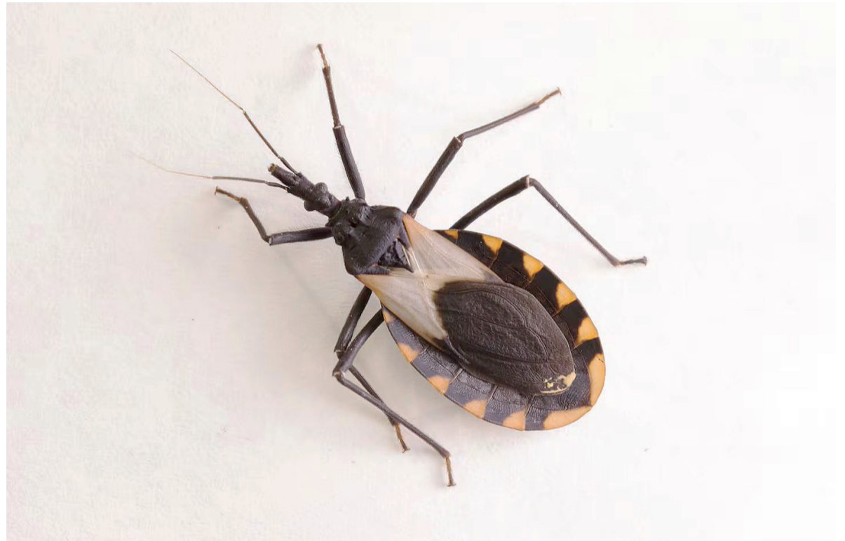
Endémico. Un gran problema con el chagas es que pueden pasar años antes de que haya síntomas.

Según un estudio difundido por la Mayo Clinic, en su fase crónica la en-