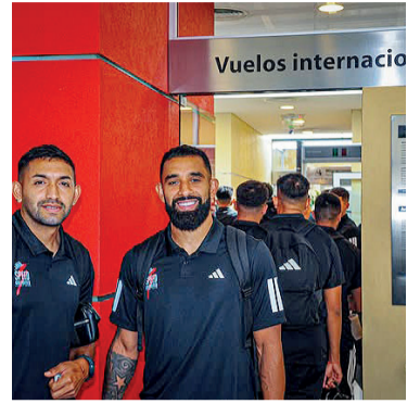
Herrera, el arma del Malevo.

Deportivo Riestra visita a Gremio desde las 19, por la segunda fecha del Grupo F de la Copa Sudamericana. El árbitro será el boliviano Gery Vargas, mientras que en el VAR estará Jorge Justiniano.