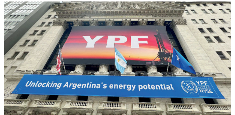
Última chance. A Burford sólo le queda recurrir a la Corte Suprema de los Estados Unidos.

En un nuevo revés para los fondos demandantes, la Cámara de Nueva York suspendió todas las apelaciones de la demanda, que originalmente obligaba a Argentina a pagar US$16.100 millones.