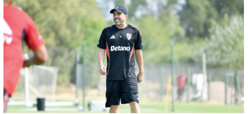
Rotación. "Chacho" afronta la Sudamericana con la mente puesta en Boca.

El punto central del análisis pasa por el estado físico del mediocampo. Nombres como Aníbal Moreno y Fausto Vera acumulan una alta cantidad de minutos en