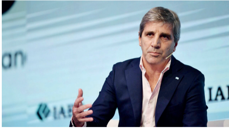
Optimismo. Para el ministro en abril se inicia la desinflación.

"Seguramente el IPC sea superior al 3%", afirmó el ministro durante una exposición en la Bolsa de Comercio de Rosario, donde tam-