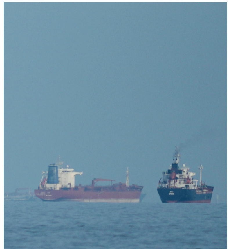
Advertencia. El presidente de EE.UU. dijo que el buque que se acerque al bloqueo "será eliminado".

El Centcom agregó que las fuerzas estadounidenses no obstaculizarían la libertad de los