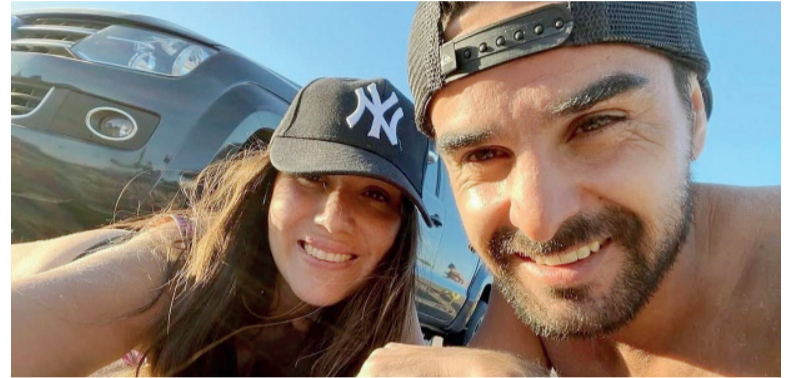
El crimen. Se produjo en la madrugada del 1° de diciembre de 2024.