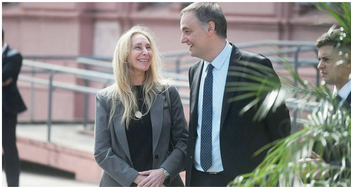
La secretaria General de la Presidencia volvió a mostrarse junto al funcionario investigado por enriquecimiento ilícito.

año y un quiebre en la tendencia a la baja. El titular del Palacio de Hacienda aseguró que desde abril comenzará un proceso de desaceleración, con expectativas de desinflación sostenida y recuperación de la actividad. Página 3