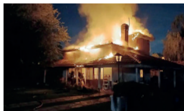
Las llamas envuelven la vivienda.

Maximiliano Maidana (43), quien sufrió quemaduras en el rostro y brazos, todo comenzó en el living de la vivienda.