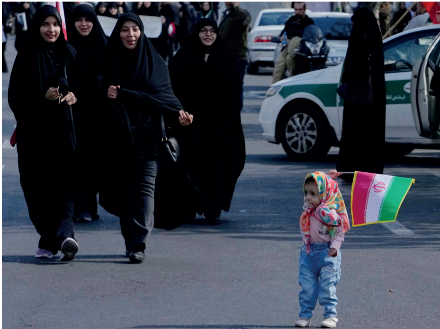
Una niña hace flamear una bandera iraní en las calles de Teherán, horas antes del anuncio del alto el fuego.