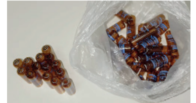
Las ampollas aparecieron abiertas.

Hallaron ampollas vacías de fentanilo en el Hospital de Bahía Blanca