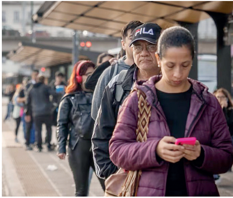
Larga espera. Servicio de transporte limitado en el AMBA.