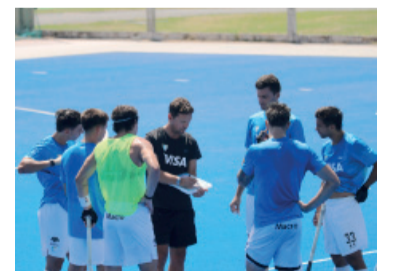
Fue 5 a 0 en la gira europea.

Argentina, que se mantiene entre los mejores del mundo y forma