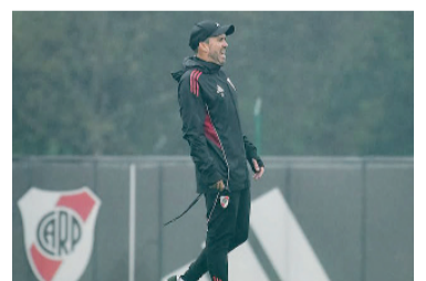
Arranca su camino en la Sudamericana.