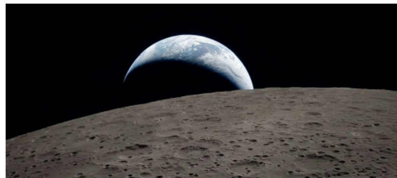
Inédita. La Tierra "se pone", vista desde la Luna.

"Puestas de Tierra", "amaneceres", eclipses, récord de distancia desde la Tierra: el vuelo de la Orión dejó hitos memorables.