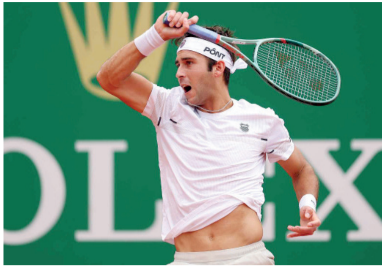
Solidez. El platense se mostró firme y dañino con su derecha.

El encuentro comenzó bajo el signo de la paridad. Ambos jugadores sostuvieron sus servicios y se repartieron quiebres en el inicio, manteniendo la tensión hasta el 4-4. Allí, Etcheverry mostró una marcha extra: sostuvo en blanco y luego aprovechó su oportunidad para cerrar el primer set, evidenciando solidez mental en