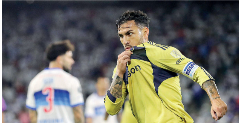
Amor. La jerarquía del capitán inclinó la balanza en el Claro Arena.

El encuentro comenzó con intensidad e imprecisiones. Jhojan Valencia avisó con un remate lejano, mientras Boca respondió con presión alta y firmeza en las disputas. A los 16 minutos llegó la apertura del marcador: Marcelo Weigandt salvó una pelota sobre la línea lateral y habilitó a Bareiro, quien cayó dentro del área; tras el rechazo de Juan Ignacio Díaz, Paredes capturó el rebote