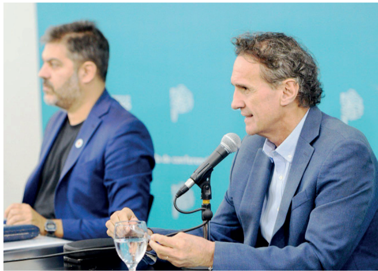
En conferencia. El ministro de Infraestructura y Servicios Públicos, Gabriel Katopodis.

"Pretendemos que hagan de veedor y que participen de todo el proceso de selección", dijo en conferencia de prensa desde la Gobernación. Y destacó que a pocos días del cierre de ofertas, se cambiaron decenas de artículos del pliego, alterando las condiciones originales. Para la Provincia, esos movimientos "desvirtúan" la competencia y abren sospechas sobre posibles