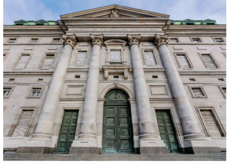
Banca pública. El Banco de la Nación Argentina.