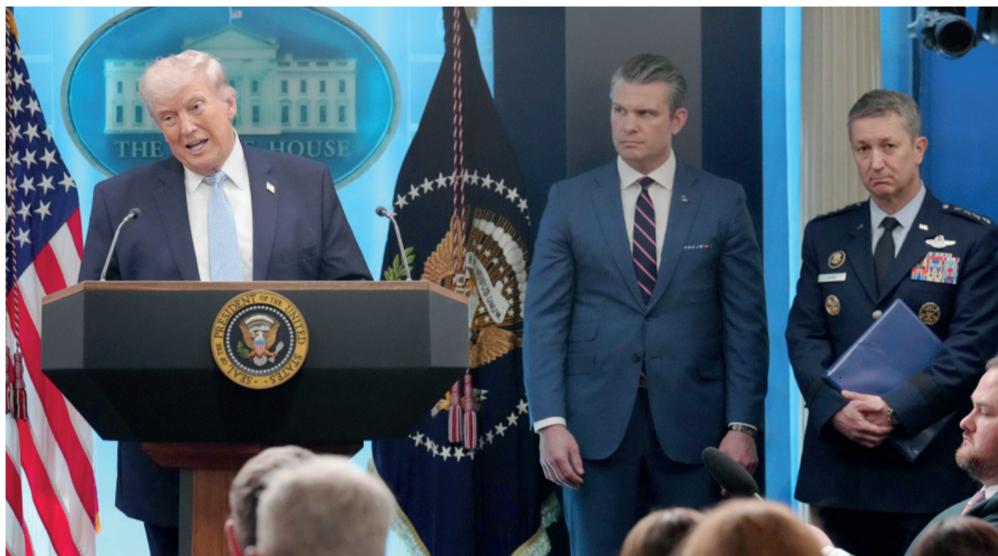
El mandatario republicano apuntó contra los medios de comunicación por la filtración de la operación de rescate de un piloto en Irán.

ción crediticia y requisitos de solvencia iguales para todos los clientes. Desde la oposición impulsan pedidos de informes en el Congreso y advierten posibles violaciones a la Ley de Ética Pública. Página 3