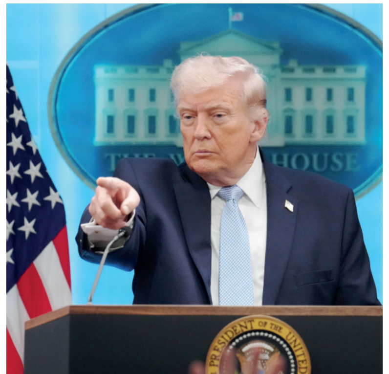
Ultimátum. El presidente estadounidense advirtió que, de no cumplirse la exigencia, avanzará con ataques contra infraestructuras críticas iraníes.

Según trascendió, el plan iraní incluye un esquema de fin de hos-