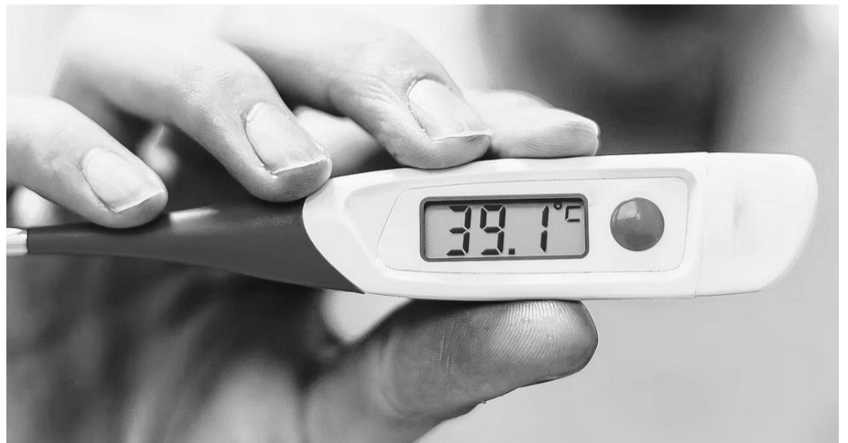
Síntoma. El cuadro clínico inicia con la aparición repentina de fiebre, generalmente mayor a 39°.

Ante esta situación, se emitió desde la provincia de Buenos Aires una alerta epidemiológica de fiebre chikungunya convocando a los equipos de salud a llevar adelante las siguientes acciones: intensificar la vigilancia de esta patología y otras arbovirosis; optimizar el diagnóstico diferencial; verificar la preparación de los servicios de salud; implementar las acciones de control ante todo caso sospechoso; y difundir las medidas de prevención y control de estas enfermedades a