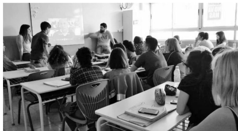
Formación. La comunidad educativa desde estar preparada para abordar conflictos.

Cada taller implica tres encuentros en el lapso de tres semanas a razón de uno por semana con cada grupalidad abordada. Antes del comienzo de los talleres, se trabaja con el Equipo de Orientación Escolar y el Equipo de Gestión para historizar los grupos y las problemáticas identificadas por la institución. Luego, al finalizar los talleres, se hace una reunión de trabajo con los mismos actores para que los talleristas puedan reponer lo trabajado, las problemáticas encontradas, pensar las formas de continuidad que la institución puede darle a lo ocurrido, como también posibles derivaciones cuidadas o formas de acompañamiento diverso según la singularidad de cada situación. ■