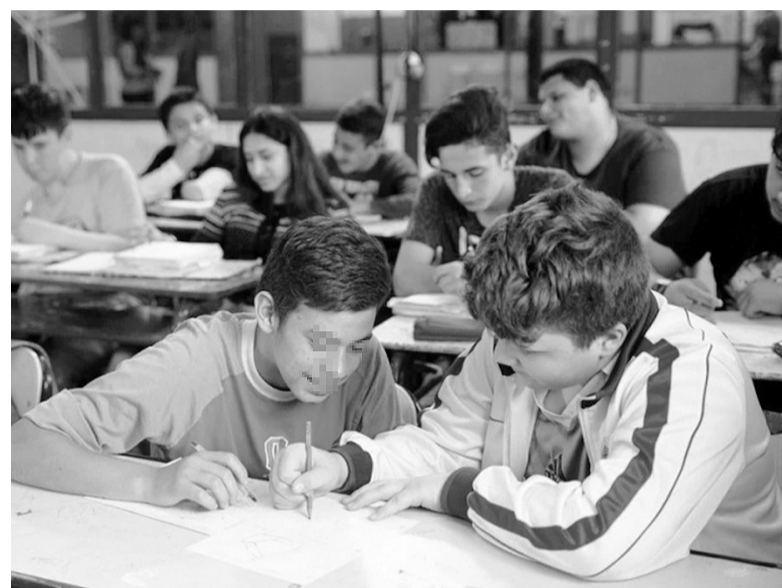
Enfoque integral. Articular salud y educación es fundamental para abordar problemáticas de salud mental.

A su vez, cuando se requiere una derivación hacia el sistema sanitario para un tratamiento individual, se trabaja junto al Equipo de Orientación Escolar, y al equipo de Región Sanitaria y del Programa “Infancias y Juventudes-Cuidados y Asistencia en Salud Mental” para realizar una