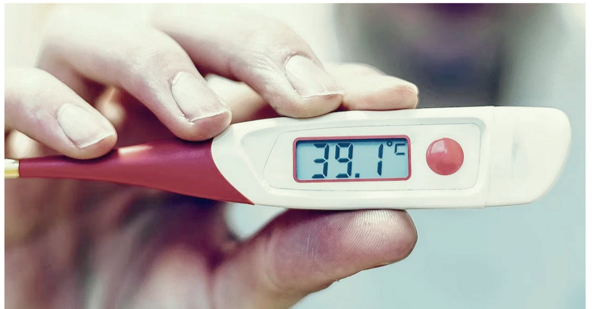
Síntoma. El cuadro clínico inicia con la aparición repentina de fiebre, generalmente mayor a 39°.

Ante esta situación, se emitió desde la provincia de Buenos Aires una alerta epidemiológica de fiebre chikungunya convocando a los equipos de salud a llevar adelante las siguientes acciones: intensificar la vigilancia de esta patología y otras arbovirosis; optimizar el diagnóstico diferencial; verificar la preparación de los servicios de salud; implementar las acciones de control ante todo caso sospechoso; y difundir las medidas de prevención y control de estas enfermedades a