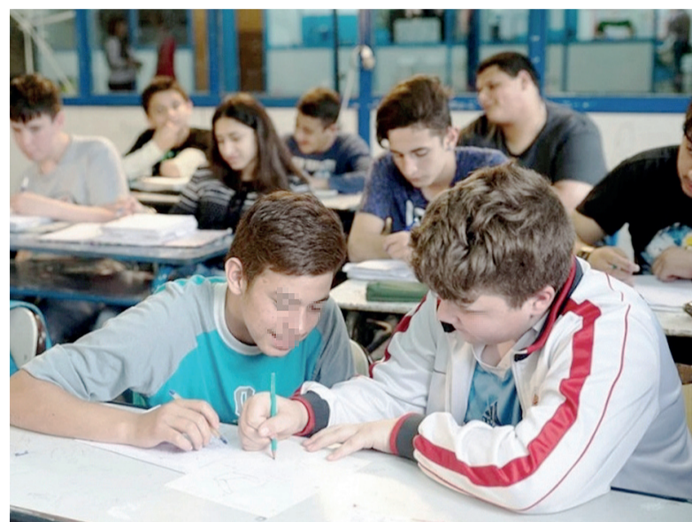
Enfoque integral. Articular salud y educación es fundamental para abordar problemáticas de salud mental.

A su vez, cuando se requiere una derivación hacia el sistema sanitario para un tratamiento individual, se trabaja junto al Equipo de Orientación Escolar, y al equipo de Región Sanitaria y del Programa “Infancias y Juventudes-Cuidados y Asistencia en Salud Mental” para realizar una