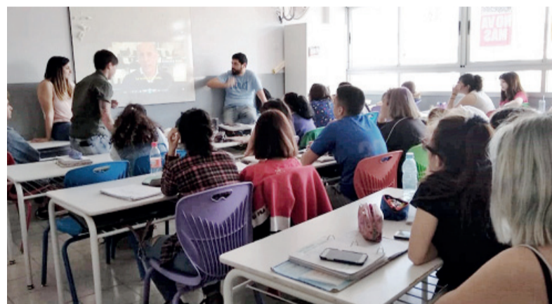
Formación. La comunidad educativa desde estar preparada para abordar conflictos.

Cada taller implica tres encuentros en el lapso de tres semanas a razón de uno por semana con cada grupalidad abordada. Antes del comienzo de los talleres, se trabaja con el Equipo de Orientación Escolar y el Equipo de Gestión para historizar los grupos y las problemáticas identificadas por la institución. Luego, al finalizar los talleres, se hace una reunión de trabajo con los mismos actores para que los talleristas puedan reponer lo trabajado, las problemáticas encontradas, pensar las formas de continuidad que la institución puede darle a lo ocurrido, como también posibles derivaciones cuidadas o formas de acompañamiento diverso según la singularidad de cada situación. ■