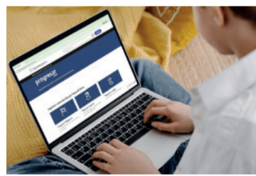
Becas. Habrá nuevas condiciones y plazos.

En cuanto a la continuidad, se determinó que la beca podrá renovarse hasta por cuatro años en el caso de quienes cursen la edu-