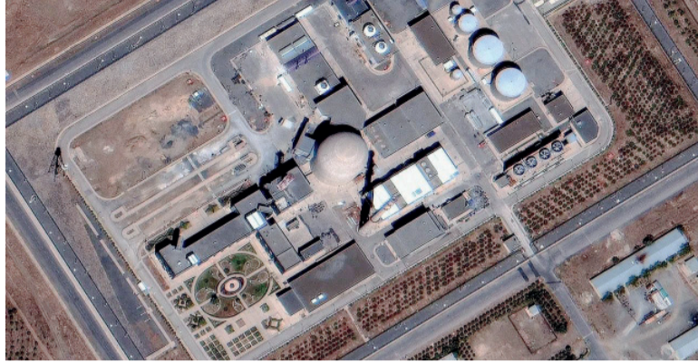
Ataques. Alcanzan reactor de agua pesada y planta de uranio en Irán.

“Esta instalación es la única de su tipo en Irán, donde las materias primas extraídas de la tierra se someten a un procesamiento mecánico y