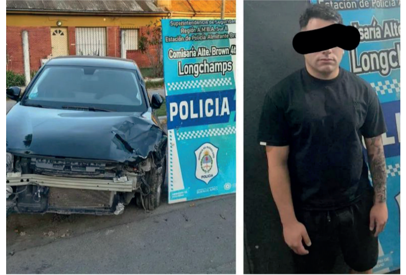
Salvaje agresión. El atacante quedó detenido

El episodio está siendo investigado como un posible intento de homicidio y el agresor quedó detenido. El caso se hizo público ya que la hermana de la joven relató lo ocurrido en redes sociales. Los videos de las cámaras de seguridad de la zona fueron clave para