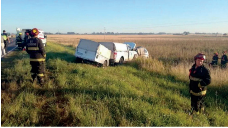
Tragedia. El accidente ocurrió en la ruta 33.

Cerca de Guaminí. Involucró a un VW Suran y una Ford Ranger. Los fallecidos iban en el auto.