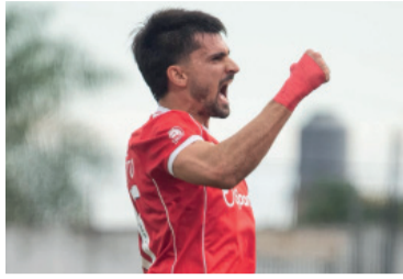
Sólido debut ante Atenas.

Independiente de Avellaneda cumplió con solidez y venció 4-2 a Atenas de Río Cuarto en el estadio Norberto Tomaghello para avanzar a los 16avos de final de la Copa Argentina.