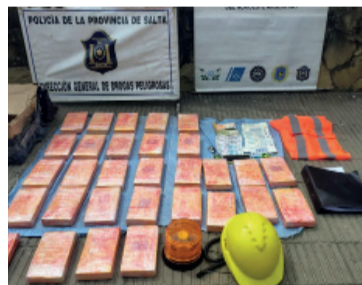
Secuestro. Incautaron drogas en un choque en Aguas Blancas

La causa quedó caratulada como "lesiones culposas agravadas por la conducción de vehículo automotor" y por darse a la fuga sin prestar colaboración a las víctimas. - DIB -