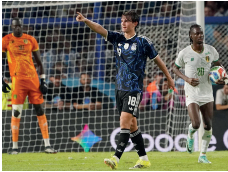
Debut goleador. Paz hizo su estreno en la red con la Albiceleste.

ni dispuso los ingresos de Lionel Messi, Rodrigo De Paul y Franco Mastantuono. Si bien la Albiceleste mantuvo la posesión inicial y Messi tuvo una chance clara tras un desborde individual, el equipo fue perdiendo fluidez con el correr de los minutos.