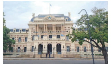
Reclamo de los docentes por la fecha de pago

Cabe recordar que el acuerdo salarial al que llegó la Provincia con los gremios contempla un aumento del 7,5% para el bimestre mar-