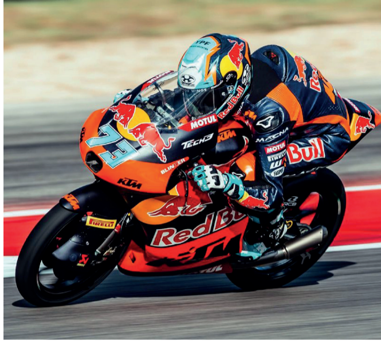
"El Coyote". Perrone se metió en el top 5 de la práctica de Austin.

máximo sus oportunidades en Austin, un trazado extenso que permite recuperar tiempo, pero que no perdona fallas en los sectores rápidos. La referencia del día fue el líder del campeonato, Máximo Quiles, quien dominó con récord de pista incluido.