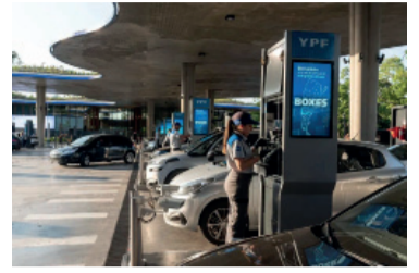
Estrategia. Podrán agregar etanol a las naftas.

En una decisión técnica orientada a mitigar el traslado del precio internacional del petróleo al mercado interno, que ronda el 20%