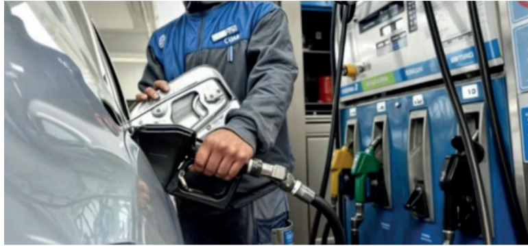
Este mes. Los combustibles aumentaron un 15% en Argentina.

El escenario internacional no ayuda al gobierno. El precio del barril de petróleo sigue en valores altos. El crudo tipo Brent, que cotiza