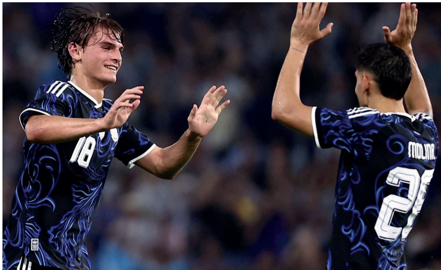
■ Sin brillar en ningún momento, la selección apenas le ganó 2 a 1 a Mauritania.

Blanco de la Casa Rosada: “Hoy quieren leer la noticia como un logro de la administración que expropió las empresas en primer lugar”, dijo Milei. Página 3