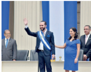
“Guerra” antipandillas. El presidente Nayib Bukele con su esposa.

“Ratificase el acuerdo de reforma constitucional” por lo que “la pena perpetua sólo se impondrá a los homicidas, violadores y terroristas (pandilleros)”, precisa el texto de la reforma que contó con el voto de 58 de los 60 diputados del Congre-