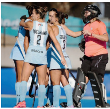
Las chicas debutan ante EE.UU.

Tras el sorteo realizado en Ámsterdam, la Federación Internacional de Hockey (FIH) oficializó este miércoles el calendario de la fase de grupos de los Mundiales femenino y masculino que se disputarán en Bélgica y Países Bajos.