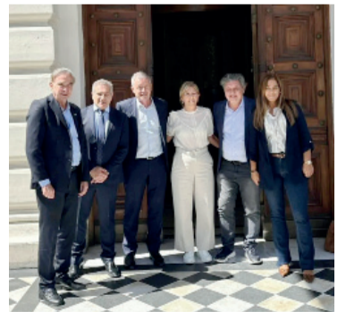
Armado. Encuentro en la Legislatura de La Plata.

Jubilados y familiares de personas con discapacidad concretaron ayer una nueva protesta en el Congreso en reclamo de aumento de los ingresos en los haberes previsionales y las prestaciones para el sector de discapacidad. Por las protestas, el Ministerio de Seguridad dispuso un fuerte operativo con un cordón policial destinado a evitar el corte de calle en las inmediaciones del Congreso. - NA -