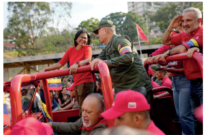
Fin de una era. Delcy Rodríguez decidió cambiar al ministro tras 10 años de gestión.

"Confío plenamente en su amplia experiencia, capacidad técnica y compromiso demostrado