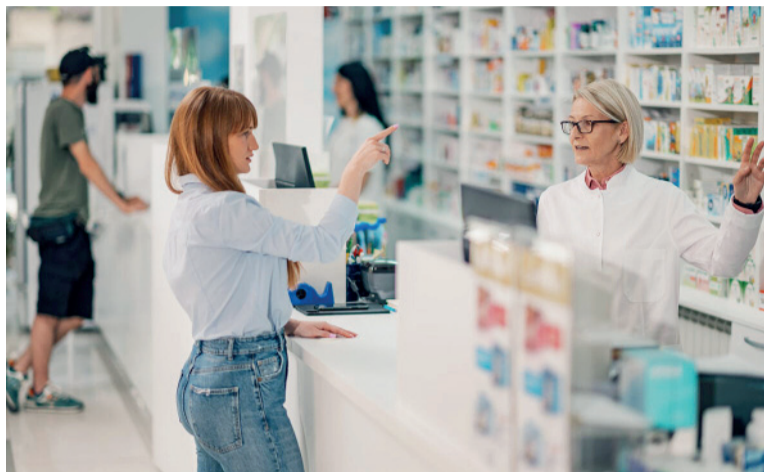
Nuevo esquema. Cambiaron la forma en la que se patentan los medicamentos en Argentina.

Uno de los ejes centrales de la medida es la implementación de un régimen transitorio que impide que nuevas patentes bloqueen la comercialización de medicamentos que ya se encuentran en el mercado. En esos casos, los titulares no podrán exigir la interrupción de la venta ni reclamar