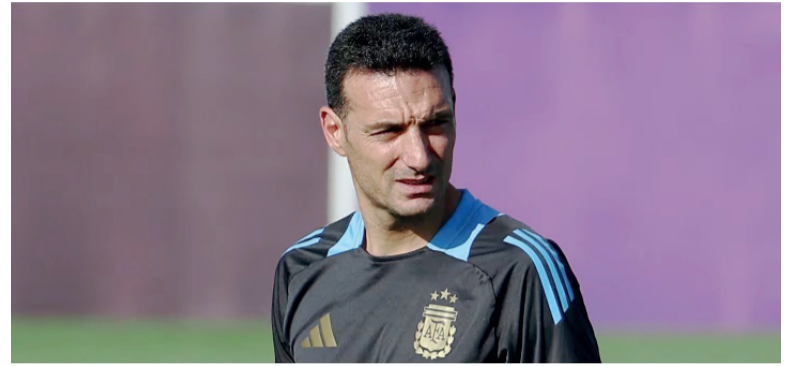
Prueba. El amistoso ante Guatemala será el último ensayo y el técnico argentino ya empieza a definir quiénes estarán en el Mundial.

También hay regresos y disputas abiertas. Juan Musso tomó ventaja en la pelea por el tercer puesto de arquero, mientras que futbolistas como Máximo Perrone, Nicolás Paz y Gianluca Prestianni vuelven a ser considerados tras buenas actuaciones en Europa. En paralelo, la continuidad de Marcos Acuña, Gonzalo