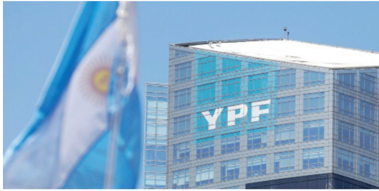
La derecha. La Cámara de Apelaciones del Segundo Circuito de Nueva York aceptó el planteo argentino y dispuso frenar cualquier avance procesal.