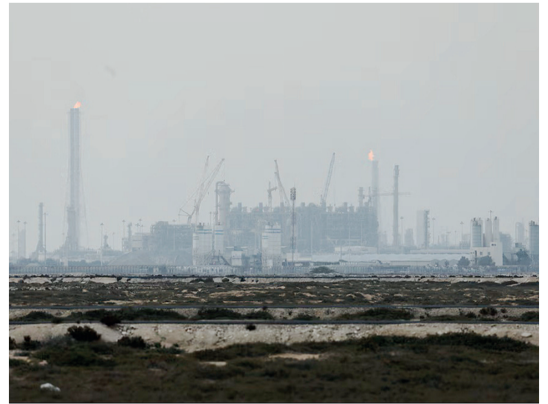
Preocupación global. El bombardeo se produjo en el complejo industrial de Ras Laffan, eje de la producción de GNL qatarí.

El gobernador de Asalouyeh, en declaraciones a la agencia semioficial Tasnim, dijo que los bombardeos provocaron incen-