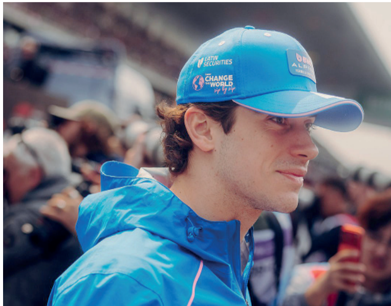
Mensaje. De Franco para el equipo Alpine: "Es la primera vez que sentimos que podemos lograr grandes resultados".

La evaluación determinó que el piloto bonaerense tuvo una calificación de 8 sobre 10, por lo que se ubicó como el sexto mejor piloto del fin de semana.