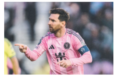
El 10 y otra marca histórica.

Lionel Messi anotó el gol 900 de su carrera en el partido de Inter Miami frente a Nashville, por la vuelta de los octavos de final de la Concacaf Champions Cup.