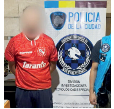
Detenido. El sospechoso es un hombre de 29 años.