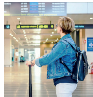
Viajeros llegando a Argentina.

Finalmente no habrá paro en los aeropuertos