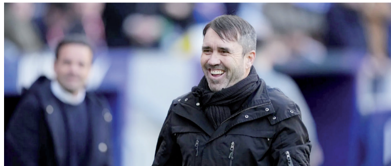
Cerrado. "Chacho", el elegido para suceder a Gallardo.

El DT del Alavés firmaría en la próxima semana hasta 2027. Gestiones clave de Francescoli.