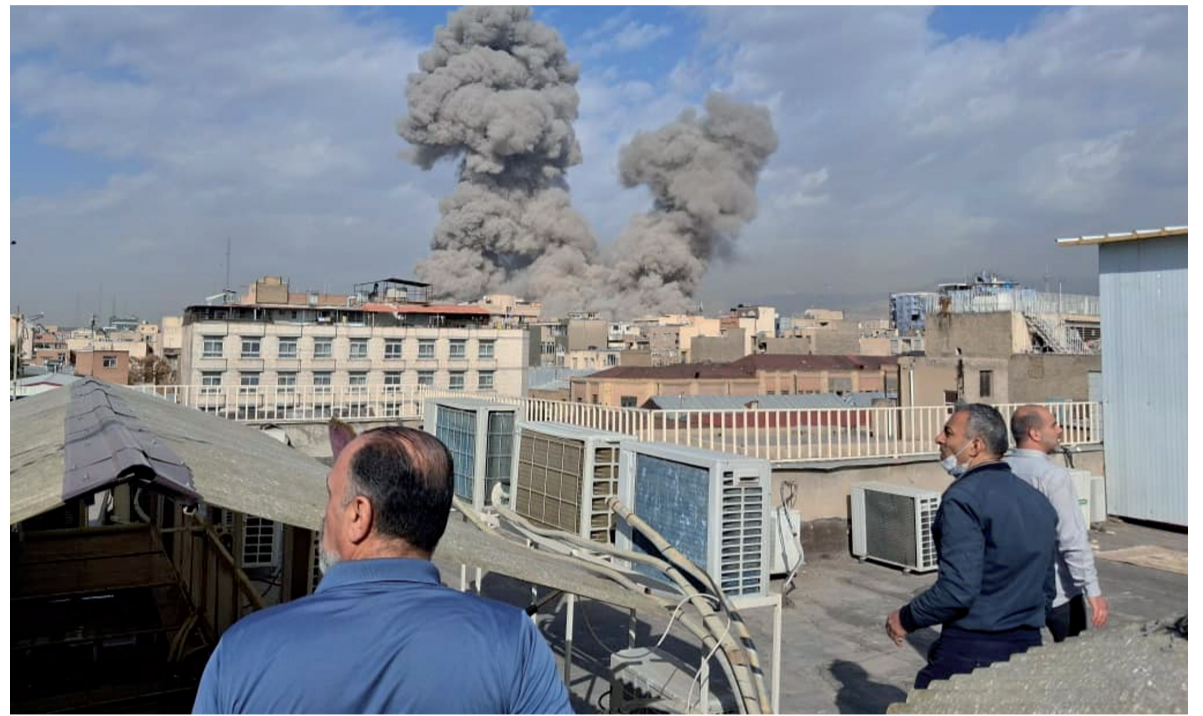
Tensión. Uno de los bombardeos impactó contra una escuela, donde murieron 53 niñas.

Varias autoridades iraníes han condenado el ataque, incluido el presidente que emitió un comunicado -en la primera comunicación pública desde que comenzaron esta mañana los ataques conjuntos de Israel e Estados Unidos a Irán- condenando los hechos.