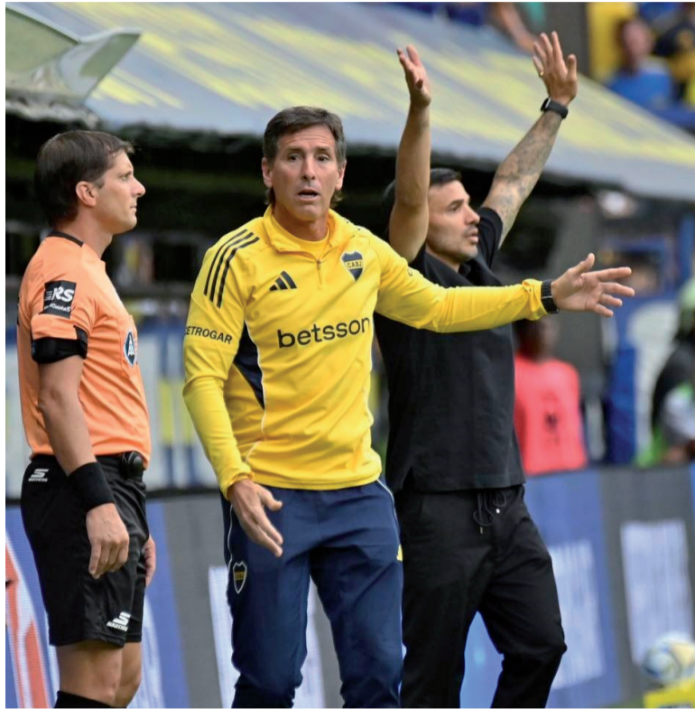
En la mira. Úbeda sigue sin encontrarle la vuelta al equipo.

Al local le costó recomponerse. El juego se volvió más desprolijo y las únicas insinuaciones nacieron desde los envíos de Blanco. A los