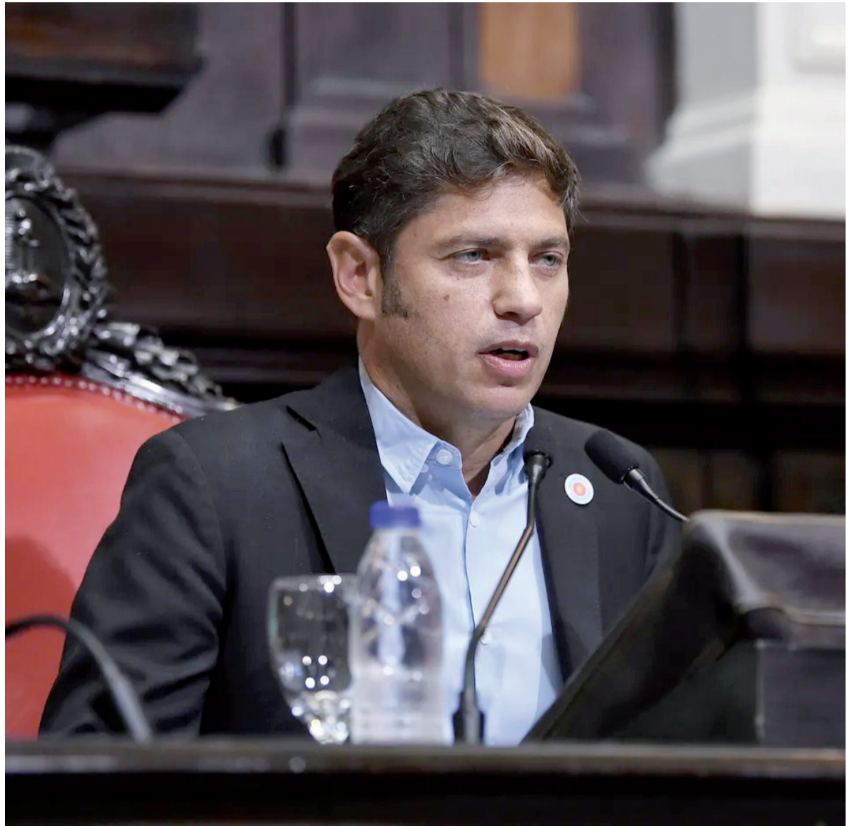
Cr ticas. Dedicar  buena parte de su discurso ante diputados y senadores a denunciar lo que considera un impacto devastador de la pol tica econ mica de Javier Milei.

La pelea por ahora no implica la salida de kirchneristas del gabinete, pese a que la idea de “acuerdos rotos” induce a pensar en eso. Pero obliga a mirar el funcionamiento del Senado, una