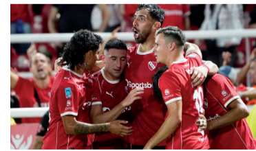
Delirio. El Rojo se prende en la lucha.