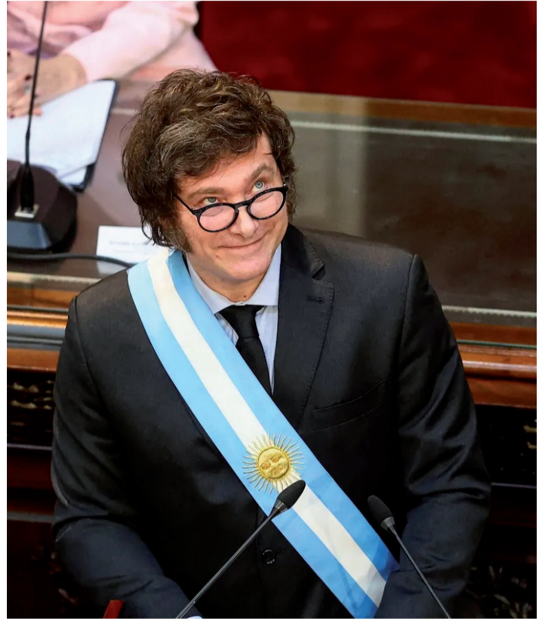
En buena racha. El mandatario llega con mayor respaldo parlamentario y busca avanzar con cambios tributarios, electorales y judiciales.

En materia judicial, el Senado deberá resolver la integración de la Corte Suprema de Justicia de la Nación, que actualmente funciona con tres miembros. El oficialismo también promueve el traspaso del fuero laboral nacional a la órbita de la Ciudad Autónoma de Buenos Aires y requiere