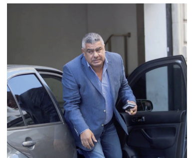
Denegada. La extensión del viaje que solicitó el dirigente que fue llamado a declaración indagatoria.

La estrategia de la defensa se apoya en que aún está pendiente una apelación ante la Cámara Nacional en lo Penal Económico contra la decisión que rechazó el sobreseimiento por inexistencia de delito. Los letrados sostienen que resoluciones del Ministerio de Economía -como la 17/2024 y sus prórrogas- suspendieron ejecuciones fiscales contra asociaciones civiles, lo que, a su criterio, impe-