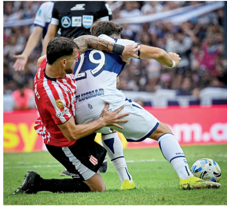
Dureza. El "Pincha" apeló al rigor ante la permisividad arbitral.

Gimnasia y Estudiantes empataron 0-0 en la quinta fecha del Torneo Apertura. Muslera fue clave para la visita, que se fue conforme con el punto.