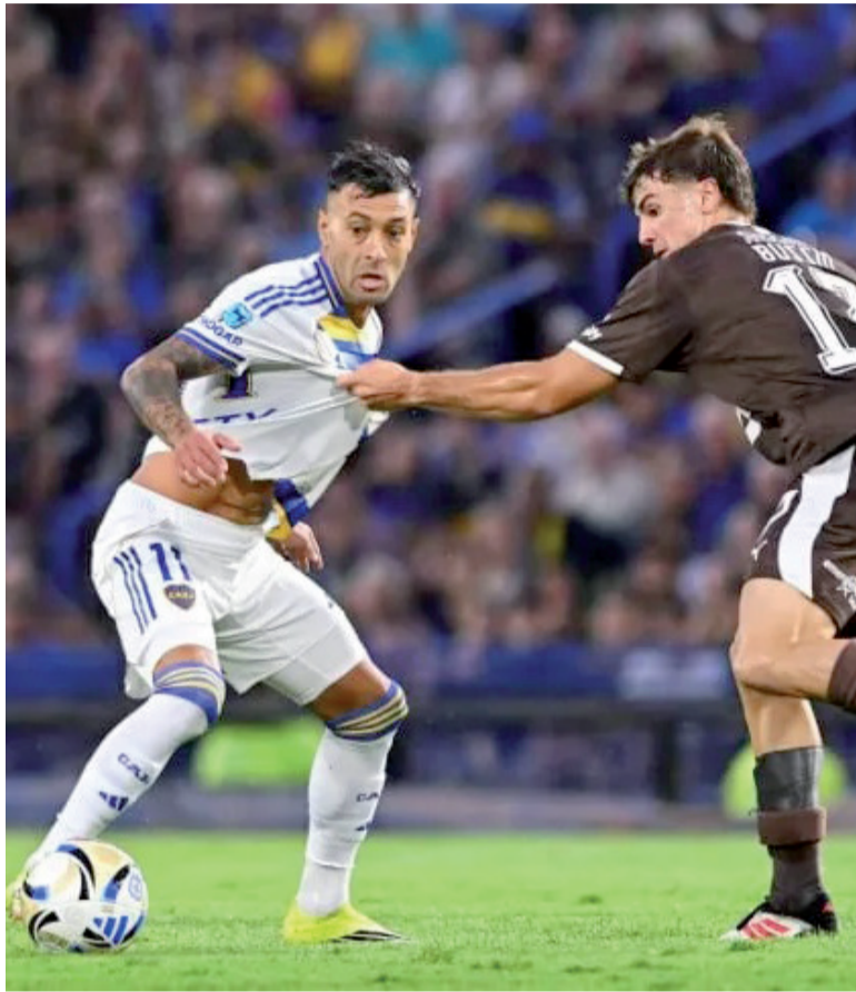
Tedio. Otro partido en casa para el olvido del "Xeneize".