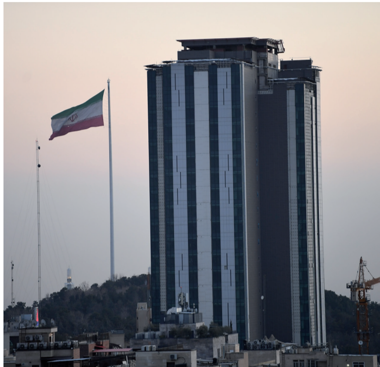
Diálogo. El presidente Masoud Pezeshkian ordenó a comienzos de mes el inicio de negociaciones con EE.UU.

El secretario de Estado estadounidense, Marco Rubio, dijo que Trump prefiere la diplomacia y una solución negociada. "Nadie ha logrado jamás un acuerdo exitoso con Irán, pero lo intentaremos", declaró Rubio en una conferencia de prensa en Bratislava.