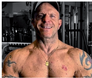
En la mira. Investigan vínculos sospechosos con casinos de Las Vegas.

En paralelo, las autoridades evaluarán la documentación presentada por el abogado del comunicador, para justificar sus