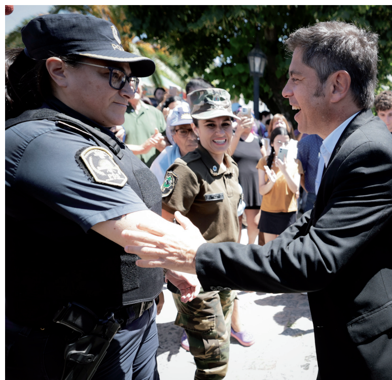
Riesgo. La tensión con los gremios tiene un correlato político doble, con impacto para Kicillof, pero también con costo para la dirigencia sindical.

La tensión con los gremios tiene un correlato político doble, con impacto para Kicillof, pero también con costo para la dirigencia de esas