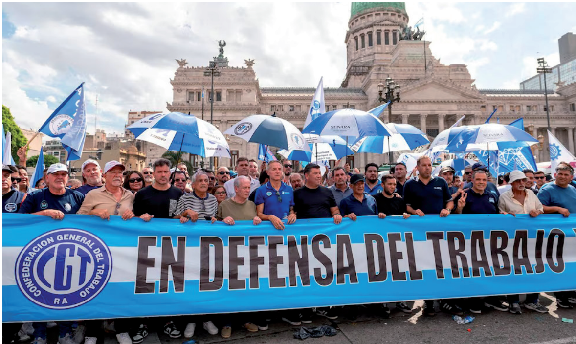
Reunión clave. Mañana, la CGT definirá si convoca a un paro para rechazar la iniciativa.

Uno de los puntos más controvertidos es la reducción del porcentaje salarial durante licencias por enfermedades o accidentes ajenos al trabajo. El ministro de Desregulación, Federico Sturzenegger, defendió públicamente la medida al sostener que apunta a desincentivar abusos. Desde la CGT replicaron que el esquema "agrava la situación del trabajador en momentos de mayor vulnerabilidad"