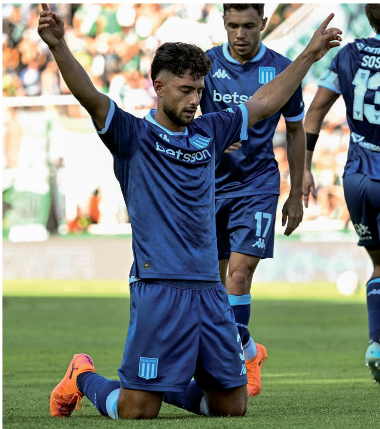
En racha. La "Academia" sumó su segunda victoria al hilo.