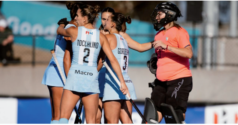
Regularidad. Cuarta victoria consecutiva.

Superaron por 3-0 a Australia en la segunda ventana de la FIH Pro League y alcanzaron los puestos de vanguardia.