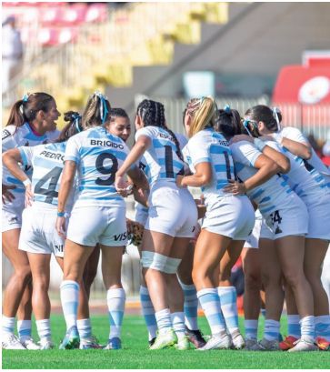
Unión. El Seven pisó fuerte.

Al finalizar las tres series, los cuatro mejores equipos clasifica-