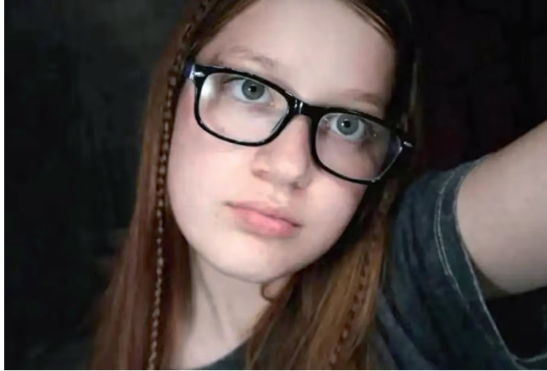
Reconstrucción. La adolescente bajó de un colectivo y se dirigía a su casa en Villa Elvira.

Una cámara de vigilancia fue clave para reconstruir lo ocurrido, ya que la víctima había regresado de cursar en la fa-