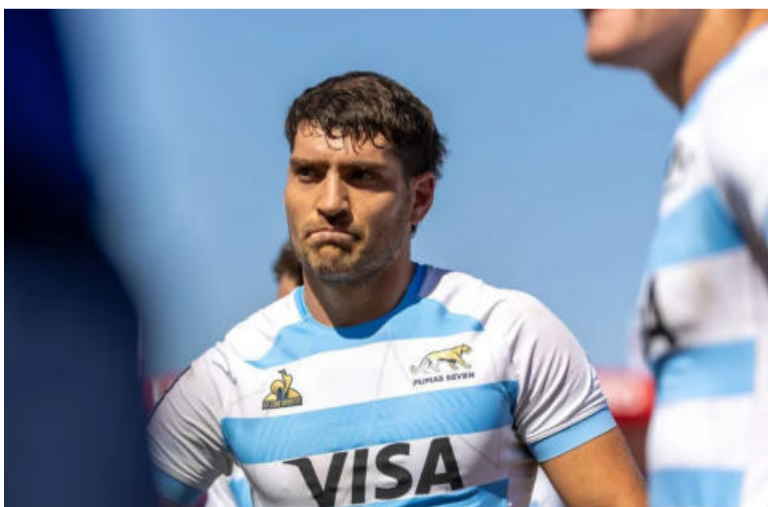
Desazón. El equipo no levanta.

Ahora se medirán ante Francia, desde las 00.36, en las semifinales por el quinto puesto.