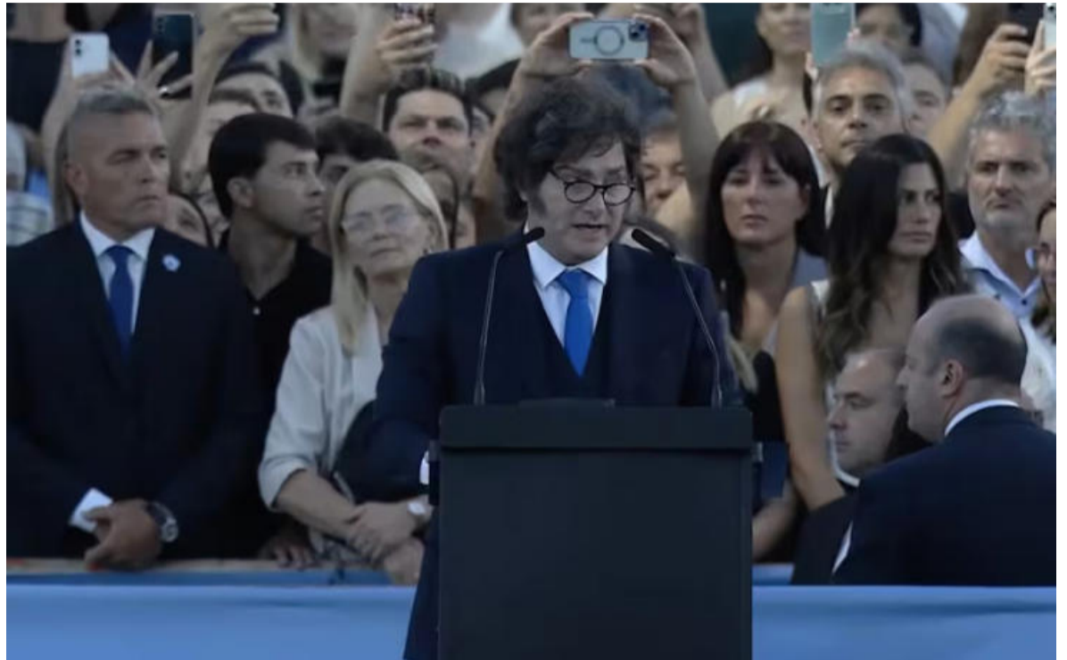
Eufórico. Así se mostró el líder libertario al llegar al acto, donde rompió el protocolo para saludar al público.

El sable corvo llegó a Santa Fe luego de una masiva despedida en el Museo Histórico Nacional, donde el jueves pasado