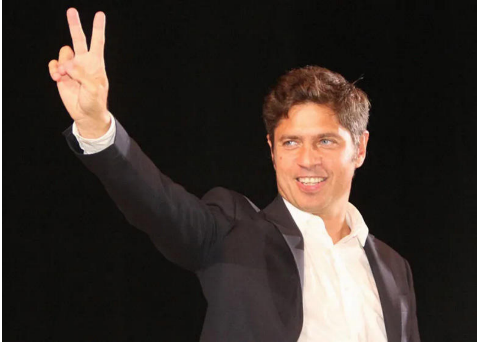
Axel Kicillof, ahora presidente del PJ.

En La C mpora no coinciden que la evaluaci n que hacen en gobernaci n. Ellos reivindican un rol estrat gico de Kirchner: "fue suya la propuesta para que Kicillof presida que termin  destrabando todo", recuerdan. Tambi n se alan que fue Cristina Kirchner quien dio la orden de llegar a un acuerdo: una