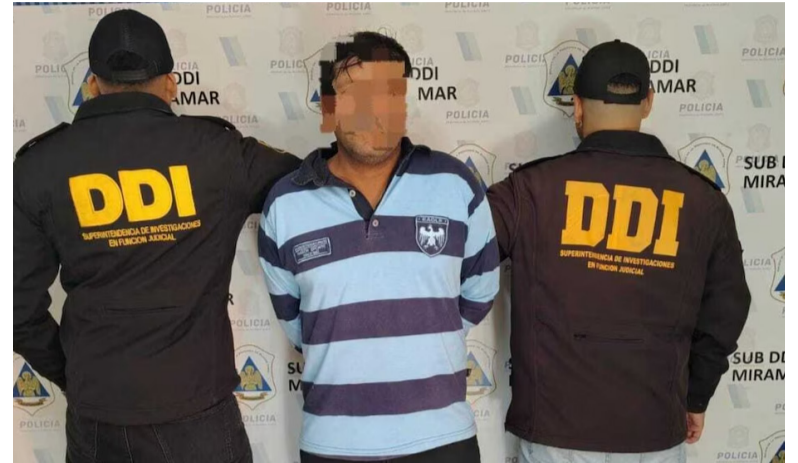
Un testigo. Fue quien identificó al presunto violador a partir de imágenes y registros oficiales.

Para ello, se debe primero extraer un perfil genético a partir de los hisopados a las víctimas, el cual se realizará el jueves de la semana próxima, a pedido de Mou-