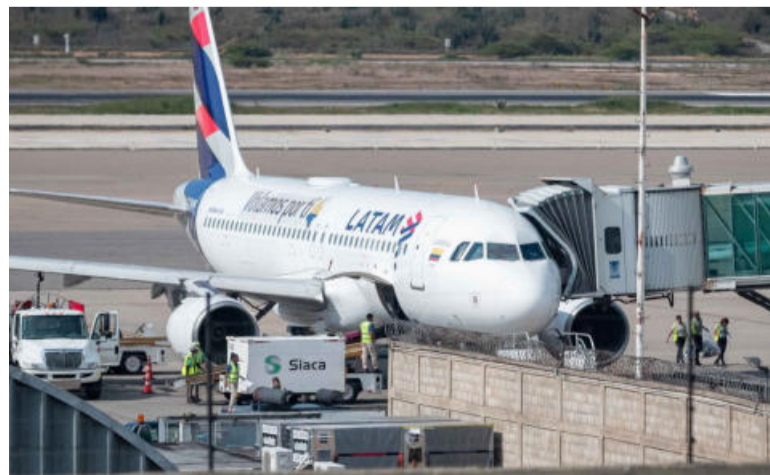
LATAM. Reiniciará los vuelos el 23 de febrero con cuatro frecuencias.

el 12 de febrero con siete vuelos semanales y LATAM el 23 de febrero con cuatro frecuencias. La brasileña GOL anunció que reanudará el próximo 8 de marzo los vuelos entre San Pablo y Caracas.