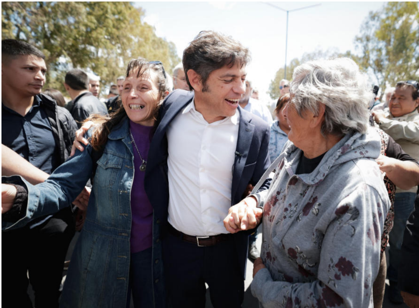
El esquema consolida al gobernador como principal conductor político del PJ en la provincia de Buenos Aires.