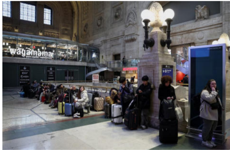
Acciones coordinadas. Eso denunció el Ministerio de Infraestructuras y las vinculó con el comienzo de los Juegos de Milán-Cortina.

La protesta se produce solo un día después de la apertura de los 25.º Juegos Olímpicos de Invierno en las ciudades de Milán y Cortina con la presencia de deportistas de 93 países de todo el mundo.