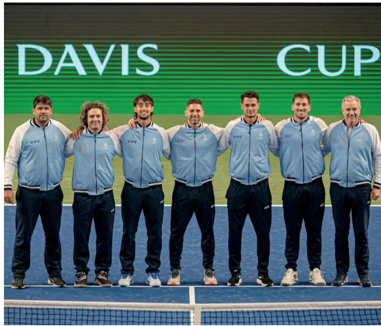
Ilusión. El plantel posó antes del inicio de la serie.

La serie comenzará el viernes desde las 23 y se extenderá hasta la madrugada del domingo. TyC