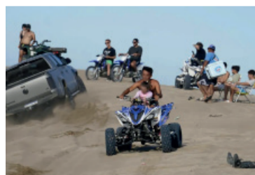
Orden. Fin al descontrol en la zona de los médanos.

El magistrado fue contundente al señalar que el municipio no puede excusarse en la titularidad privada de los predios para omitir su deber de control y prevención,