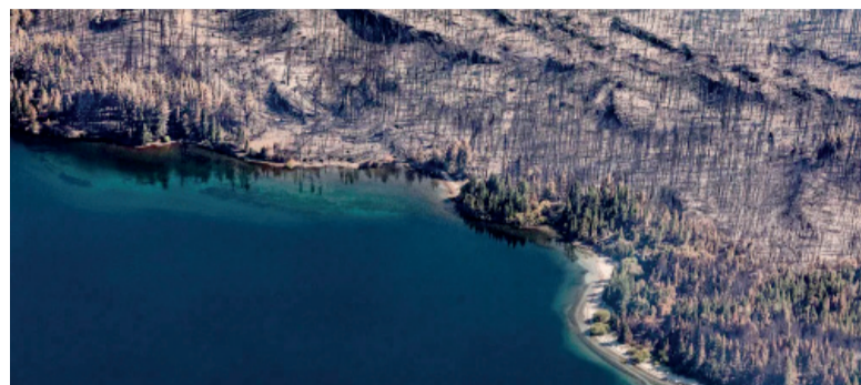
Impacto. Ya son más de 40.000 hectáreas afectadas.

La misión refuerza el posicionamiento de un Estado provincial presente y solidario con las jurisdicciones hermanas ante desastres ambientales.