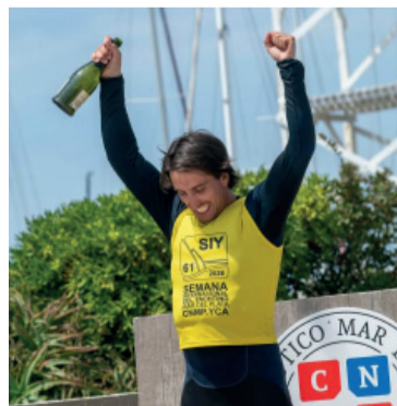
Alegría. El santafesino festejó en la categoría ILCA 7.

La definición de ILCA 6 fue la más imprevisible de la jornada. Una largada pasada de la líder parcial modificó el desarrollo de la Medal Race y abrió el camino para que Kakon aprovechara la oportunidad y se quedara con el título. Luciana