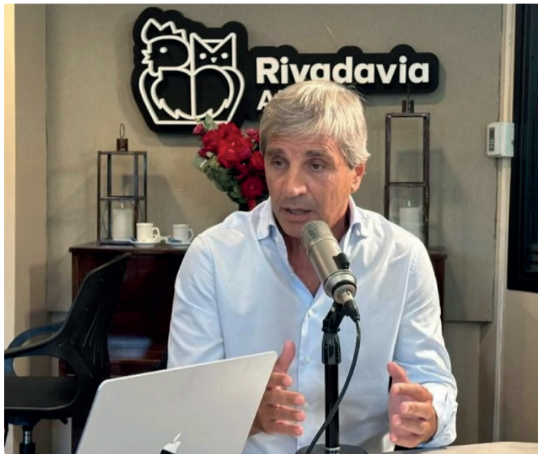
En la radio. El ministro de Economía, Luis Caputo.

Sobre la inflación que se espera para este año, el titular del Palacio de Hacienda dijo que "va a ser más baja (que la de 2025), en torno a la de (la ley de) Presupuesto (16%)". "Pude terminar siendo 18%, pero va a andar por ahí", luego del 32% del año pasado. "En mayo, cuando estábamos en 1,5% (de inflación), podíamos pensar que para enero íbamos a estar mejor", reconoció el ministro, pero aclaró que "el ataque político" durante la campaña electoral para las legislativas "tuvo implicancias en el Riesgo País y la inflación". También dijo que la prioridad es "seguir con el proceso de crecimiento, que va a ser un gran año