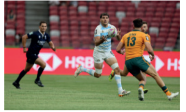
Un reto clave en Australia.

"Los Pumas" 7's ya conocen el camino que deberán recorrer en Perth, sede de la cuarta etapa del Circuito Mundial de Rugby Seven, que se disputará el sábado 7 y domingo 8 de febrero en Australia. El Seleccionado argentino llega con la necesidad de recuperar protagonismo tras el séptimo puesto obtenido en Singapur y con un desafío inmediato de alta exigencia.