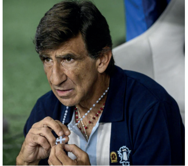
Encomendado. Costas no encuentra el rumbo de su equipo.

En el complemento, Racing intentó reaccionar y equilibrar el marcador. Martínez tuvo dos chances claras, pero Felipe Zenobio se lució con tapadas providenciales que evitaron el empate. La "Academia" se volcó sobre el área rival, presionó y generó oportunidades: a los 80 minutos, Gabriel