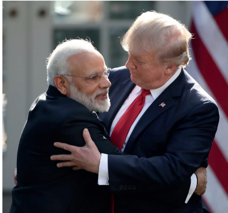
Sin confirmación. Modi no se refirió al compromiso de Nueva Delhi para dejar de comprar petróleo a Rusia.

“Me alegra que, bajo el principio de reciprocidad, los aranceles sobre los bienes indios se reduzcan al 18 %. Esto impulsará el ‘Made in India’ y fortalecerá