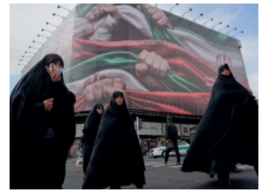
La UE acordó designar a la Guardia Revolucionaria como grupo terrorista la semana pasada.

Irán afirmó ayer que había convocado a todos los embajadores de la Unión Europea en la República Islámica para protestar que el bloque haya designado a la Guardia Revolucionaria, un cuerpo paramilitar iraní, como un grupo terrorista.