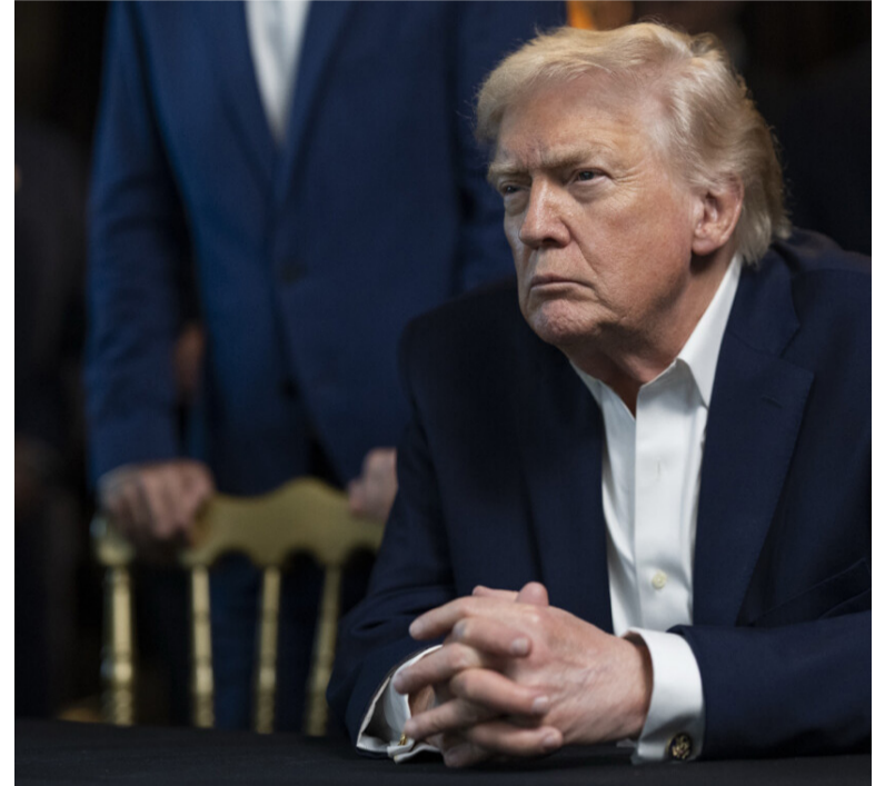
El Presidente de Estados Unidos, Donald Trump Truthsocial @realDonaldTrump

¿El hecho de que Estados Unidos dirija el país significa que habrá tropas estadounidenses sobre el terreno?, le preguntaron al presidente norteamericano. "Siempre hablan de tropas sobre el terreno, no nos da miedo. Y tenemos que tenerlas. Anoche tuvimos tropas sobre el terreno a un nivel muy alto. En realidad, no nos da miedo. Vamos a asegurarnos de que