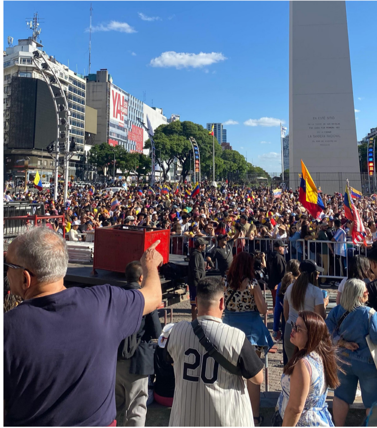
El Obelisco, epicentro de los venezolanos en Argentina.

ria, el Gobierno de la Ciudad de Buenos Aires dispuso un refuerzo preventivo de seguridad en la zona céntrica. Al caer la tarde, tanto el Obelisco como el Puente de la Mujer fueron iluminados con los colores amarillo, azul y rojo, y se colocó una bandera de Venezuela en el principal monumento porteño como gesto simbólico de acompañamiento.