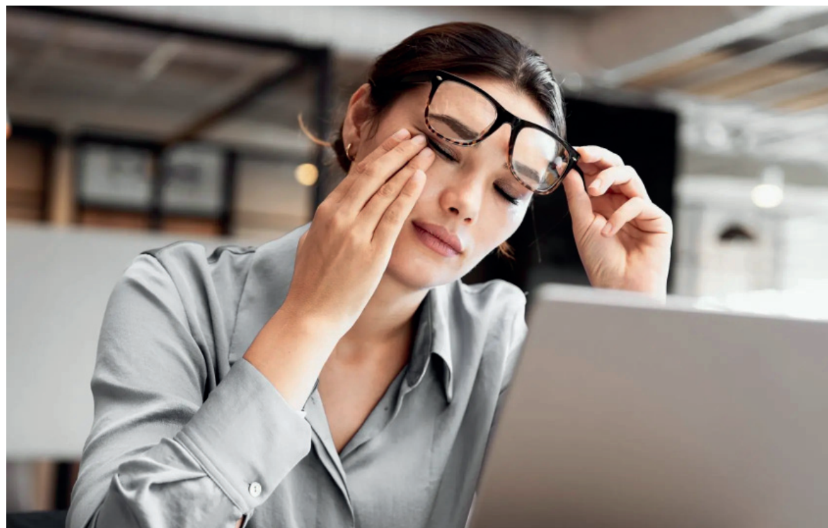
Ojos que pican. El malestar ocular dejó de ser una excepción para convertirse en un problema cotidiano. se esperaba.

En muchos casos, estos síntomas pueden aliviarse con pausas, parpadeo consciente e hidratación ocular. Sin embargo, cuando la molestia es persistente, algunas conductas pueden aumentar el riesgo de lesiones. El frote excesivo de los ojos, por ejemplo, puede favorecer el desarrollo de queratocono, una enfermedad ocular progresiva en la que la córnea se adelgaza y se deforma, generando visión borrosa, distorsionada y