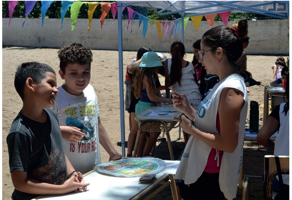
A tu cuidado. Una posta sanitaria bonaerense.

➔ La Provincia desplegó 19 postas sanitarias preventivo-promocionales en 14 municipios turísticos.