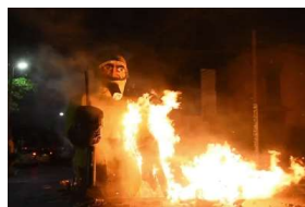
En 10 y 40, El Eternauta.

La Plata: la quema de muñecos volvió a marcar el 1º de enero