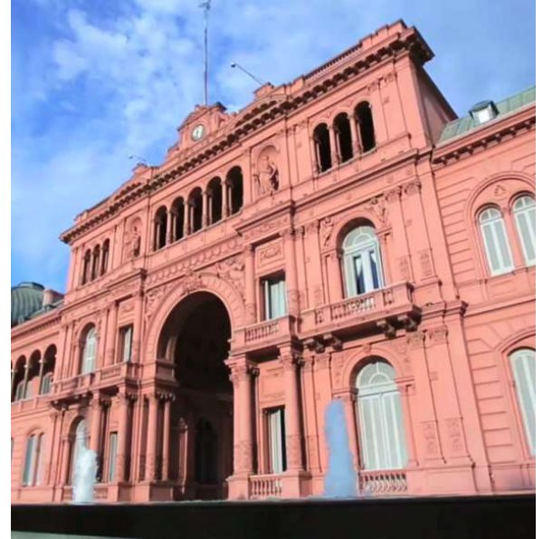
Al Boletín. El Gobierno reformará los servicios de inteligencia.

Los voceros señalaron que los titulares de los órganos desconcentrados serán designados por el secretario de Inteligencia, reforzando la conducción jerárquica y el control interno del sistema. Aclararon que "el sistema no cumple tareas policiales ni judiciales, sino que produce inte-