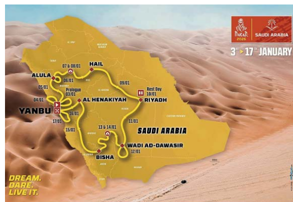
Recorrido. De Yanbu a Yanbu, el Dakar 2026.