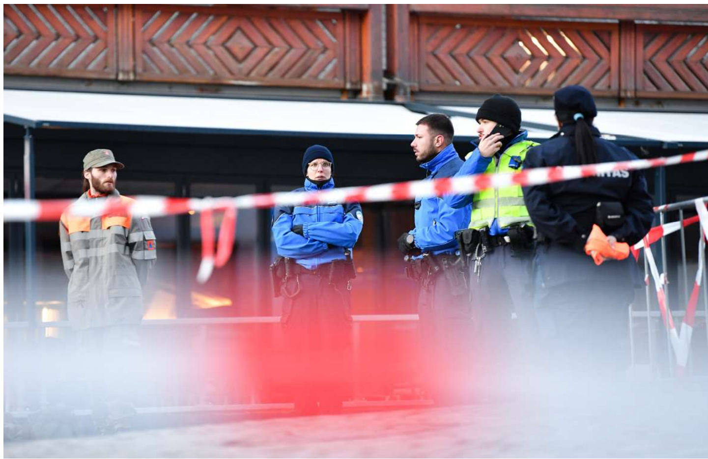
■ Horror en Año Nuevo. Decenas de muertos en las primeras horas de 2026.

ser publicado hoy. El mismo deberá ser tratado en el Congreso por la Comisión Permanente de Trámite Legislativo, que tendrá diez días hábiles después de que el Gobierno lo envíe. Página 3