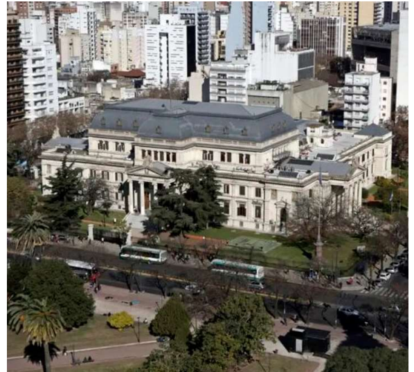
Horror. La Legislatura de la provincia de Buenos Aires.

En ese marco, las víctimas relataron haber sido sometidas a rituales, entrenamientos, controles permanentes y amenazas, además de recibir mensajes intimidatorios a través de correos electrónicos y otras vías digitales. Las comunicaciones internas del grupo utili-