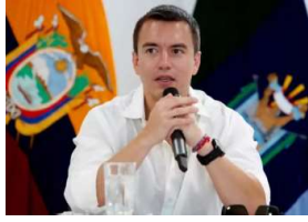
El presidente Daniel Noboa.

El presidente de Ecuador, Daniel Noboa, decretó un nuevo "estado de excepción" focalizado por 60 días en nueve provincias y tres municipios del país, por la "grave conmoción interna" provocada por el incremento de la violencia criminal.