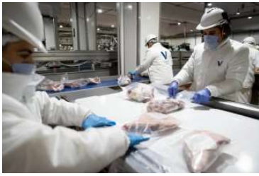
Cambios desde Beijing.

El Ministerio de Comercio de China anunció el miércoles un arancel adicional del 55% a las importaciones de carne vacuna de Argentina, Brasil, Uruguay, Australia y Estados Unidos que superen las cuotas anuales definidas.