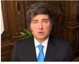
Video del presidente Javier Milei.

"Hemos cumplido todas las promesas de campaña"