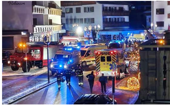
Horror. Las víctimas tendrían entre 15 y 20 años.

Se puso en marcha una investigación para determinar la causa de la explosión, pero las autoridades