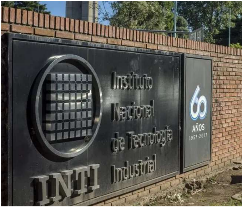
Menos atribuciones. El Instituto Nacional de Tecnología Industrial.

Entonces, “el servicio metrológico legal argentino cuenta con una oferta suficiente de laboratorios y organismos de certificación acreditados ante el OAA, que permite