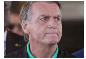
El expresidente brasileño Jair Bolsonaro.

El Tribunal Supremo Federal de Brasil rechazó la solicitud del expresidente Jair Bolsonaro de convertir su detención por intento de golpe de Estado en arresto domiciliario. Los abogados de Bolsonaro presentaron la petición el miércoles, alegando un "riesgo real de deterioro repentino" en la salud del exmandatario, según informó la agencia ANSA.